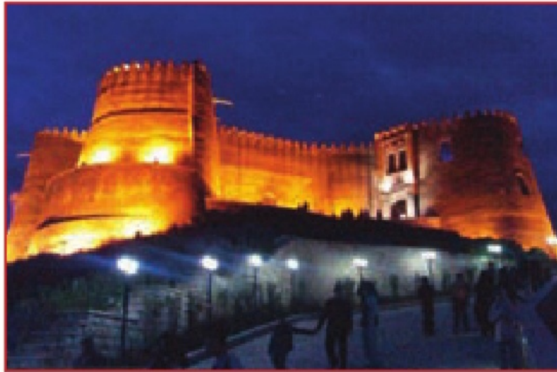
قلعه فلک الافلاک در خرم آباد - یکی از اماکن مستحکم در دوران قدیم ایران