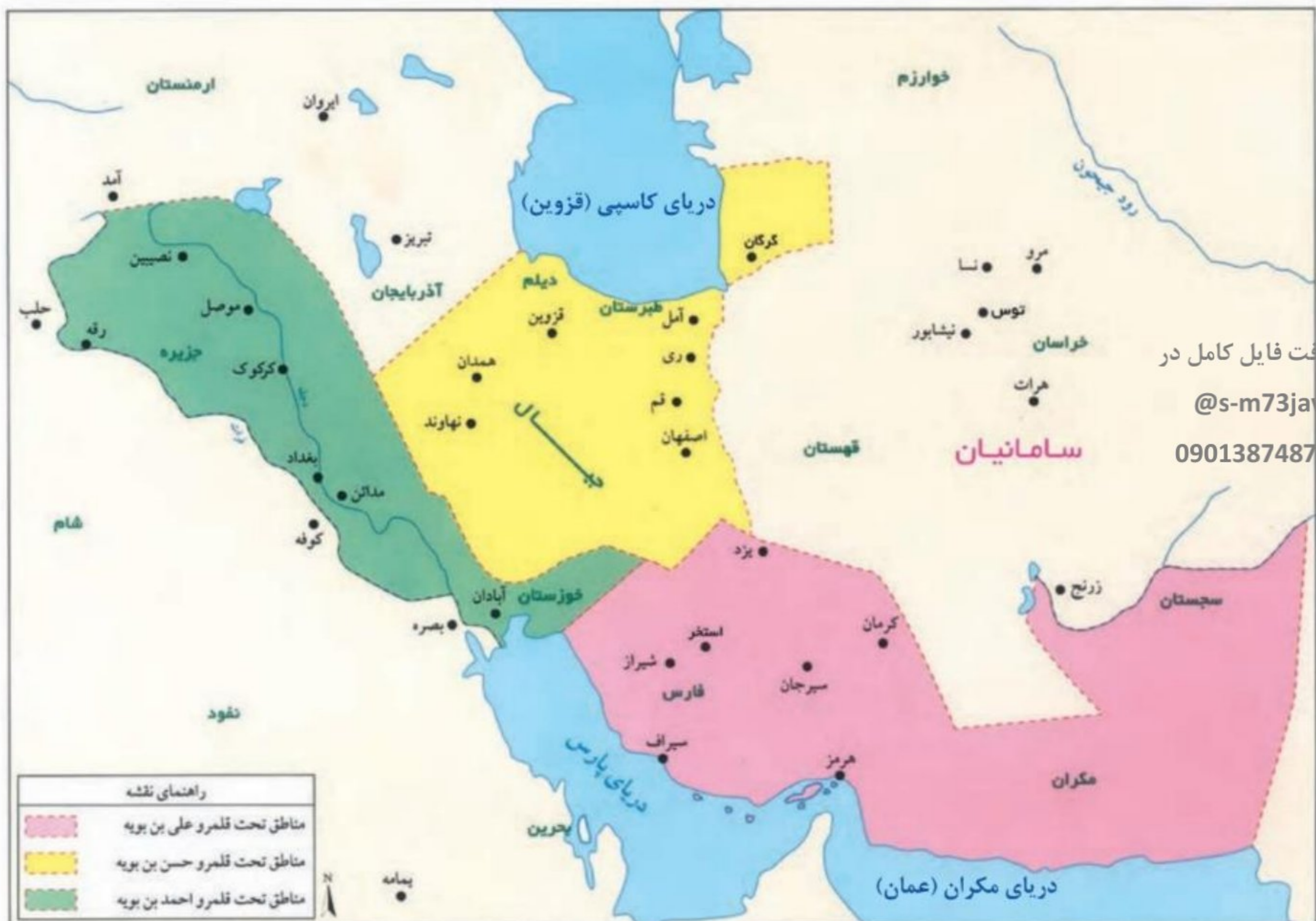
قلمرو سامانیان و آل بویه

به نظر شما چرا امیران آل بویه پس از فتح بغداد، خلافت عباسی را از بین نبردند؟