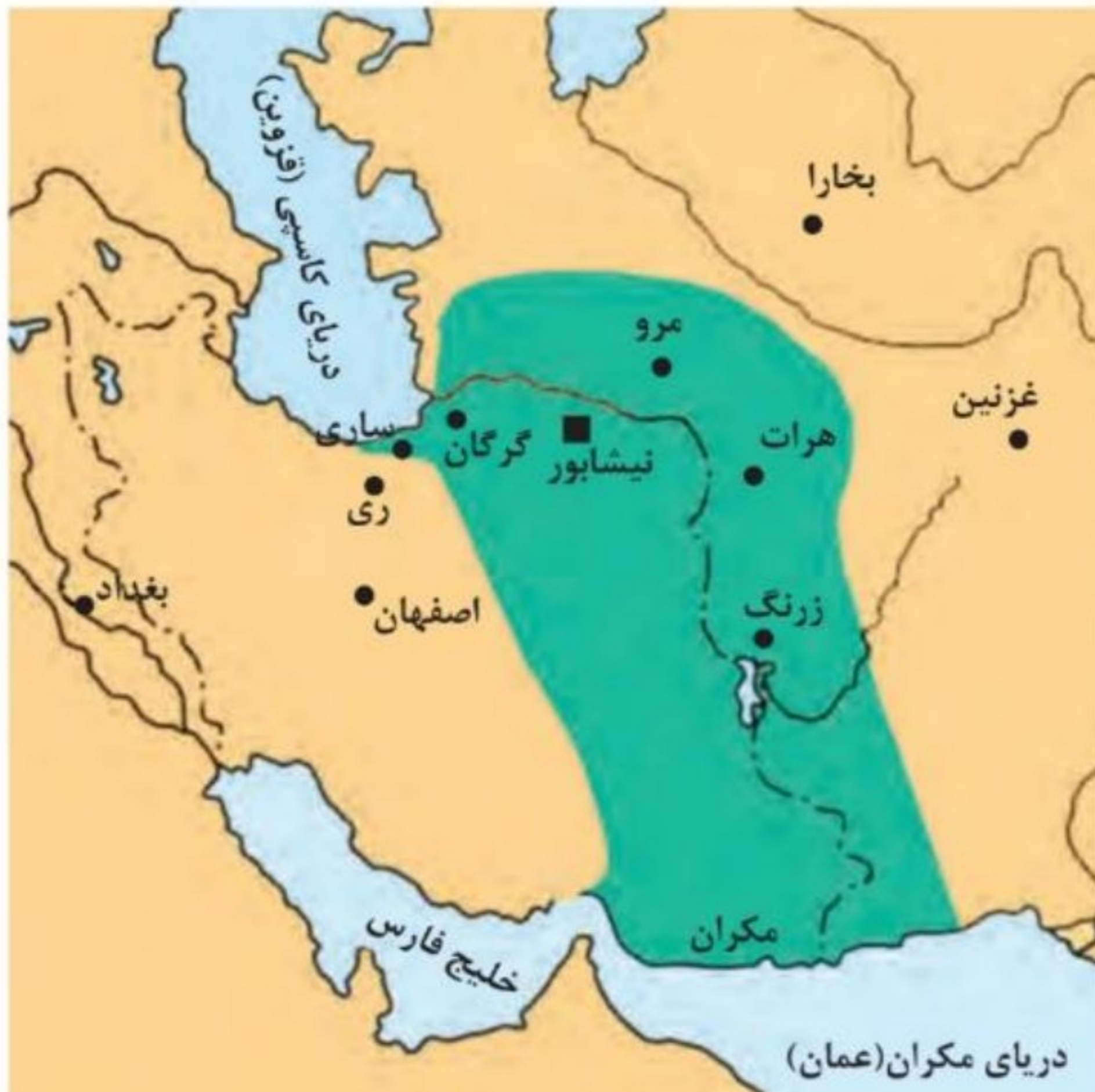
قلمرو فرمانروایی طاهریان

با توجه به اینکه نخستین سلسله مسلمان ایرانی یعنی طاهریان در خراسان شکل گرفت، با راهنمایی دبیر و با توجه به مطالبی که در درس‌های قبل خواندید، درباره جایگاه و اهمیت سیاسی و اجتماعی خراسان و نقشی که خراسانیان در تحولات سیاسی قلمرو خلافت داشتند، بحث و گفت‌وگو کنید.