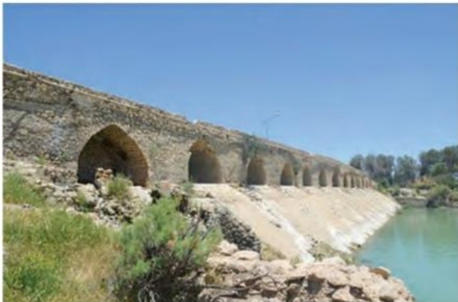
بند امیر از آثار دوره عضدالدوله فرمانروای آل بویه - مرودشت فارس

۱۵- پیامدهای مذهبی به قدرت رسیدن حکومت های ایرانی در سده های ۳ تا ۵ق را شرح دهید؟