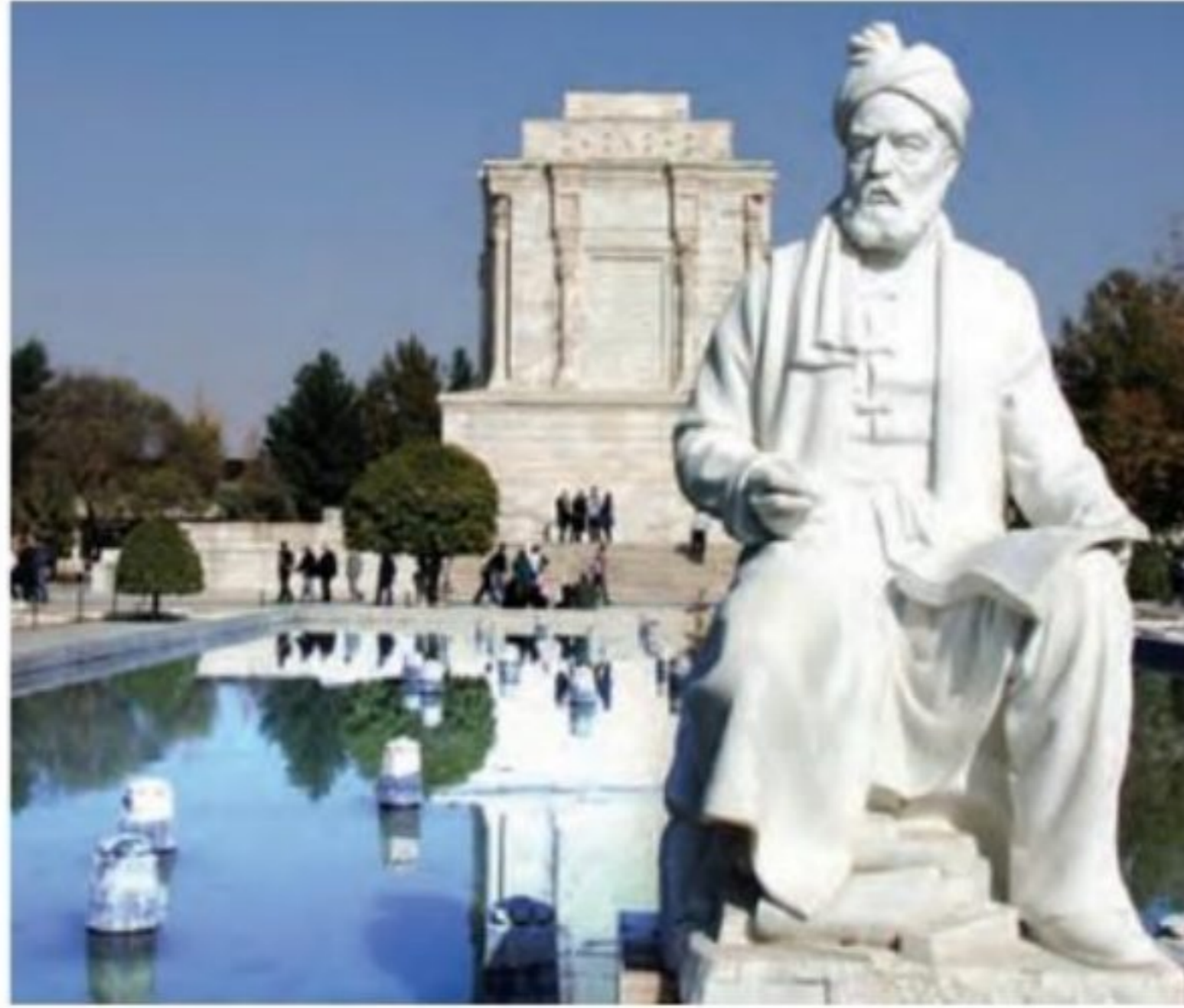
آرامگاه فردوسی - توس (مشهد)

۱۷- چه عواملی باعث رشد علم در سده ۳ تا ۵ ق شد؟