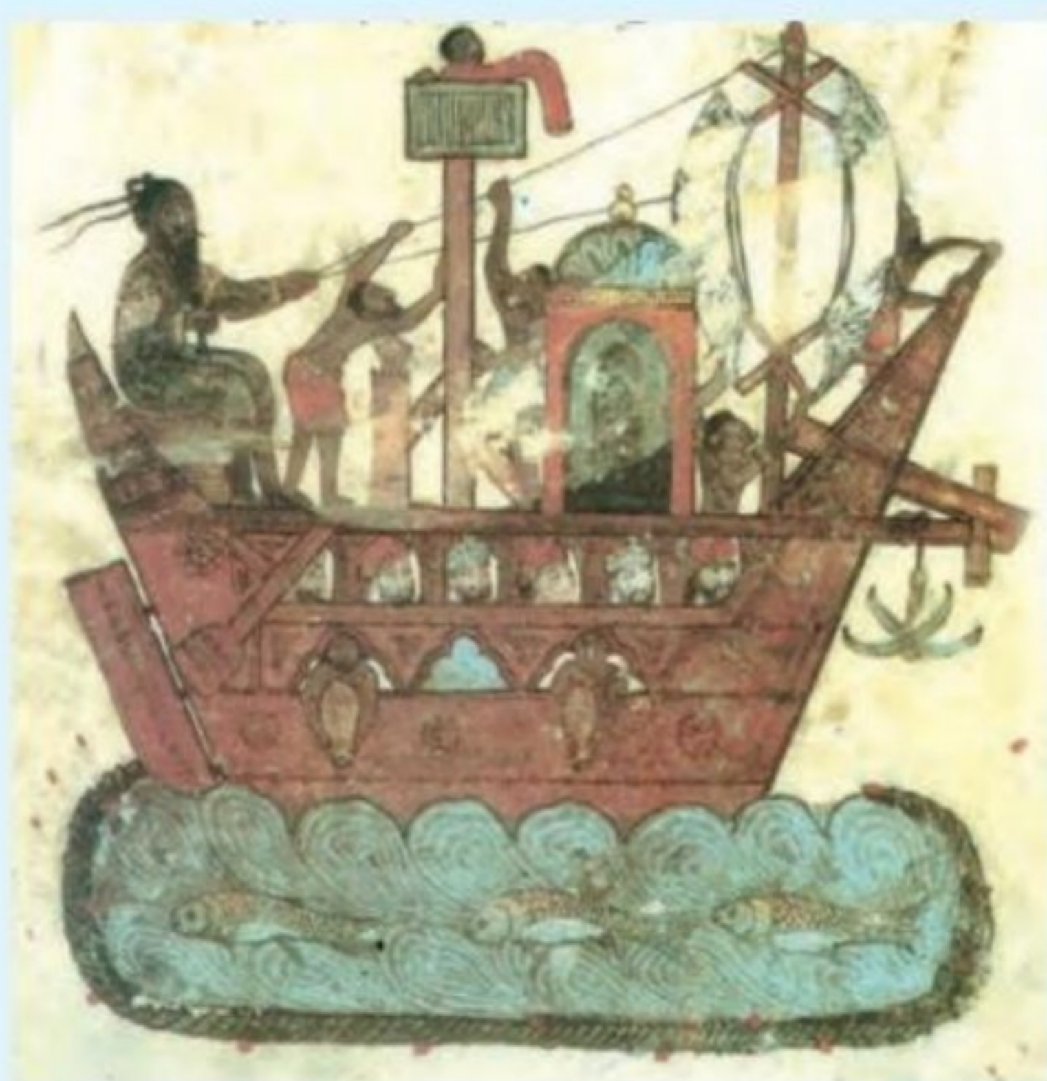
نقاشی کشتی روان بر روی آب از کتاب مقامات حریری

دریانوردان ایرانی تجربیات و اطلاعات خود را در کتابچه‌هایی با عنوان رهنامه که در واقع راهنمای سفرهای دریایی بود، ثبت و ضبط می‌کردند. این اطلاعات و دانستنی‌ها شامل بادهای موسمی و جهت وزش آن، نحوه تعیین موقعیت‌های دریایی، شیوه تعیین فواصل دریایی، نحوه استقرار بادبان‌ها در موقعیت‌های گوناگون، جهت‌یابی دریایی در شب و روز، شناسایی موقعیت ستارگان در شب، مسیرهای دریایی و موانع آن، بنادر و جزایر مشهور و نقشه‌های دریایی بود (اطلس تاریخ بنادر و دریانوردی ایران، ج ۲، ص ۳۴۸).