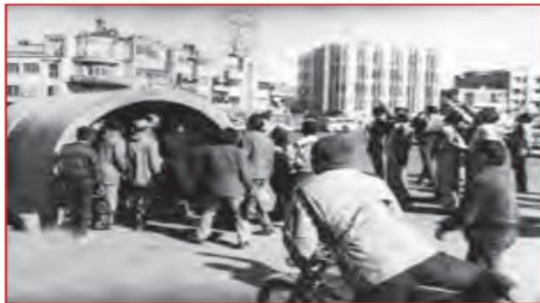
نمونه ای از پناهگاه های عمومی

۶ — مقاوم سازی و استحکامات: یکی از کارهای مفیدی که در زمان صلح می توان انجام داد تا در زمان حادثه از آن استفاده شود، ساخت مکان هایی است که در مقابل بمب و موشک مقاوم باشد و آثار ترکش و موج انفجار را تا حدود زیادی خنثی کند. بنابراین احداث پناهگاه در مجتمع های مسکونی و اداری و همچنین ساخت پناهگاه های عمومی در شهرها، یکی از اقدامات مفیدی است که باعث حفظ جان انسانها در زمان وقوع حادثه می شود.