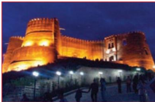
قلعه فلک الافلاک در خرم آباد - یکی از اماکن مستحکم در دوران قدیم ایران

و ساختن زره را به خاطر شما به او (حضرت داوود) تعلیم دادیم، تا شما را در جنگ‌هایتان حفظ کند: آیا شکرگزار (این نعمت‌های خدا) هستید.