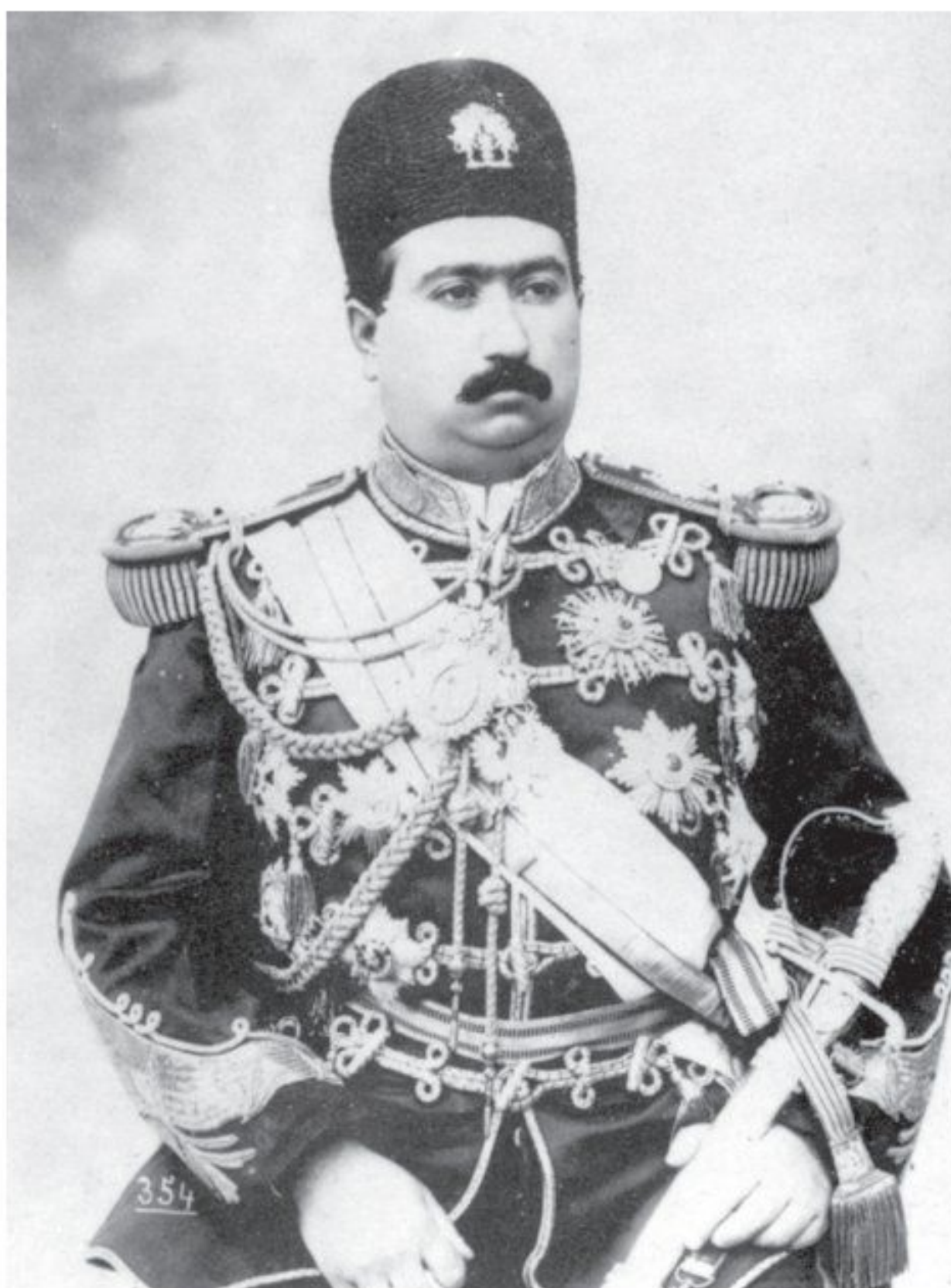
محمدعلی شاه قاجار

1 بعد از مظفرالدین شاه، ولیعهد او، محمدعلی میرزا، با عنوان محمدعلی شاه، به سلطنت رسید. (1) محمدعلی شاه، نمی‌خواست در برابر قانون اساسی و مجلس شورای ملی تمکین کند. او در ۲۸ دی ۱۲۸۵ جشن تاج‌گذاری برپا کرد و از اشراف و نمایندگان دولت‌های خارجی برای شرکت در این مراسم دعوت به عمل آورد، اما نمایندگان مجلس شورای ملی را دعوت نکرد. این، اولین بی‌اعتنایی محمدعلی شاه به مجلس بود. (2) پس از این ماجرا، کشمکش محمدعلی شاه با مجلس آغاز شد که سرانجام وی مجلس را به توپ بست؛ اما این، تنها مشکل نظام تازه تولد یافته مشروطه نبود، بلکه این نظام، دشواری‌هایی اساسی‌تر پیش رو داشت که به شرح آنها می‌پردازیم: