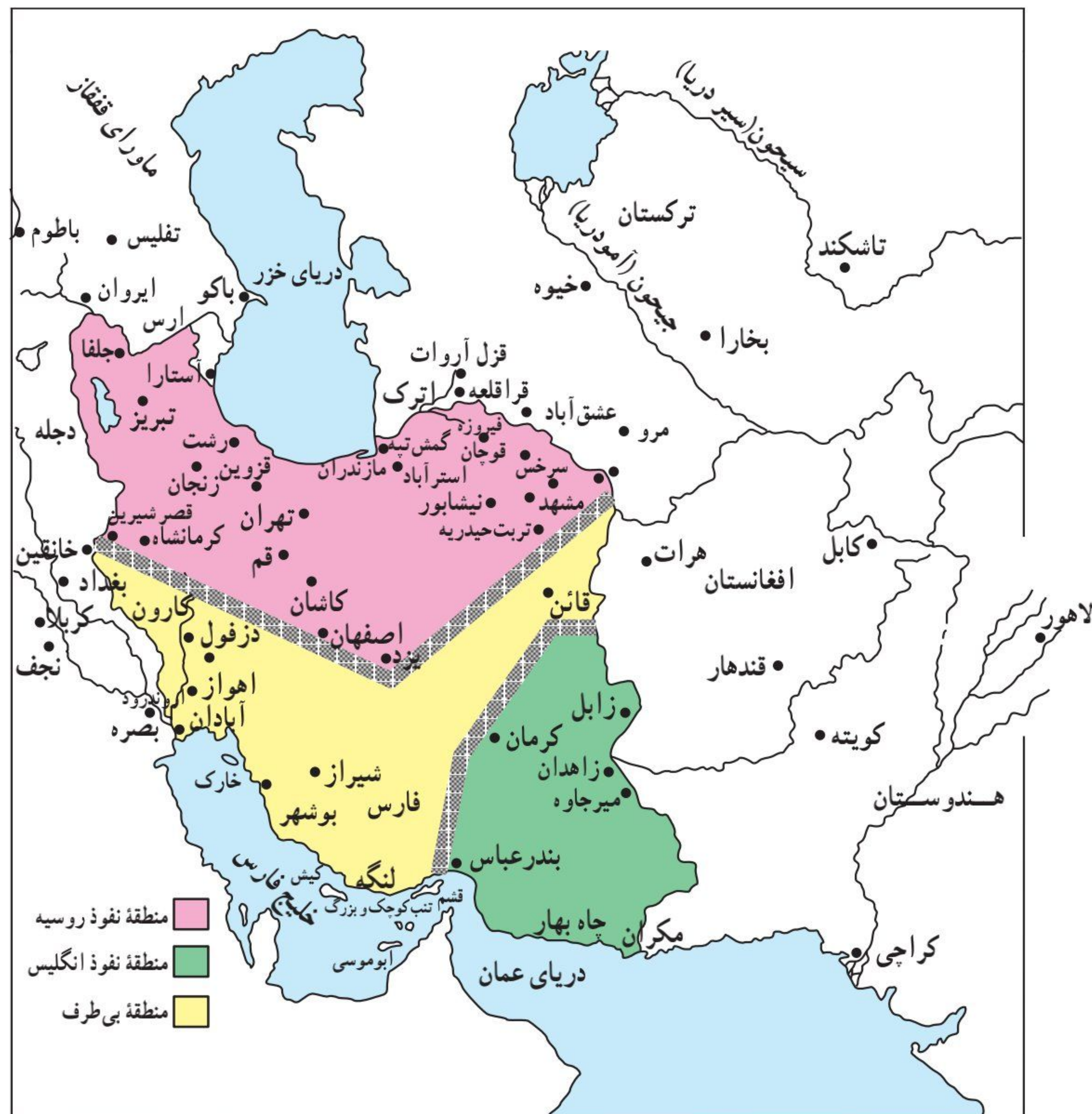
نقشه تقسیم ایران براساس قرارداد ۱۹۰۷

قرار گرفتن مستعمره‌های روس و انگلیس در جاهای دیگر دنیا، توسط استعمارگر جدید یعنی آلمان، آنها اختلاف‌ها را کنار گذاشتند و به موجب قرارداد ۱۹۰۷، ایران را بین خود تقسیم کردند. بر اساس این قرارداد روس و انگلیس، با پادرمیانی فرانسه که از قدرت روزافزون آلمان بیمناک بود، ایران را به سه منطقه تقسیم کردند. منظور از این کار هم آن بود که دو دولت تا حدودی از یکدیگر فاصله بگیرند و از برخوردهای احتمالی بین آنها، جلوگیری شود. (6)