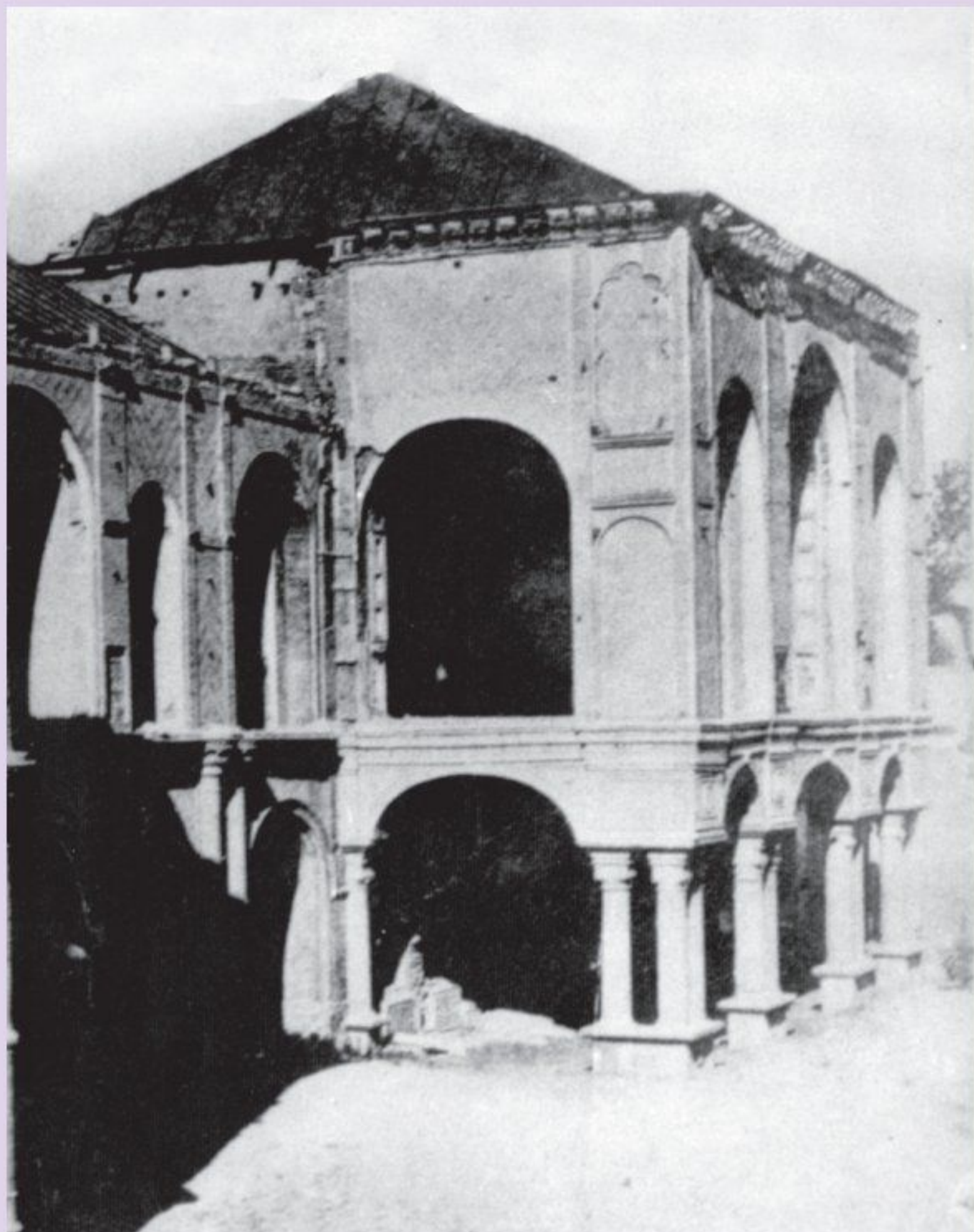
ساختمان مجلس شورای ملی پس از به توپ بستن توسط لیاخوف در ایام مشروطیت