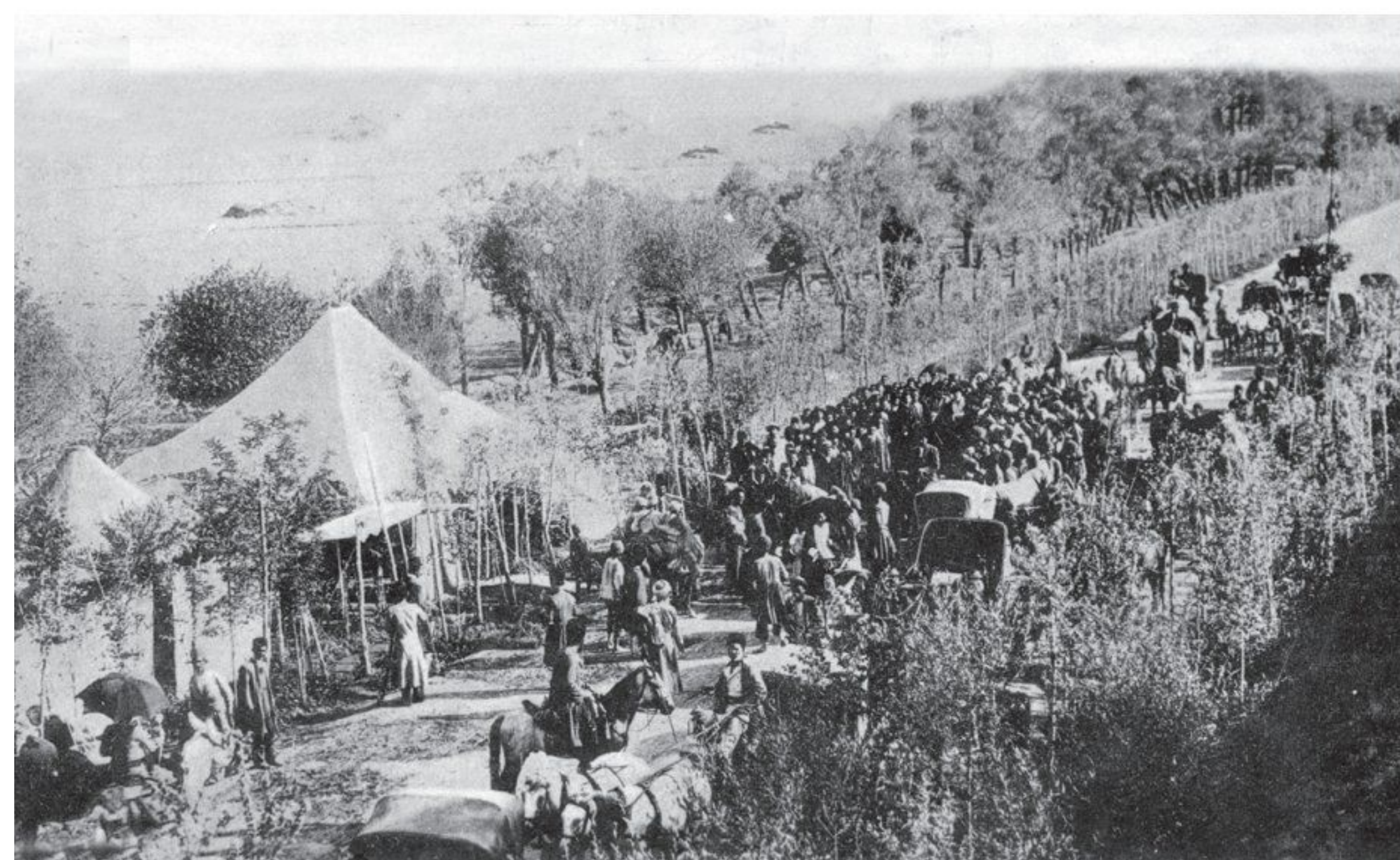
بازگشت علما از مهاجرت کبری

2) مظفردین شاه تسلیم خواسته های مردم شد. او عین الدوله را عزل کرد و فرمان تشکیل مجلس شورای ملی را در ۱۴ مرداد ۱۲۸۵ صادر کرد. هفت روز بعد، علما، با استقبال پرشکوه مردم، از قم بازگشتند. شهر چراغانی و جشن شادی به پا شد و در ۲۸ مرداد، اولین دوره مجلس شورای ملی با حضور نمایندگان