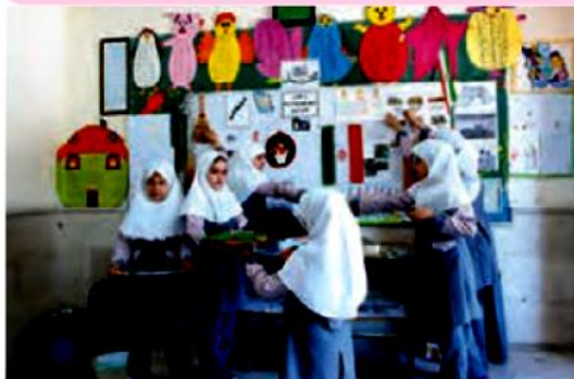
تشکیل نمایشگاه دست‌سازه‌های دانش‌آموزی