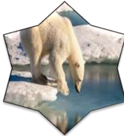
زیست بوم توندرا