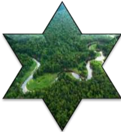
زیست بوم جنگل های بارانی استوایی

هر زیست بوم از چند بوم سازگان (اکوسیستم) تشکیل شده است.