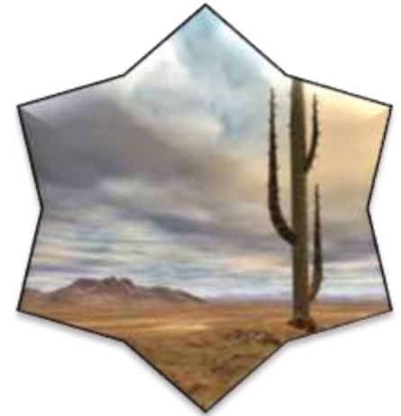
زیست بوم بیابان