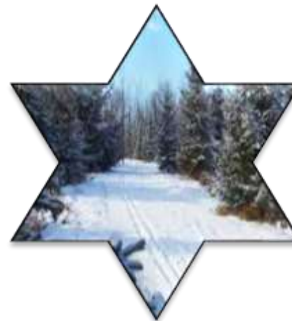
زیست بوم تایگا