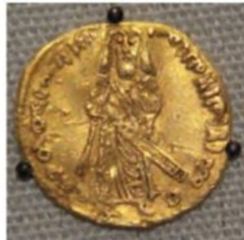
نمونه ای از سکه های دوره امویان