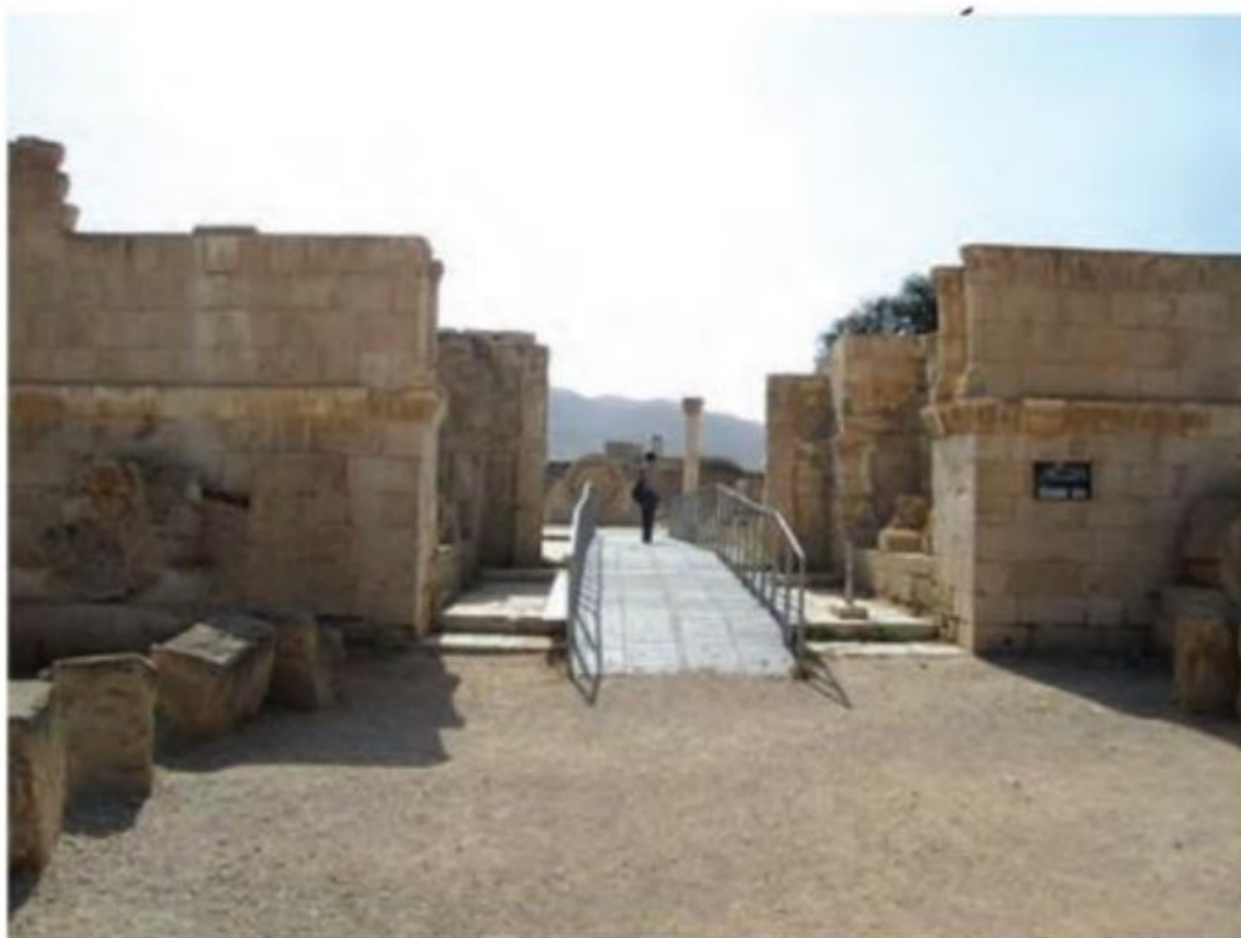
بقایای کاخ هشام بن عبدالملک در اریحا

امویان برخلاف روش اسلام که هر نوع تبعیض نژادی را ناروا می‌داند، به پیوندهای قبیله‌ای و قومی اهمیت زیادی می‌دادند. به همین دلیل در مرتبه اول، خاندان و قبیله خود یعنی بنی‌امیه و