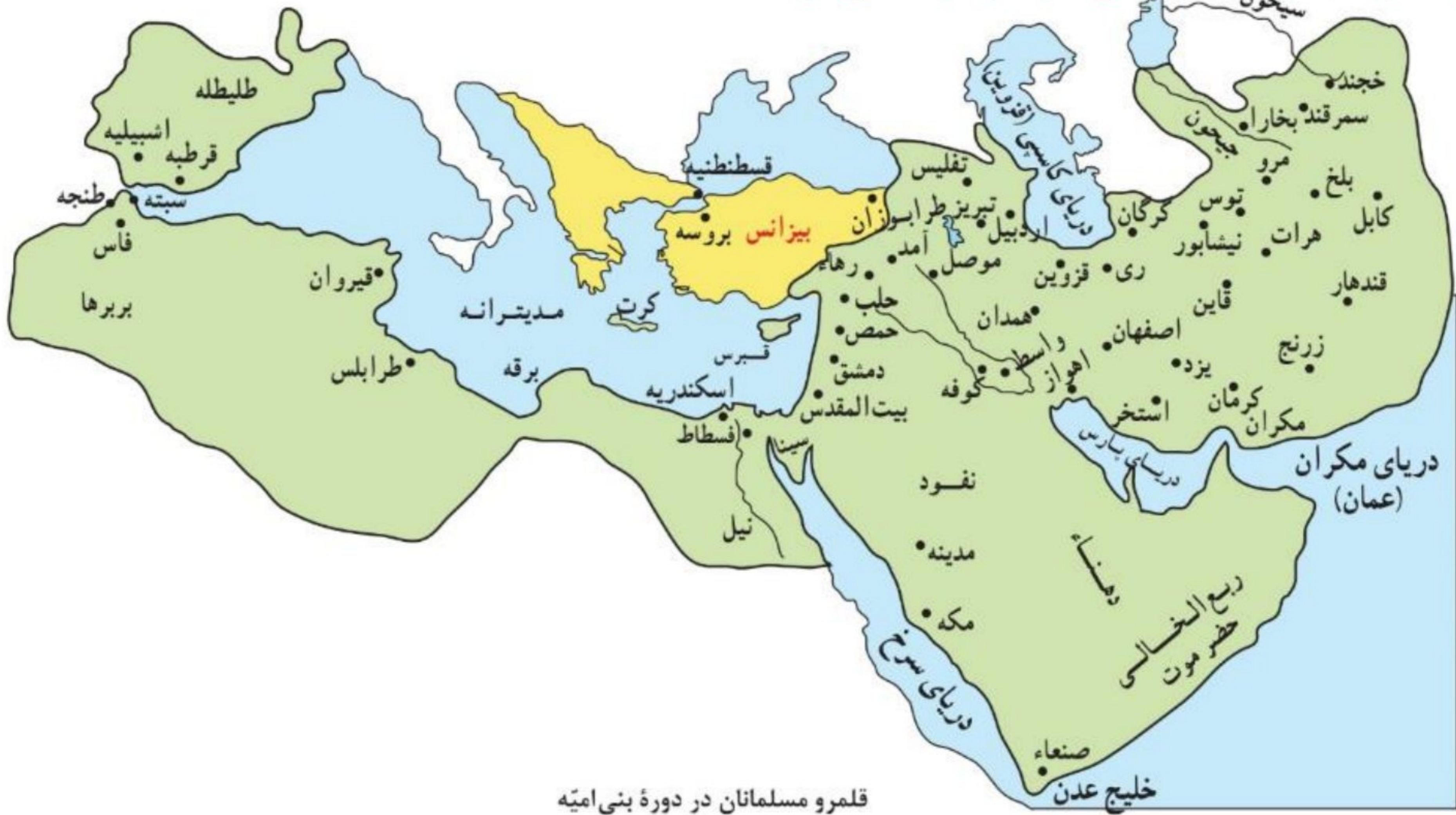
قلمرو مسلمانان در دوره بنی امیه

۱۶- امویان معمولاً چگونه با مخالفان خود برخورد می کردند؟