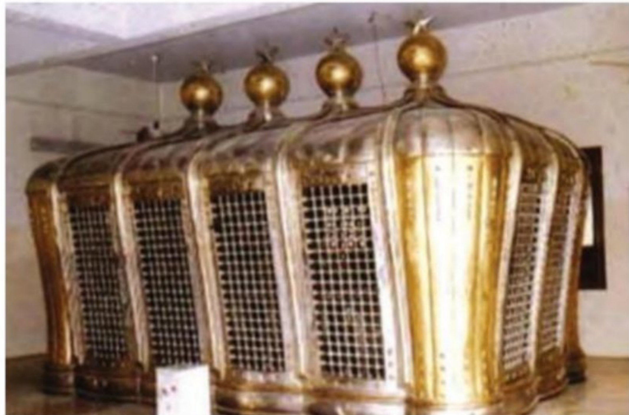
بارگاه و ضریح امامان شیعه در قبرستان بقیع پیش از تخریب