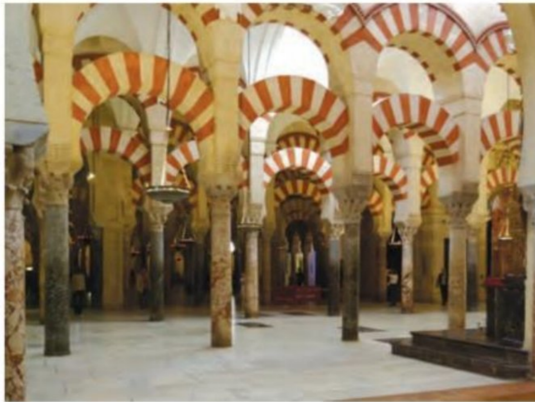
مسجد جامع قرطبه

شکوفایی معماری: اندلس اسلامی در عرصه معماری نیز بسیار شکوفا بود. مسجد جامع قرطبه و کاخ الحمراء غرناطه، دو شاهکار معماری جهان اسلام به شمار می‌روند که سالانه