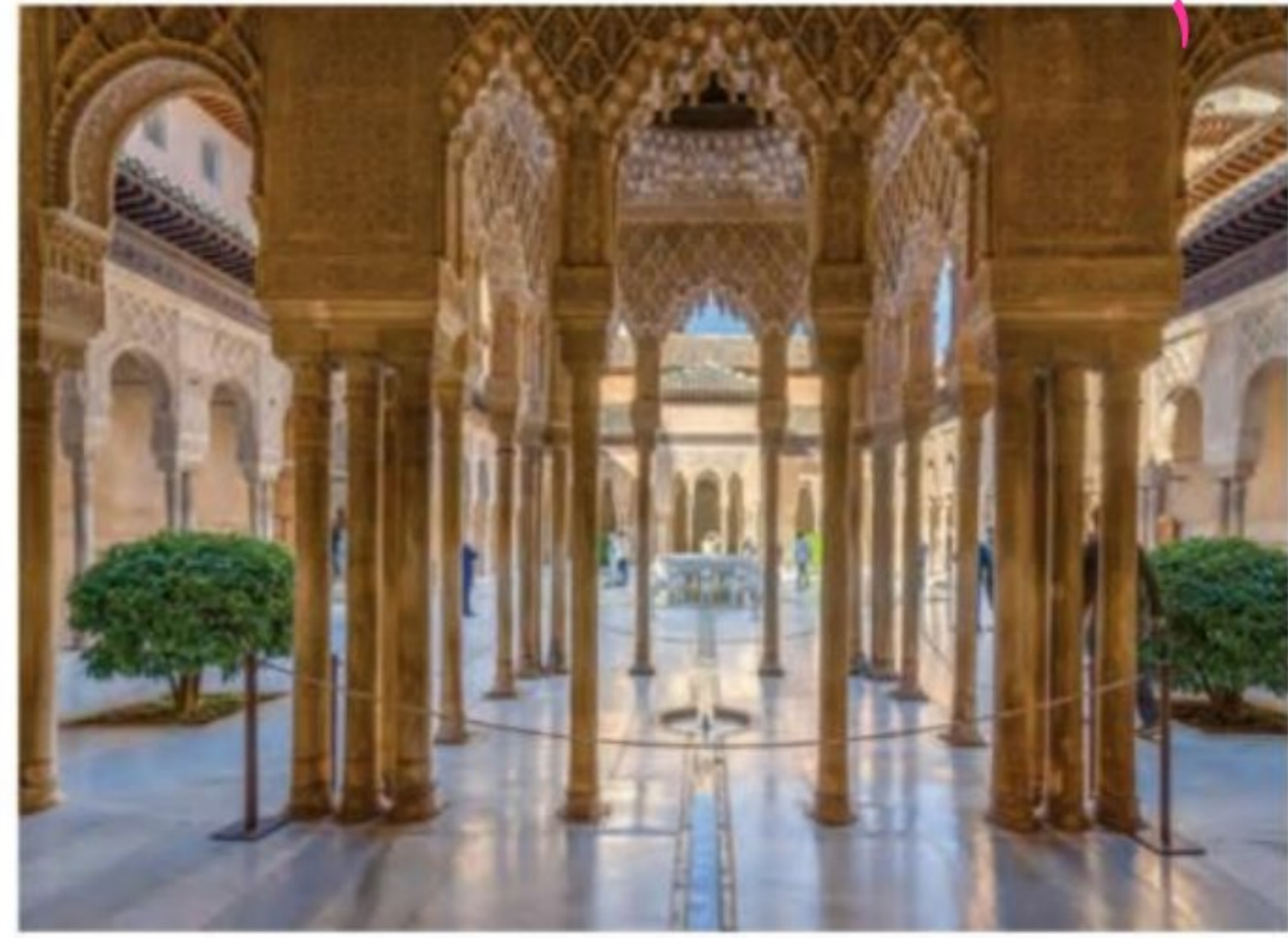
کاخ الحمراء - غرناطه