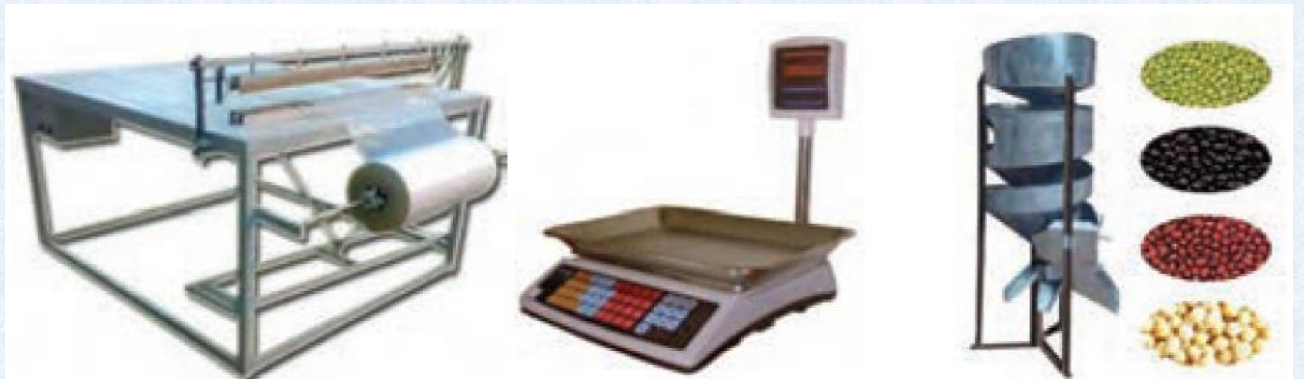
شکل ۲۰-۱۱- دستگاه بسته بندی اولیه حبوبات

بسته بندی اولیه: سلفون های پر شده را با دستگاه دوخت حرارتی در بندی کنید