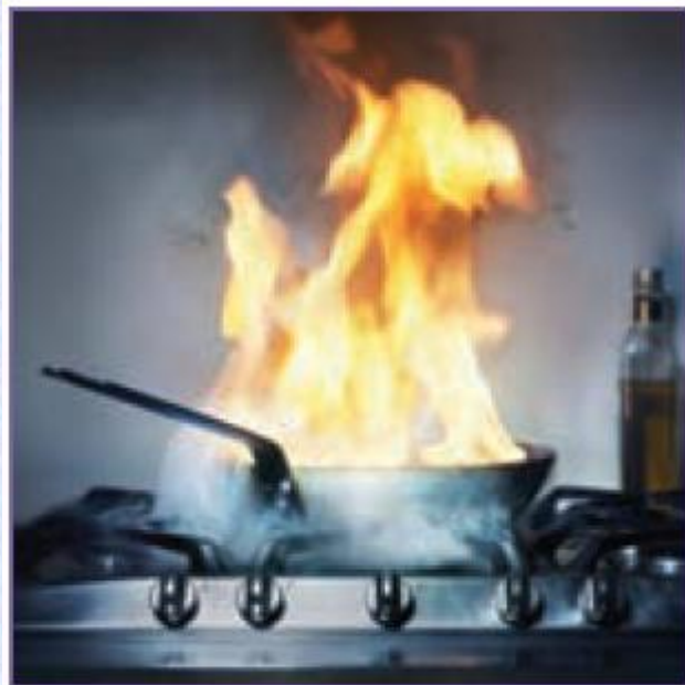
شکل ۱۲-۱۱- آتش گرفتن محتویات ماهیتابه

- خیلی از آتش سوزی ها هنگام سرخ کردن خوراکی ها اتفاق می افتد. اگر محتویات ماهی تابه روی اجاق آتش گرفت، نباید روی آن آب بریزید. نخست اجاق را خاموش کنید، سپس در آن را ببندید یا پارچه یا حوله ای خیس روی ماهی تابه بیندازید و صبر کنید تا سرد و خاموش شود.