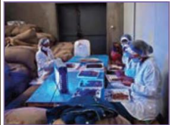
شکل ۱۷-۱۱- پاک کردن حبوبات