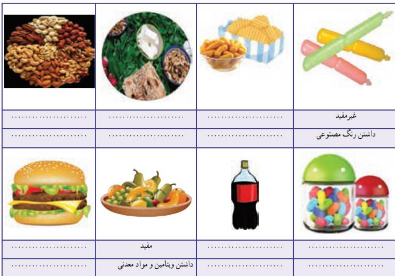
جدول ۱۱-۴ - برخی میان وعده های مفید و غیر مفید

با هم اندیشی در گروه خود، میان وعده های مفید و غیر مفید و دلیل گزینش خود را در جدول ۱۱-۴ بنویسید.