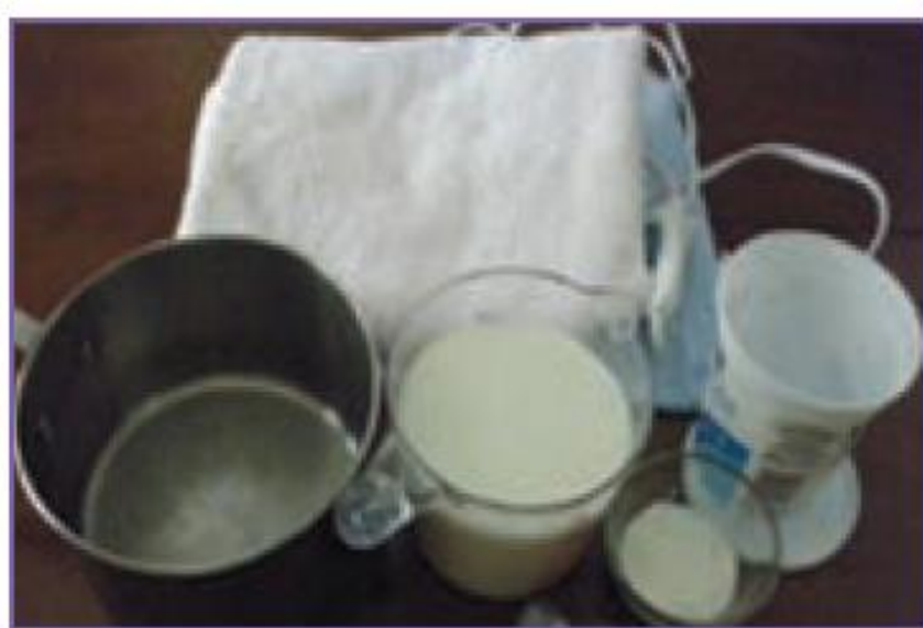
شکل ۵-۱۱- مواد و وسایل مورد نیاز برای فرآوری ماست