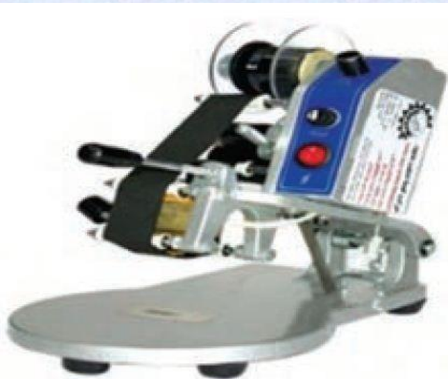
شکل ۲۱ - ۱۱ دستگاه برچسب زنی حبوبات

- تبلیغ فرآورده های تولیدشده برای فروش بیشتر