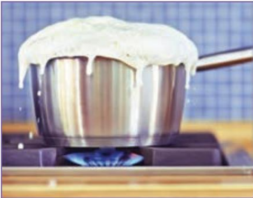
شکل ۳-۱۱- سررفتن شیر

۱ - سر رفتن شیر و مانند آن روی اجاق گاز می تواند باعث خاموش شدن شعله گردد. اگر شعله خاموش شد، باید شیر گاز را ببندید و پس از خارج نمودن گاز منتشر شده، اجاق گاز را برای روشن کردن آماده کنید.