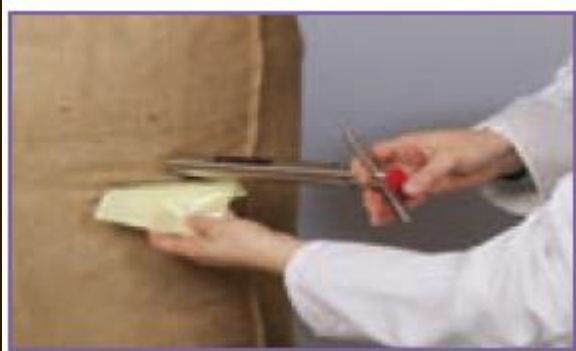
شکل ۱۶-۱۱- نمونه برداری حبوبات

پاک کردن: برای پاک کردن حبوبات از یک میز استیل استفاده کنید. در این مرحله باید مواد خارجی مانند سنگ، پوشال، دانه های آفت زده، آسیب دیده و نارس را جدا کنید