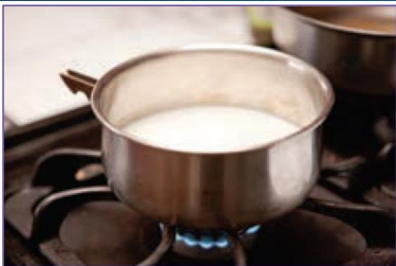
شکل ۱-۱۱ - گرم کردن شیر

۲ - ظرف شیر را روی شعله اجاق گاز بگذارید.