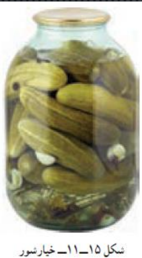
شکل ۱۵-۱۱- خیارشور

خیار و مخلوط افزودنی ها را که آماده کرده اید، لایه به لایه در ظرف بریزید. متناسب با اندازه خیار آماده شده به اندازه ای که ظروف تهیه خیارشور را پر کند آب را بجوشانید و برای هر لیتر آب جوشیده ۷۰ گرم نمک و ۸۰ سی سی ۵ قاشق سوپ خوری سرکه بریزید اگر نمک زیاد بریزید خیارشور چروکیده و توخالی می شود. اگر مقدار نمک کم باشد خیارشور لیز و نرم می شود.