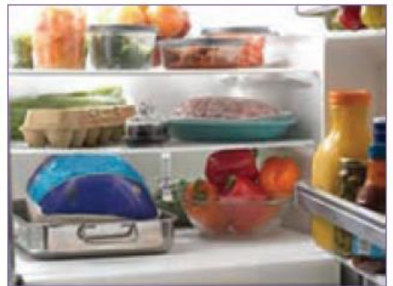
شکل ۸-۱۱- ترتیب جیدمان مواد خوراکی داخل یخچال