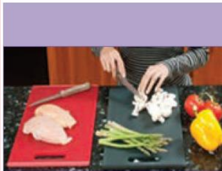
شکل ۹-۱۱- تخته های برش

- از گرم کردن زیاد روغن مایع و آب کردن روغن جامد در قوطی فلزی به علت ایجاد ترکیب های سمی خودداری کنید.