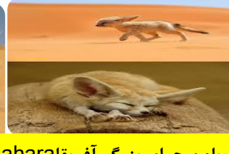
روبه صحرای بزرگ آفریقا saharal