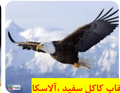
عقاب کاکل سفید، آلاسکا