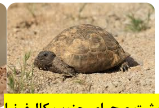
لاک پشت صحرای جنوب کالیفرنیا