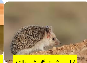
خار پشت گوش بلند