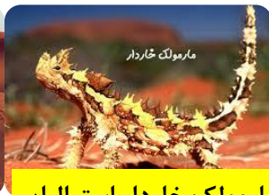
مارمولک خاردار استرالیایی