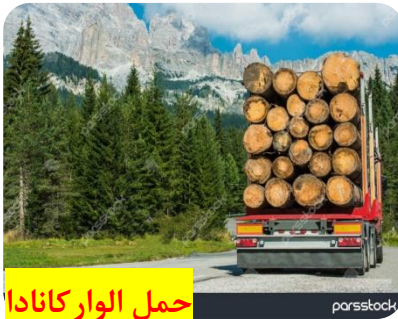
صفوی حمل الوار کانادا