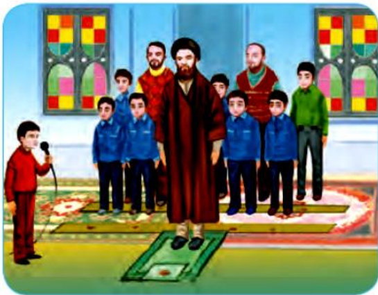
خواندن نماز جماعت