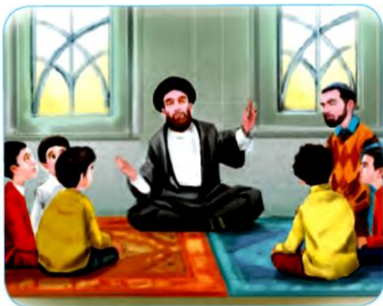
برگزاری کلاس‌های آموزشی، فرهنگی و همچنین