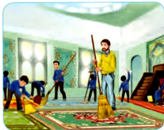
غبارروبی و پاکیزه کردن مسجد

گام به گام هدیه‌ها صفحه به صفحه طراح: سمیرا ابوالقاسمی