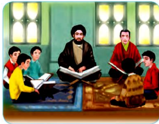
خواندن قرآن و برگزاری کلاس‌های قرآنی