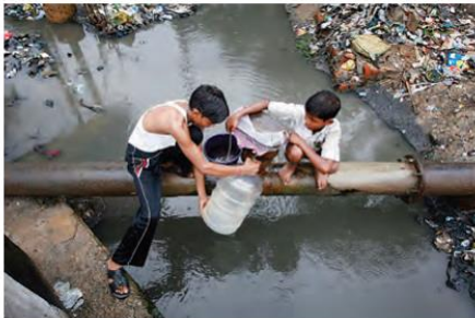
گردآوری آب آشامیدنی غیربهداشتی، هند