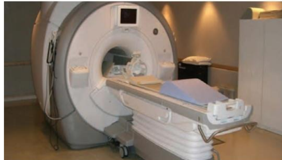
پزشکی هسته‌ای در ایران