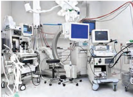
ایران، تولیدکننده تجهیزات پزشکی پیشرفته