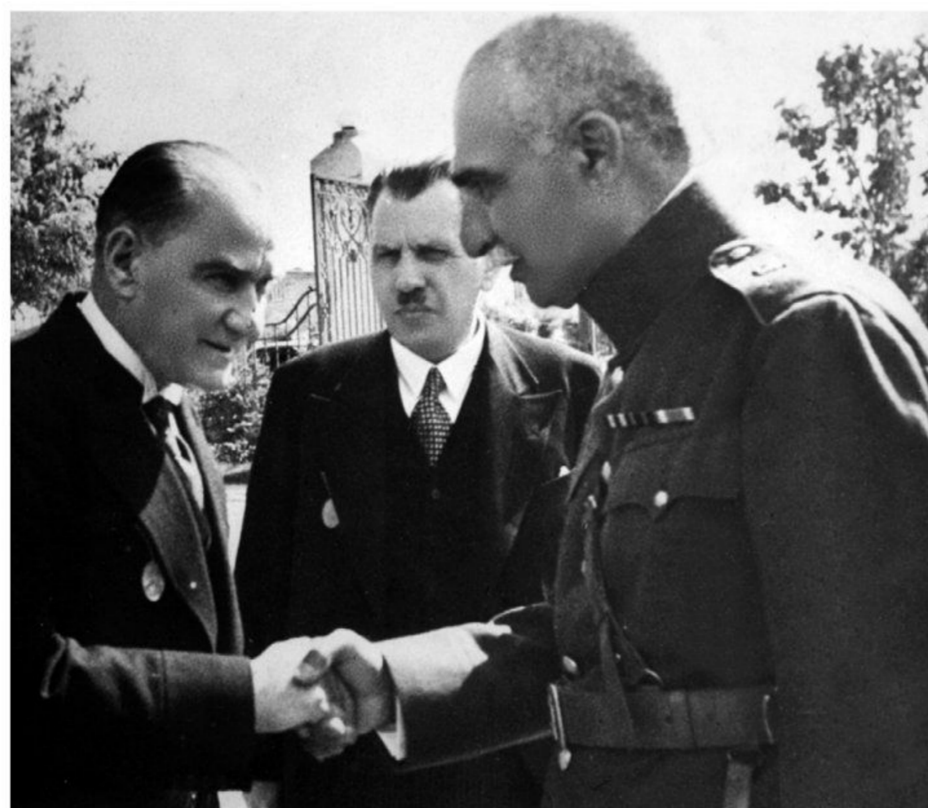
رضاشاه و آتاتورک

2) رضاشاه که تصور می کرد مهم ترین راه پیشرفت و توسعه کشور تقلید از غرب و اشاعه فرهنگ غربی است، پس از مسافرت به ترکیه و آشنایی با آتاتورک، رئیس جمهور آن کشور، به تقلید از او به مبارزه با همه سنت های اسلامی پرداخت. او در این راه حتی مأموران مخصوص در کوچه و خیابان شهر گماشت که وظیفه داشتند به زور چادر را از سر زنان بکشند) 3) رضاشاه برای تضعیف روحانیت، دستور داد که روحانیون نیز لباس های مخصوص خود را کنار بگذارند. به دستور وی، دفترخانه های شرعی تعطیل شدند و دخالت روحانیون در مسائل اجتماعی اکیداً ممنوع اعلام شد. عزاداری سیدالشهدا غدغن شد و از انجام پذیرفتن بسیاری از آداب مذهبی به شدت جلوگیری