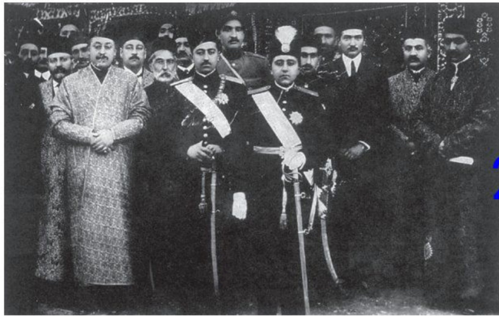
احمد شاه قاجار به همراه رضاخان و رجال درباری

2) آیرون سایید، فرمانده نظامی نیروهای انگلیسی در ایران، به جست‌وجو در