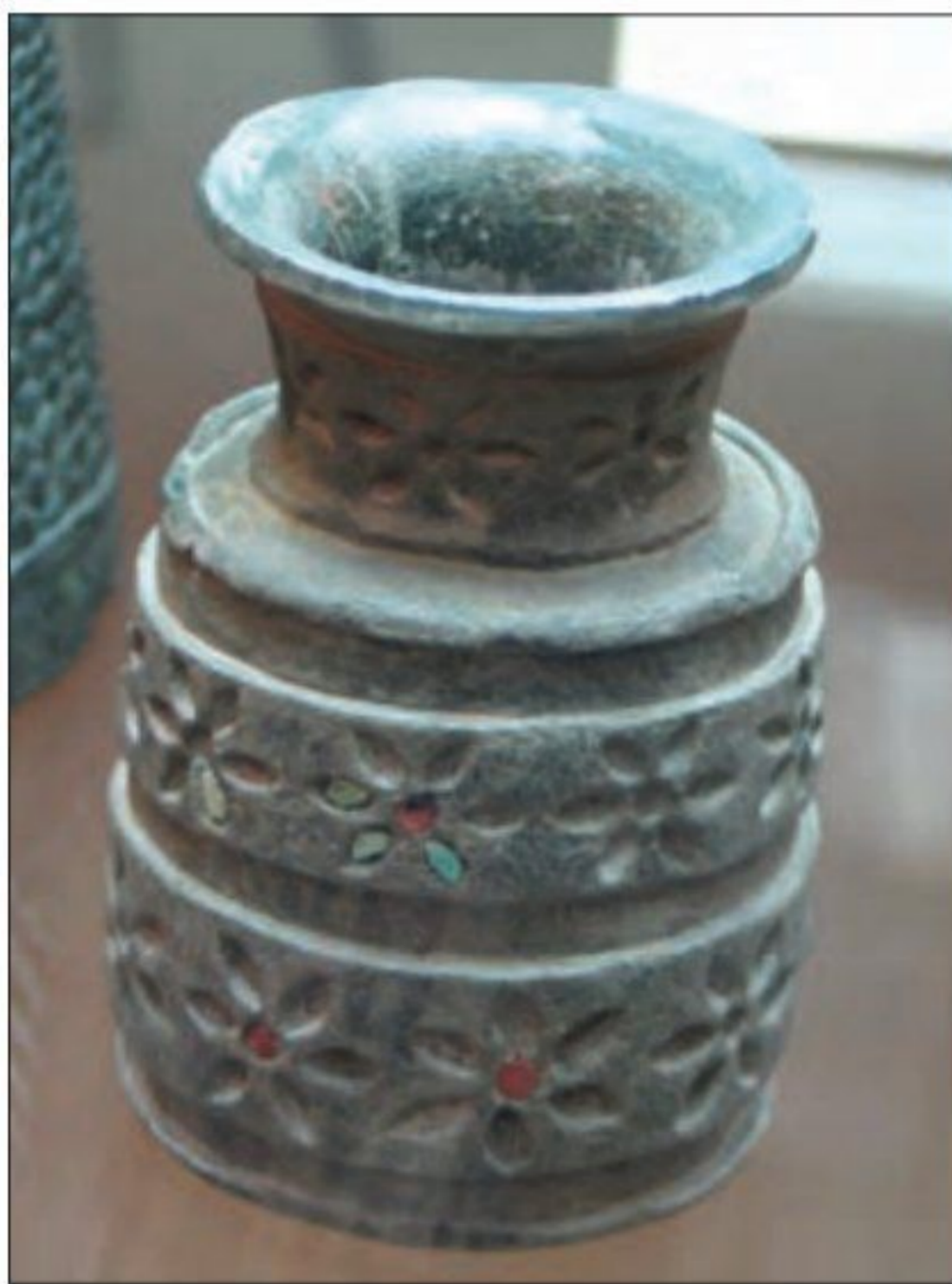
○ ظرفی از جنس سنگ صابونی - جیرفت

۲- فلزکاری: یافته های باستان شناسی نشان می دهد که مردم ایران از حدود ۸ هزار سال پیش با چکش کاری بر روی رگه های طبیعی مس، برخی ابزارها، به ویژه زیورآلات مسی، می ساختند (1) بقایای کوره های ذوب و قالب گیری مس در برخی سکونتگاه های کهن مانند شهداد، ایل ابلیس و تپه یحیی در استان کرمان و تپه زاغه در قزوین (بیانگر آن است که در حدود ۵ تا ۷ هزار سال پیش ساکنان این سکونتگاه ها به فنون ذوب و قالب گیری مس دست یافته بودند. آثاری از معدن بزرگ مس در شهرستان بافت در استان کرمان نیز کشف شده است. یکی دیگر از دستاوردهای صنعت فلزکاری ساکنان فلات ایران، ساخت اشیا و ابزارهای مفرغی از طریق آمیختن مس با ماده قلع بود. (2) مفرغ های لرستان، بهترین نمونه از صنعت و هنر فلزکاری ایران به شمار می روند (2) 3) اشیا و ظروف سنگ صابونی، از دیگر مصنوعات است که توسط مردم برخی سکونتگاه های کهن به ویژه جیرفت