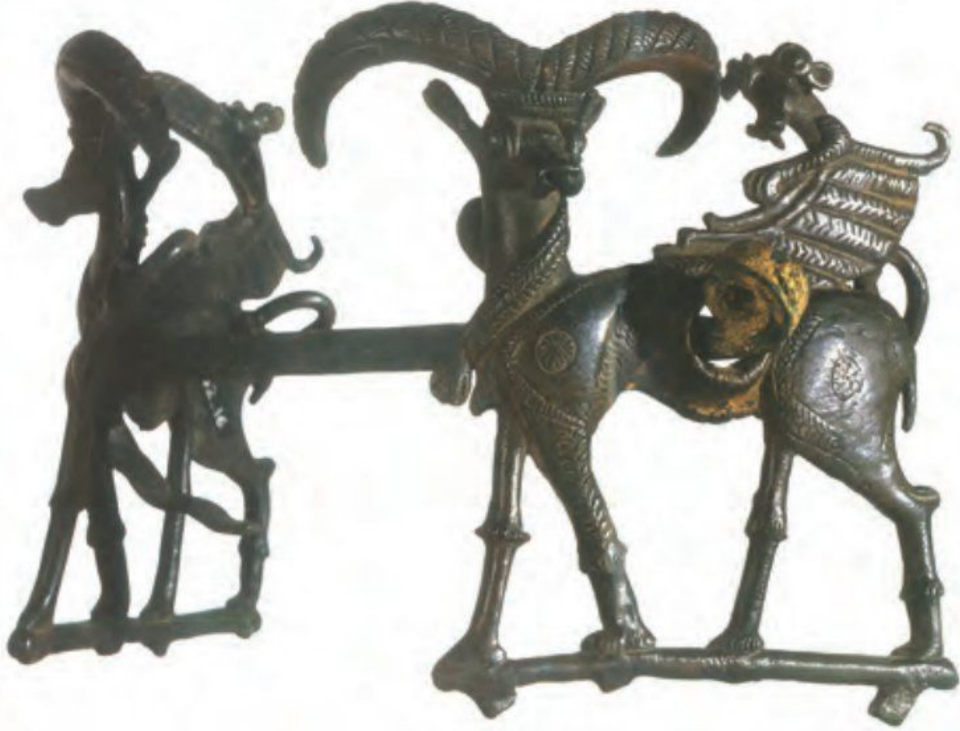
○ دهنه اسب، نمونه ای از ابزارهای مفرغی (برنزی) لرستان - ۷۰۰ ق.م

و تپه یحیی در استان کرمان، با مهارت و ظرافت تمام ساخته می شد. شواهد باستان شناسی نشان می دهد که سکونتگاه های مذکور از مراکز مهم تولید و صدور سنگ صابون به مناطق دور و نزدیک بوده اند (3)