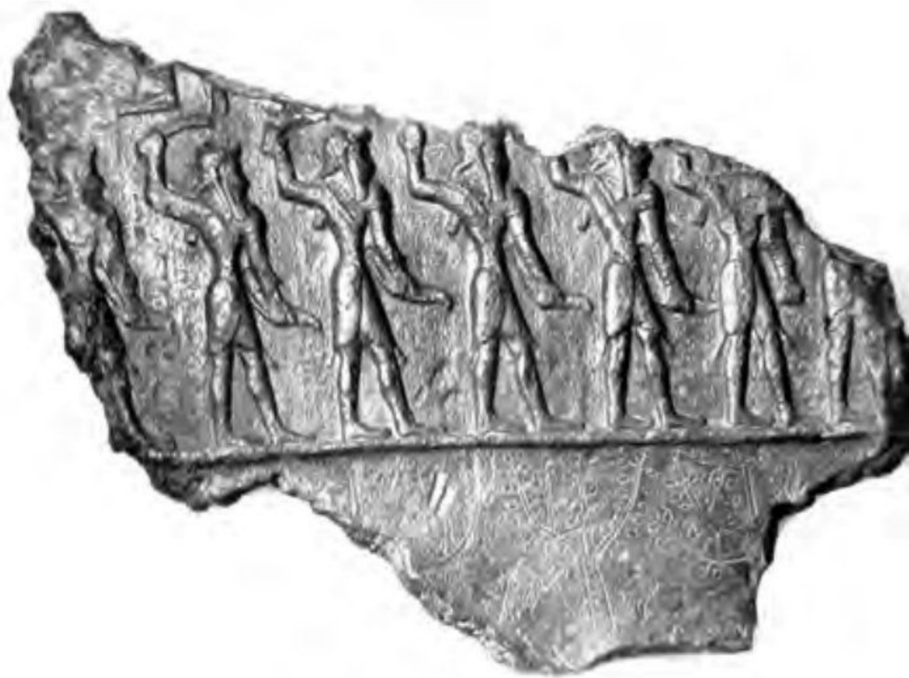
○ نقش برجسته برنزی هفت جنگجو - شوش، قرن ۱۲ ق.م.