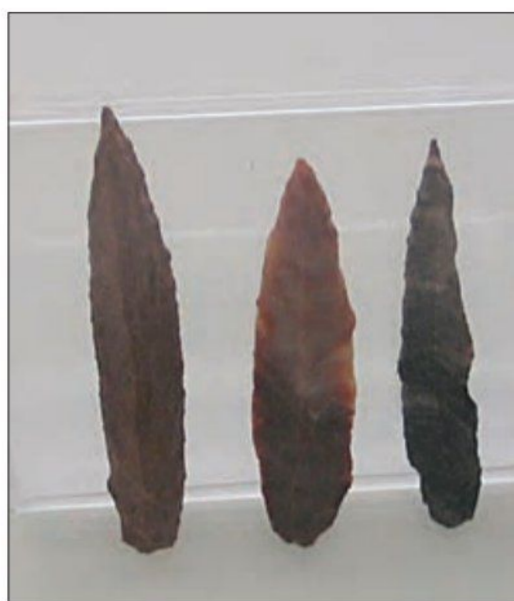
تیغه سنگی، غار یافته - لرستان، پارینه سنگی جدید (۴۰ تا ۱۸۰۰۰ سال پیش)