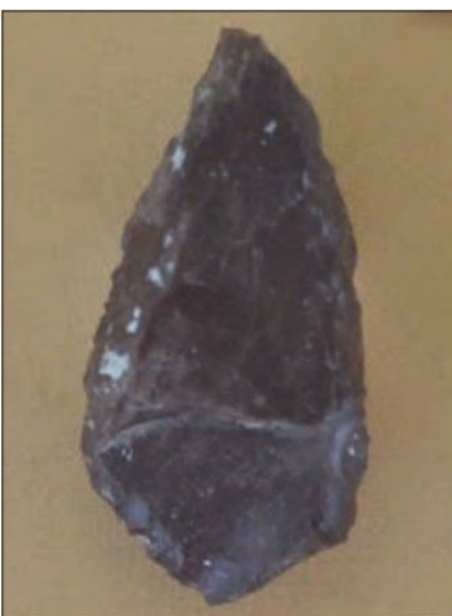
سنگ خراشنده - غار دو آشکفت کرمانشاه - پارینه سنگی میانی (۲۰۰ تا ۴۰۰۰۰ سال پیش)