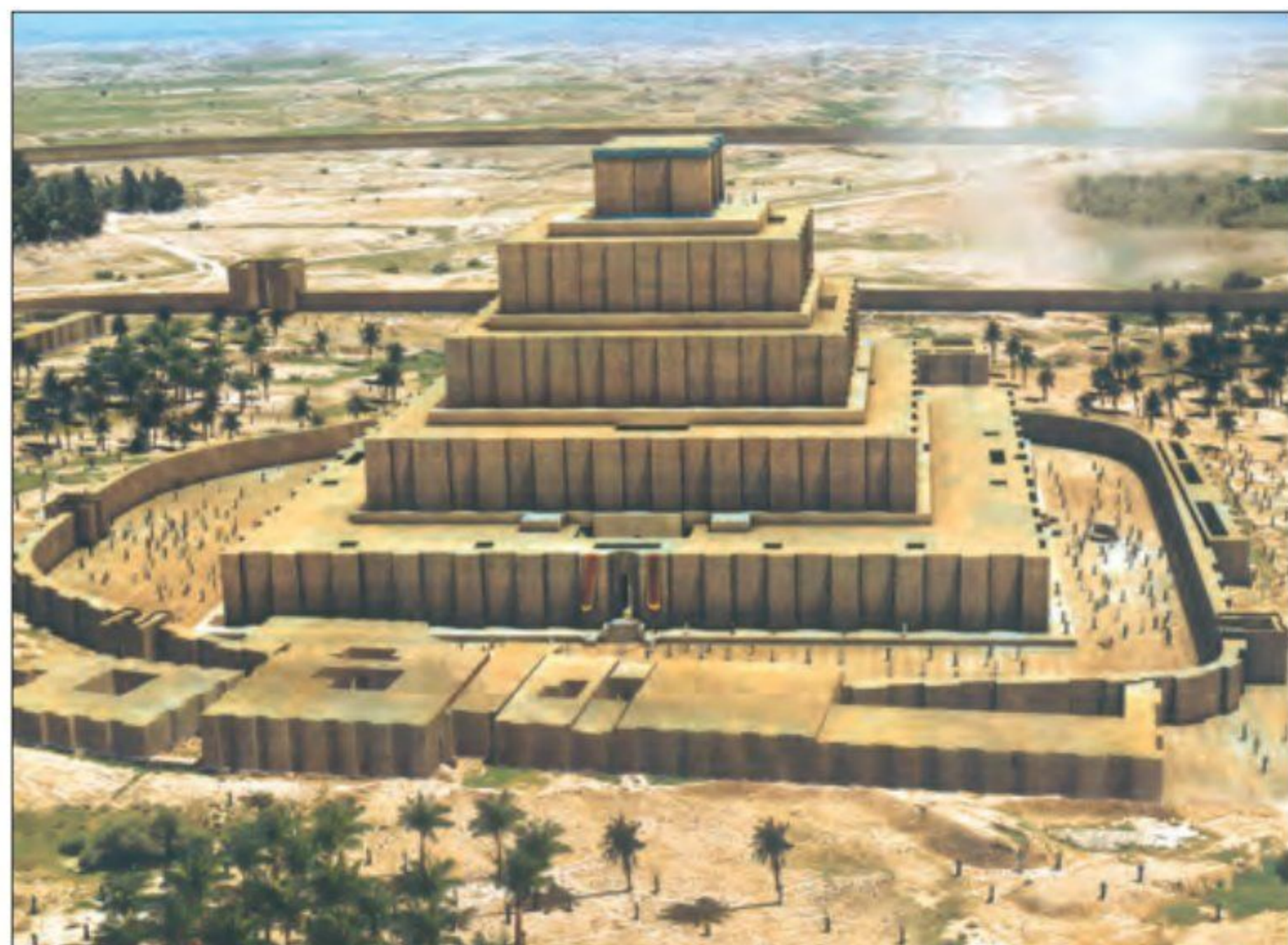
طرحی از معبد چغازنبیل - شوش

1) در دوره ایلام، معماری پیشرفت چشمگیری کرد و استفاده از آجر در ساختن بناها رایج شد. معبد چغازنبیل در نزدیکی شهر شوش، شاهکار معماری آن دوره به‌شمار می‌رود. این معبد با استفاده از خشت خام در چند طبقه بنا شده است و روکشی از آجر نوشته‌ها و آجرهای لعابدار دارد. 1