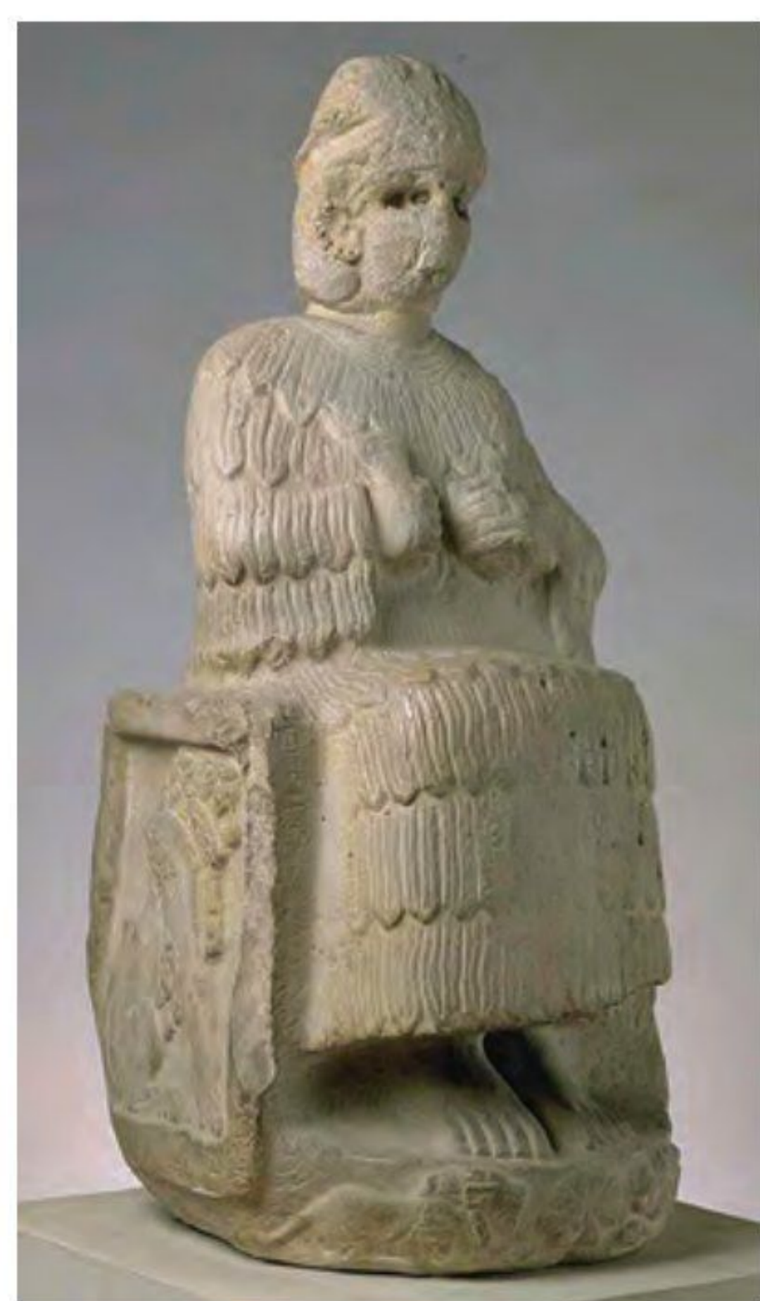
پیکره الهه ناروندی؛ در اسناد حقوقی و قضایی ایلام، سندها و تعهدات با سوگند به این الهه ضمانت می‌شد.

دین و اعتقادات ایلامیان به خدایان متعددی اعتقاد داشتند و از آنان برای پیشرفت کار خود کمک می‌خواستند. به عقیده مردمان ایلام قدیم، خدایان دارای نیرویی ماوراءطبیعی بودند که آنان را بر هر کاری توانا می‌ساخت. از جمله محبوب‌ترین خدایان ایلامی، اینشوشیناک به‌معنی خدای شهر شوش بود. معبد چغازنبیل، ستایشگاه این خدا محسوب می‌شد. الهه‌های مادر نیز بسیار مقدس بودند و مقام رفیعی در سلسله مراتب خدایان ایلامی داشتند. ایلامیان این الهه‌ها را به‌عنوان مادر خدایان می‌پرستیدند و برای آنان معابدی ساخته بودند. در کاوش‌های باستانی شوش، پیکره‌های گلی فراوانی، که به «الهه» معروف‌اند، کشف شده که دلالت بر احترام و تقدس آنها نزد مردم دارد. از دیگر مراکز تمدنی ایران نیز پیکره‌هایی از الهه‌های مادر به‌دست آمده که نشان می‌دهد عقیده به این الهه‌ها در ایران فراگیر بوده است. در ایلام، کاهنان آداب و تشریفات دینی را زیر نظر کاهن بزرگ به‌جا می‌آوردند. 3