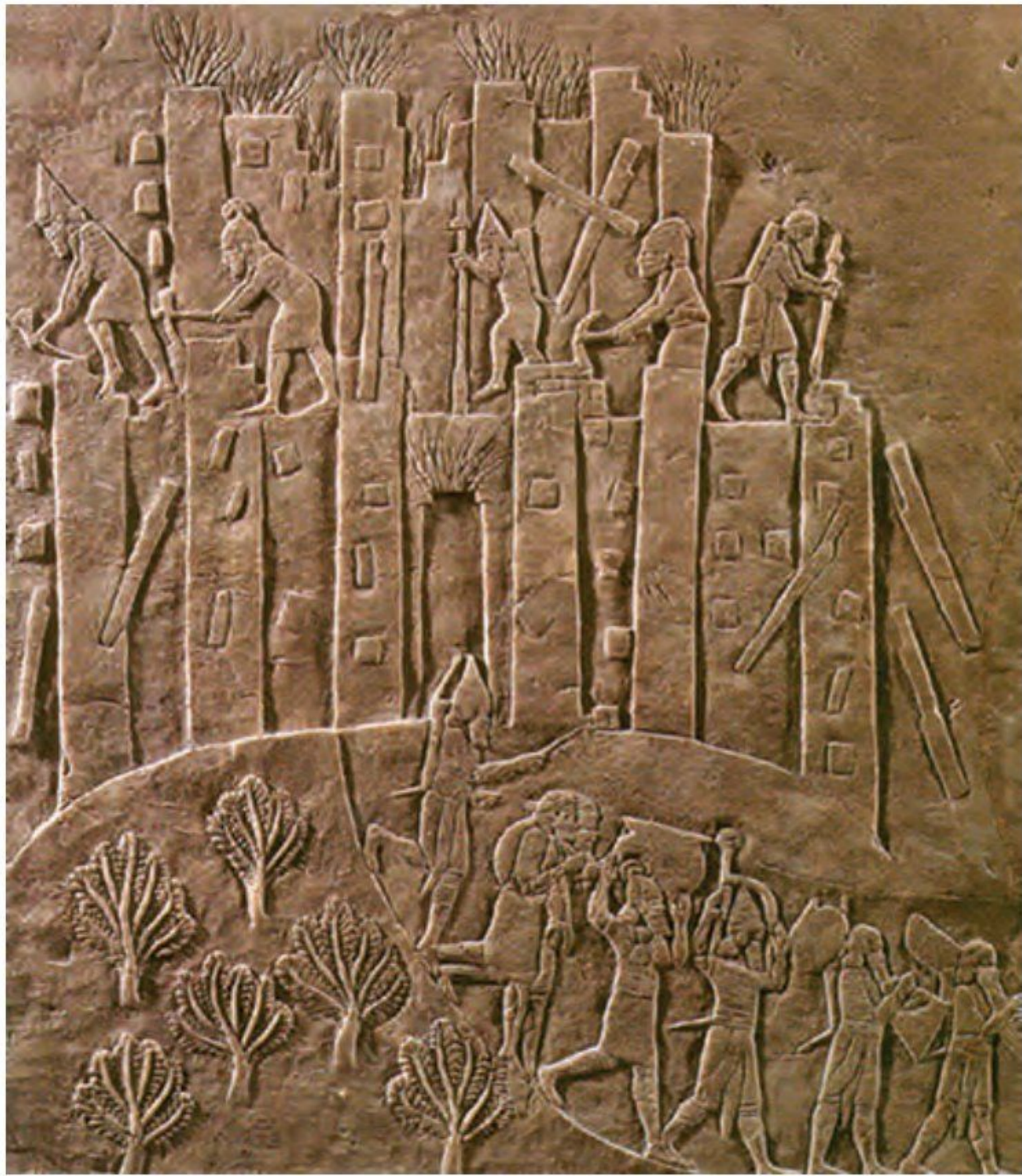
○ سنگ نگاره ویرانی شوش به دست آشوربانیپال، فرمانروای آشور