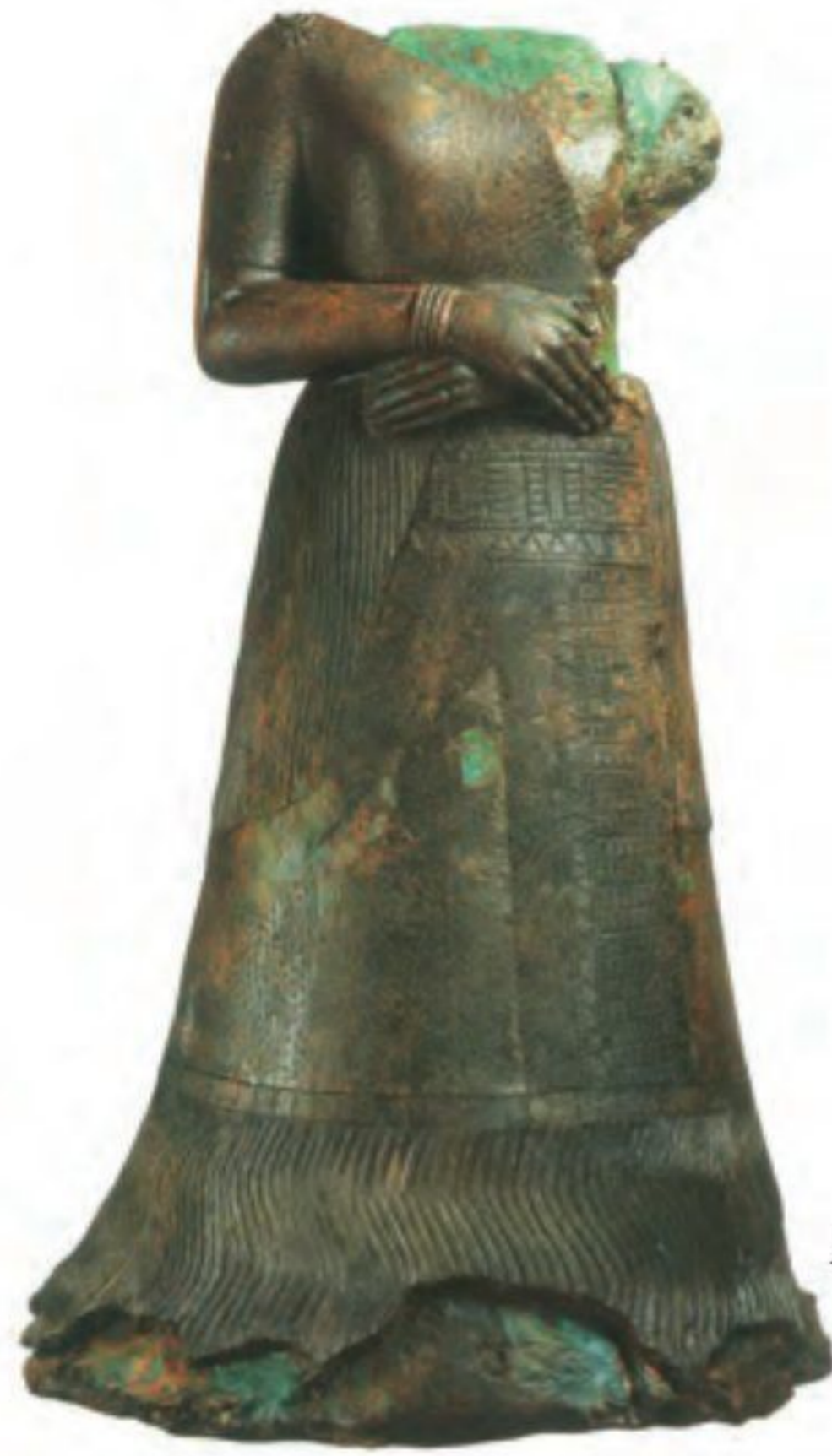
○ پیکره ملکه نَپیرآسو، همسر اوننش گل (پادشاه ایلام)