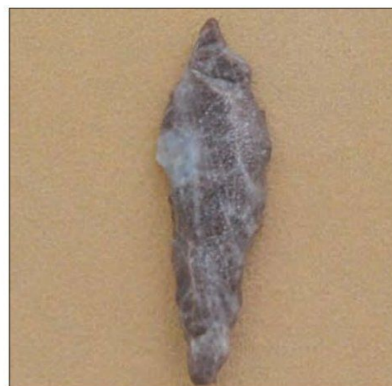
سنگ نوک تیز، هلیلان - ایلام، فراپارینه سنگی (۱۸ تا ۱۲۰۰۰ سال پیش)