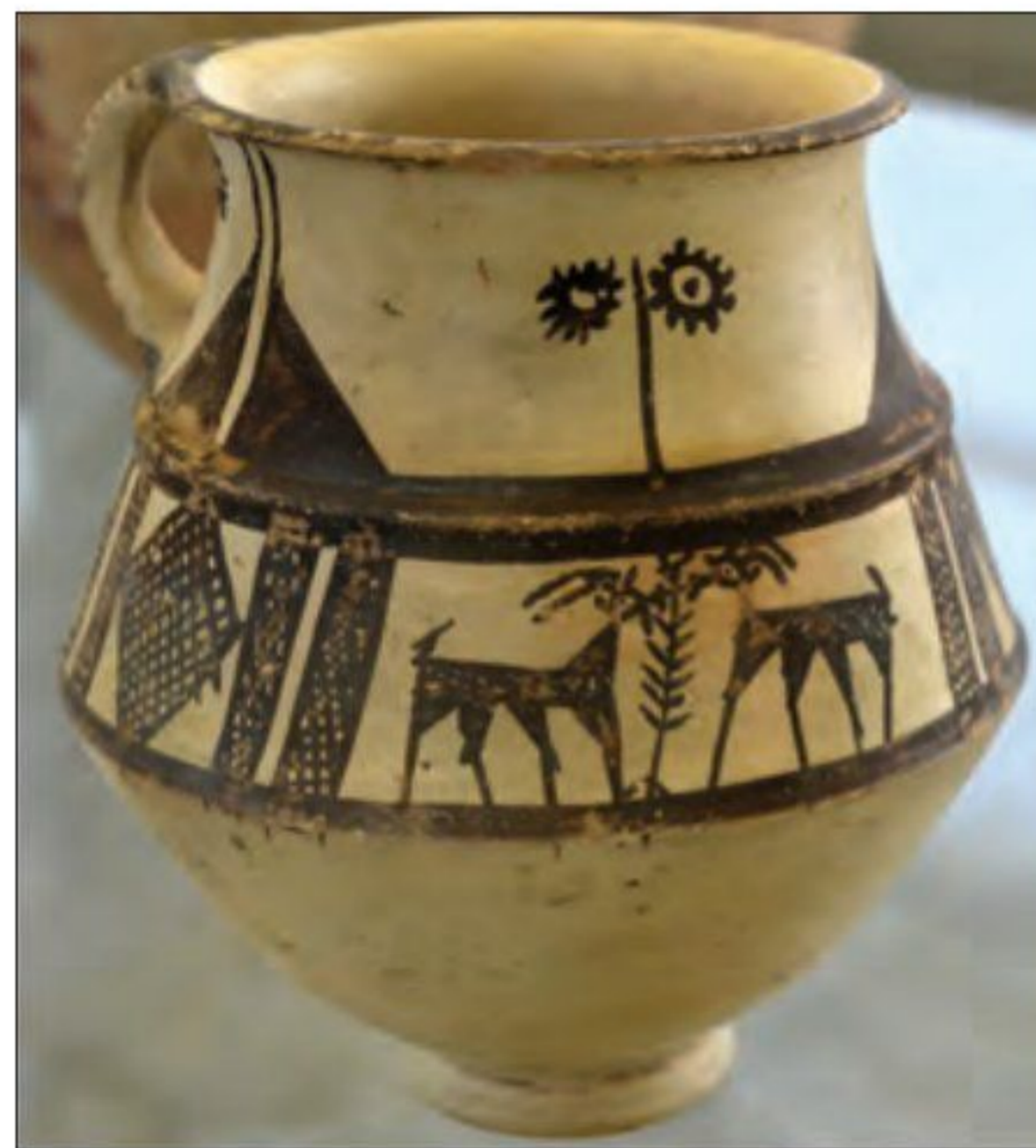
○ ظرف سفالی، ۳۰۰۰ ق.م - تپه گیان نهاوند

با روی آوردن گروه‌هایی از مردم به کشاورزی و دامپروری، به تدریج سکونتگاه‌ها و روستاهایی نخست در غرب و سپس در دیگر مناطق ایران پدید آمد. به نقشه صفحه ۷۱ بنگرید.