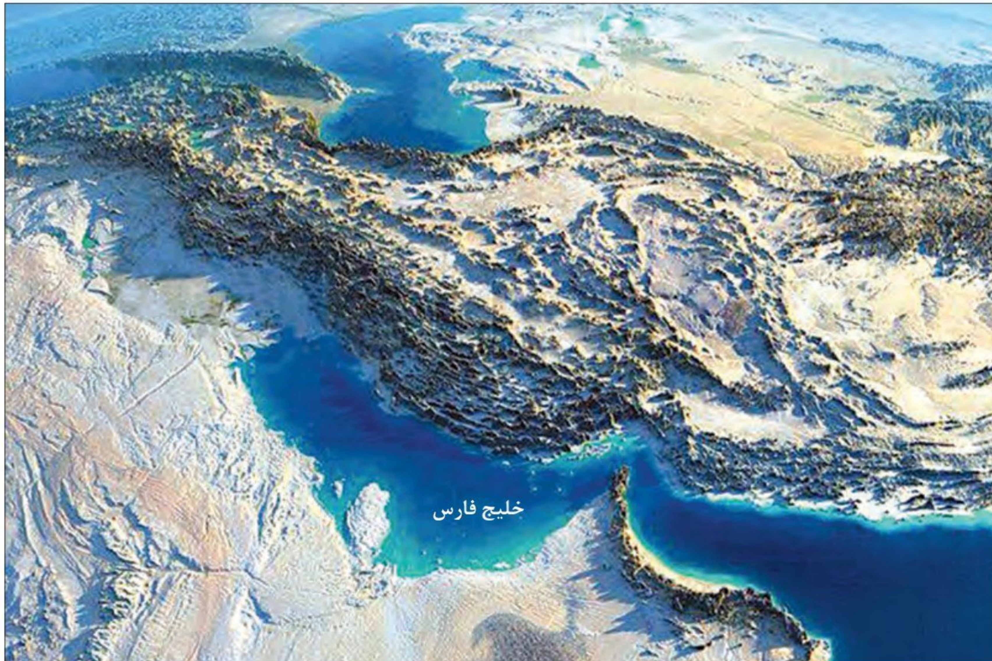
نقشه ماهواره ای فلات ایران

3. چرا نواحی کوهپایه ای و سرزمینهای پست ایران محیط مناسبی برای زندگی انسان و برپایی سکونتگاه های روستایی و شهری بودند؟