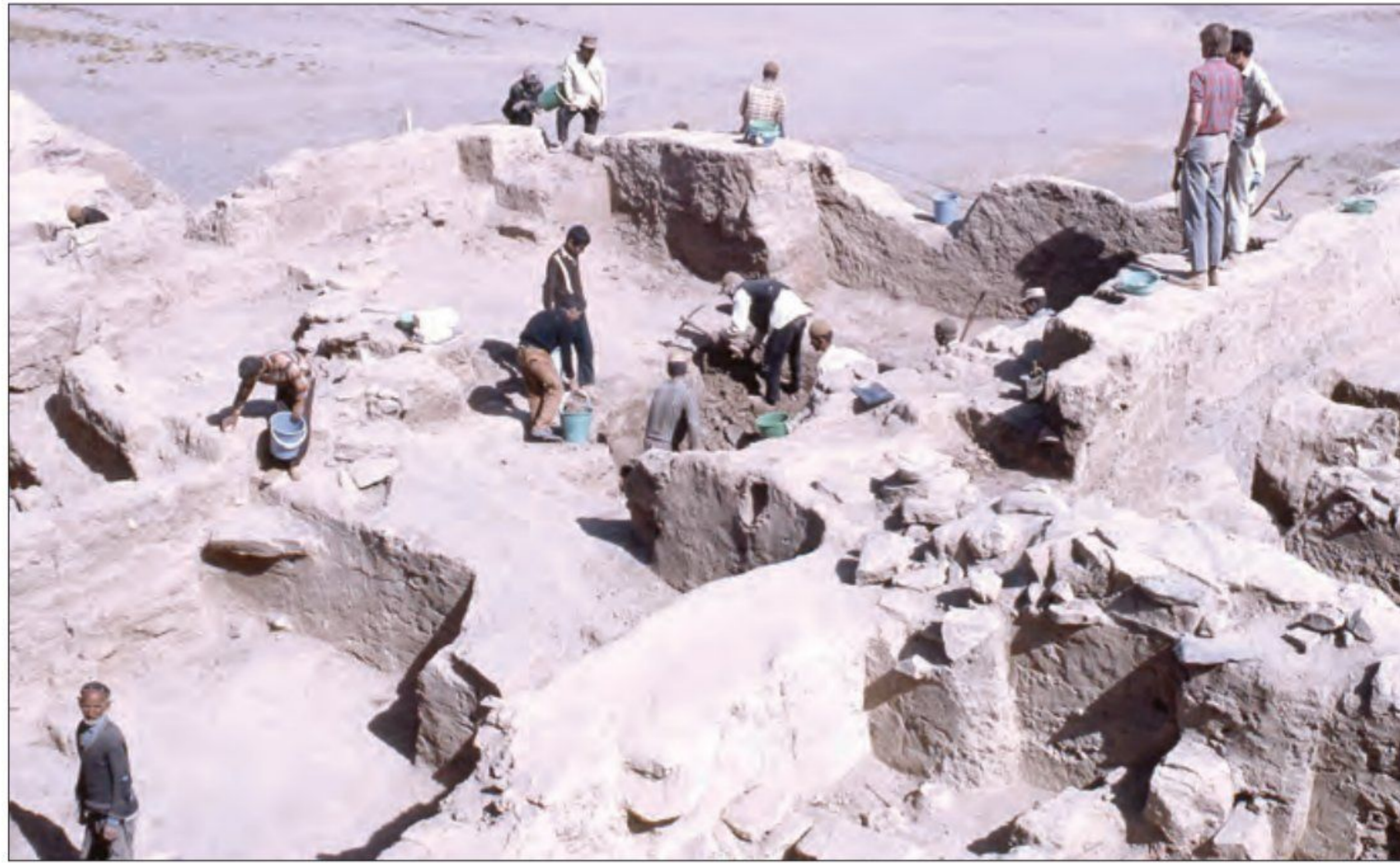
○ حفاری در محوطه باستانی گودین تپه - کنگاور

پدید آمدن شهرها: در حدود ۵ هزار سال پیش، نخستین شهرها در فلات ایران به وجود آمد. (شوش و چغامیش در خوزستان؛ شهداد و جیرفت در کرمان؛ شهر سوخته در سیستان و سیلک در کاشان از جمله این شهرها بود) 1