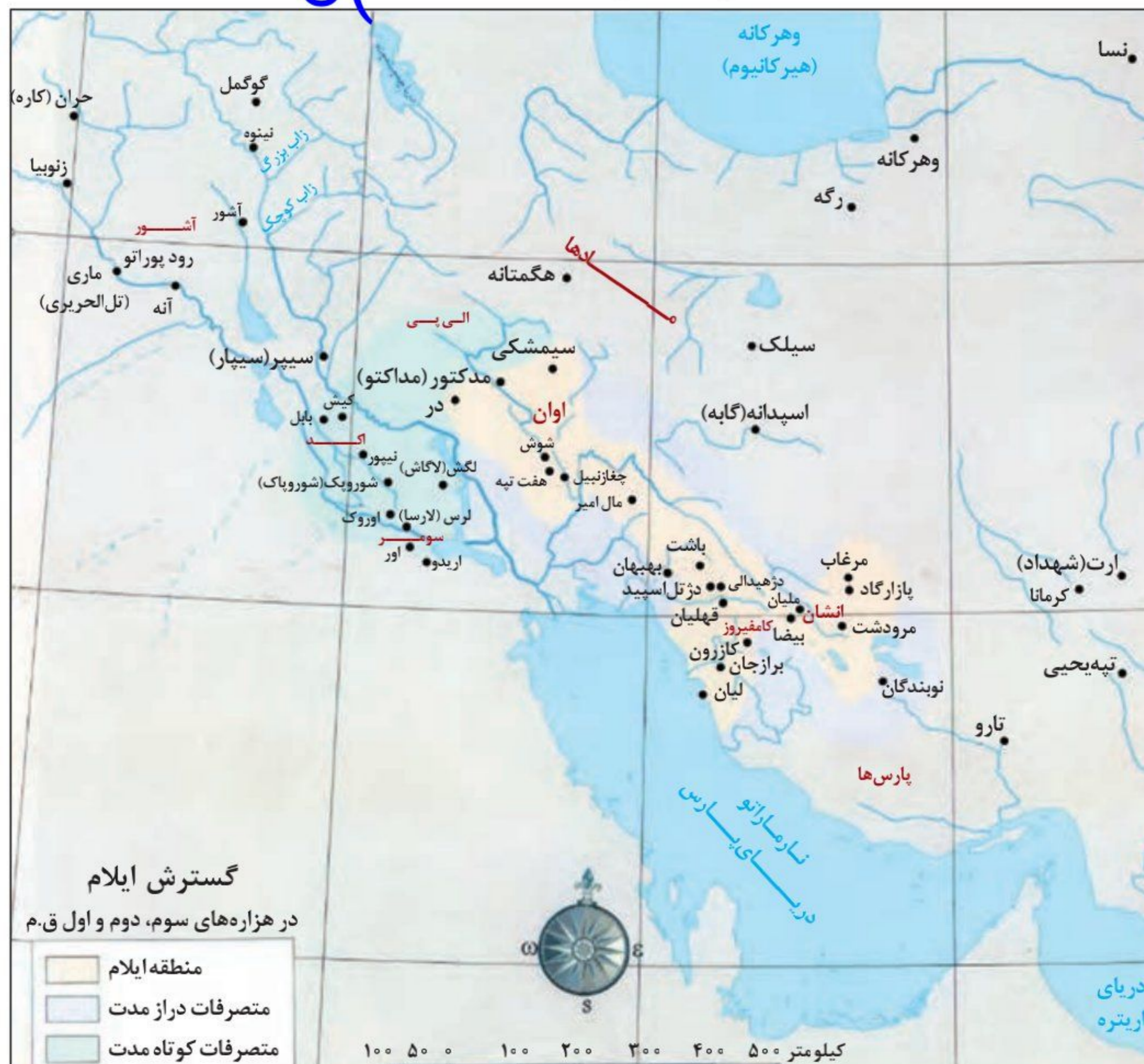
نقشه قلمرو حکومت ایلام

دوران تاریخی فلات ایران با تاریخ ایلام، که اطلاعات مکتوبی درباره آن وجود دارد، آغاز می شود. سرزمین اصلی ایلامیان شامل جلگه خوزستان و مناطق کوهستانی زاگرس جنوبی و میانی بود. 1) آنجا که اقتصاد بین النهرین نیازمند منابع طبیعی