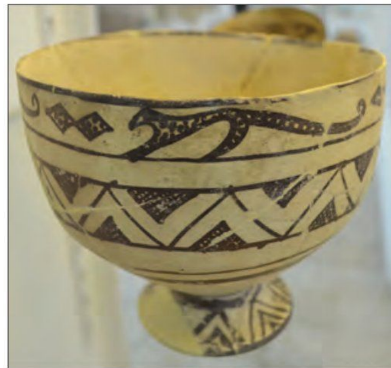
○ کاسه سفالی، ۴۰۰۰ ق.م - تپه حصار دامغان