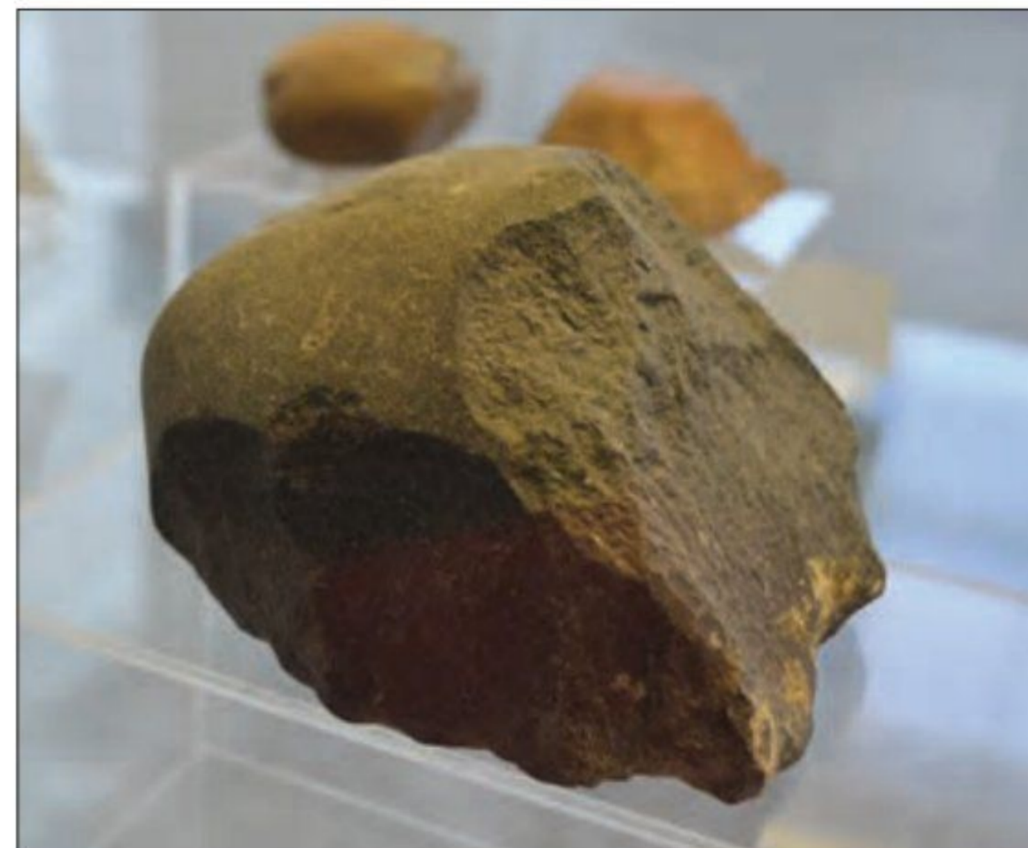
ابزار سنگی، پارینه سنگی قدیم - شیوه تو - مهاباد