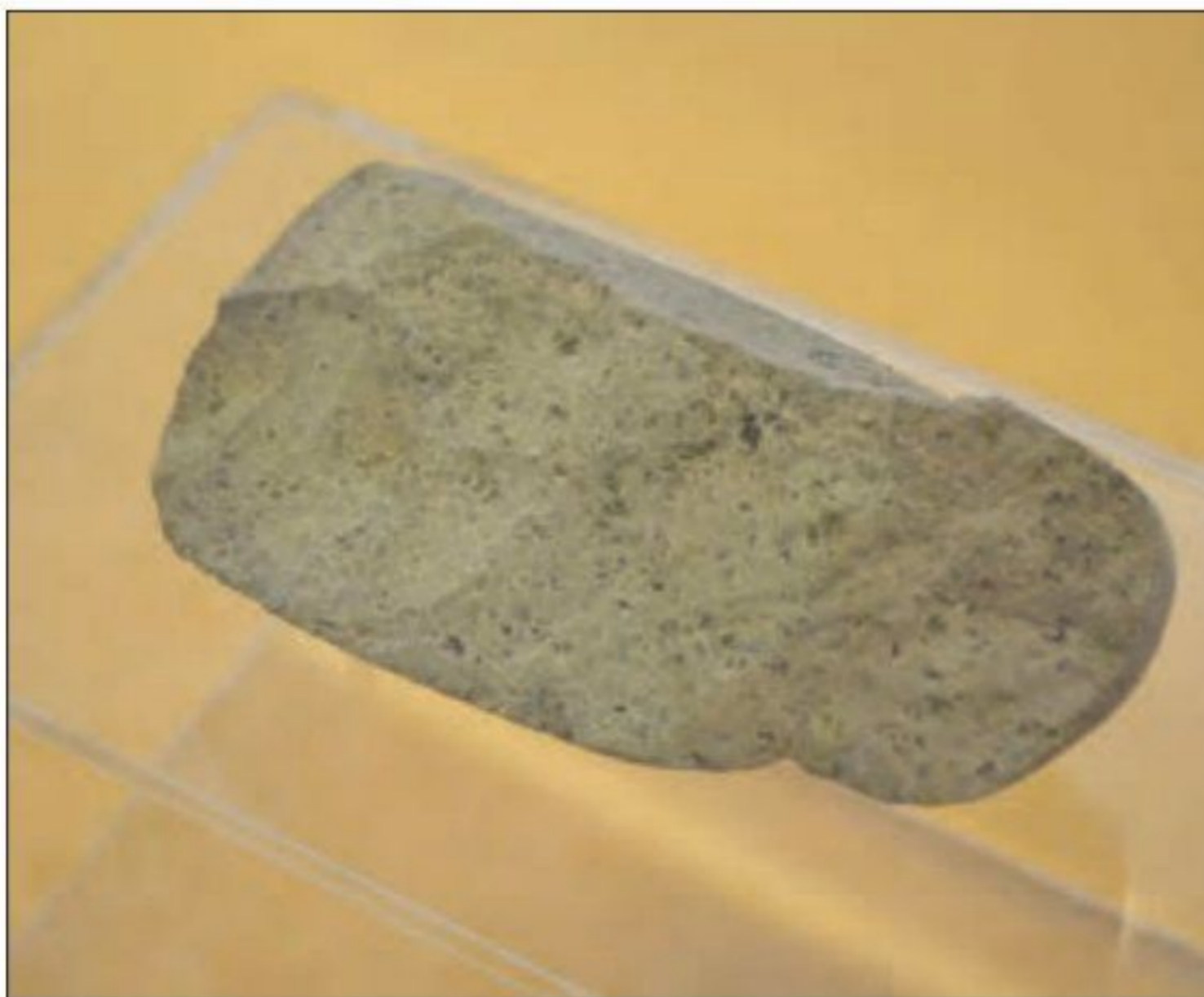
ابزار سنگی، پارینه سنگی قدیم - کشف‌رود - خراسان رضوی

ایران در دوران پیش از تاریخ الف - کهن‌ترین ساکنان فلات ایران 1 سابقه حضور انسان در فلات ایران به‌طور دقیق روشن نیست، اما بعضی پژوهشگران احتمال داده‌اند گروه‌هایی از جمعیت‌های انسانی از آفریقا، آسیای مرکزی، قفقاز و شبه‌قاره هند در دوران پارینه سنگی به سوی سرزمین ما مهاجرت کرده‌اند. 2 (کهن‌ترین نشانه و آثاری که از حضور انسان در ایران تاکنون کشف شده، مربوط به بستر کشف‌رود در نزدیکی مشهد در خراسان