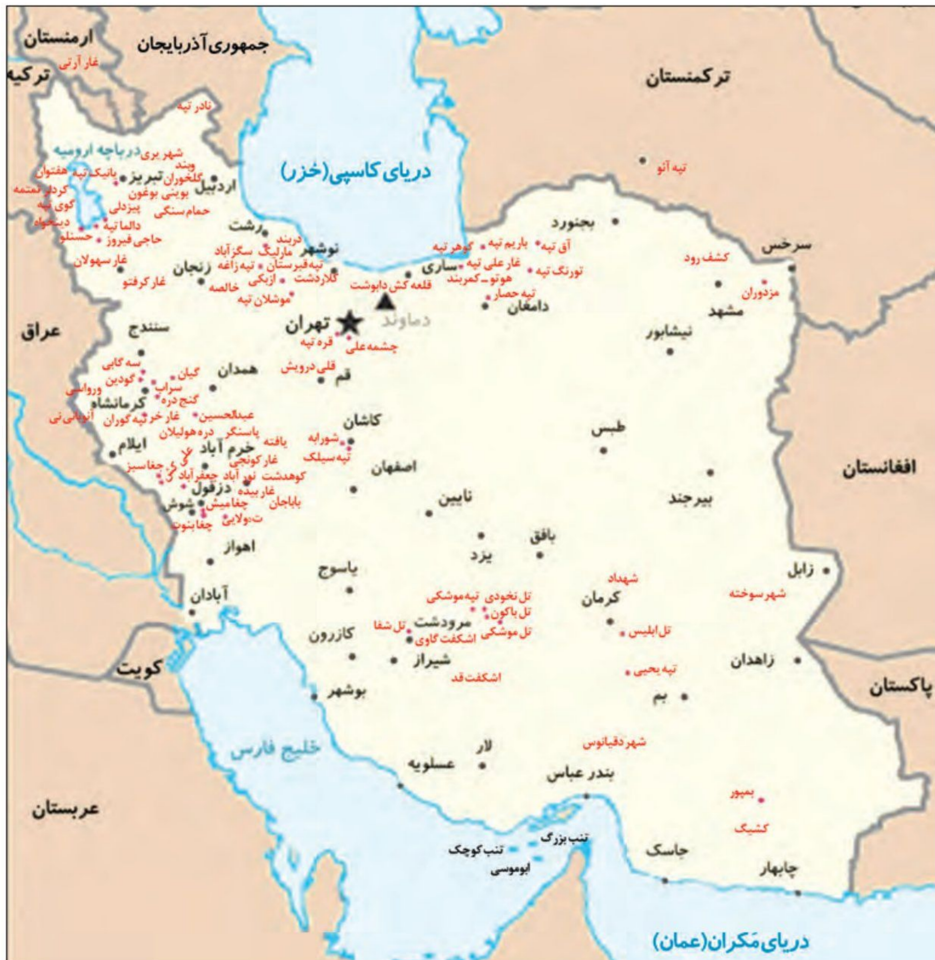
● سکونتگاه‌های پیش‌آریایی ایران

1) موقعیت جغرافیایی فلات ایران نیز تأثیر زیادی بر شکل‌گیری تاریخ و تمدن آن داشته است. ایران به واسطه موقعیت جغرافیایی خاص خود در جنوب غربی آسیا، پل ارتباطی شرق و غرب جهان باستان بود. در عصر باستان، مهم‌ترین راه‌های زمینی و دریایی که تمدن‌ها و کشورهای بزرگ را به یکدیگر متصل می‌کردند، از میهن ما می‌گذشتند و خلیج فارس و دریای مکران نقش مهمی در برقراری ارتباط تجاری، سیاسی، نظامی و فرهنگی میان سرزمین‌های دور و نزدیک جهان آن روز داشتند. این موقعیت جغرافیایی، ایران را به کانون مبادلات فرهنگی، هنری و اقتصادی در جهان باستان تبدیل کرده، موجب شده بود که ایرانیان نقش فعال و مؤثری در انتشار و گسترش فرهنگ و تمدن به عهده گیرند. از سوی دیگر، کشور ما به دلیل موقعیت جغرافیایی خود، در معرض مهاجرت‌ها و هجوم پیاپی اقوام مختلف و حکومت‌های خارجی قرار داشت. این مهاجرت‌ها و هجوم‌ها تأثیر فوق‌العاده‌ای بر جنبه‌های گوناگون زندگی سیاسی، اجتماعی، فکری، فرهنگی و اقتصادی ایرانیان در طول تاریخ گذاشته است.