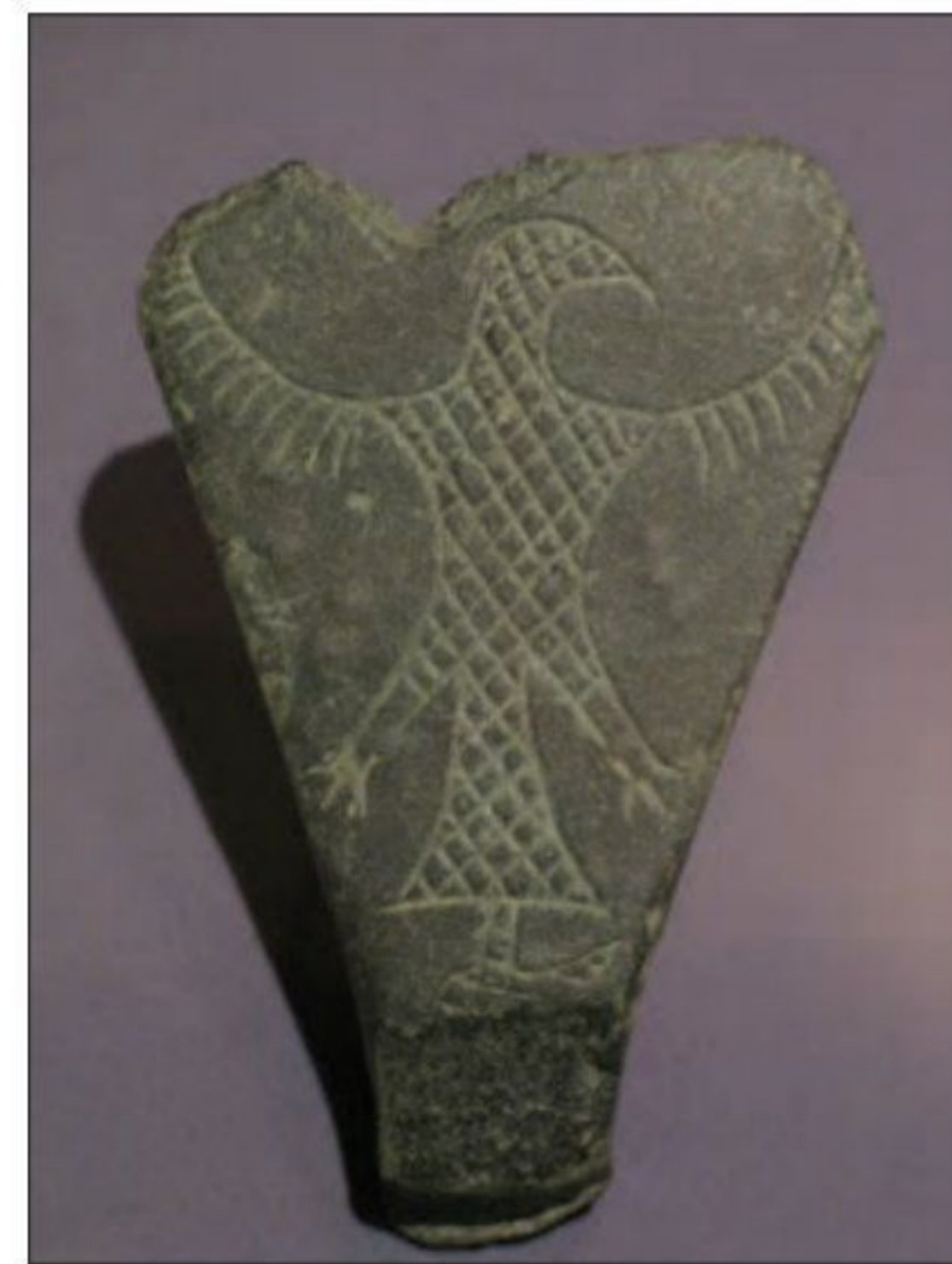
○ نمونه ای از اشیا سنگ صابونی تپه یحیی - بافت

با استفاده از گل و سنگ و سرانجام خشت، بناهای محکم تری بسازند. آنها سطح دیوارها را با کاهگل می پوشاندند و گاه رنگ آمیزی می کردند و سقف خانه ها را معمولاً با تیرهای چوبی می پوشاندند (4)