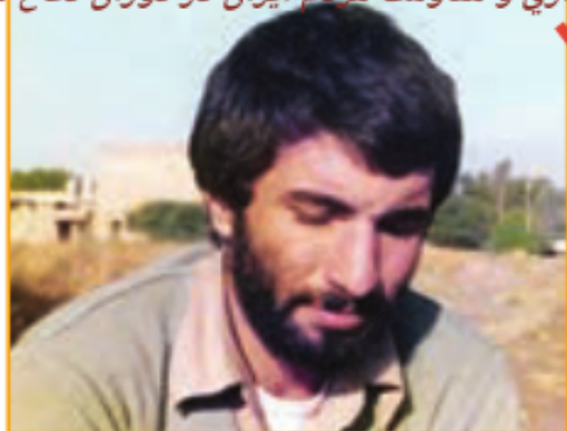
فرمانده سپاه خرمشهر چه کسی بود؟

خرمشهر مظهر پایداری و مقاومت مردم ایران در دوران دفاع مقدس شد؛ زیرا مردم این شهر و رزمندگانی که از شهرهای مختلف ایران خود را به آنجا رسانیدند، در مقابل چند لشکر مجهز به توپ و تانک دشمن برای حفظ این شهر مقاومت کردند. فرماندهی سپاه خرمشهر بر عهده محمد جهان آرا بود که با ایثار و فداکاری ۳۴ روزه، خرمشهر را در