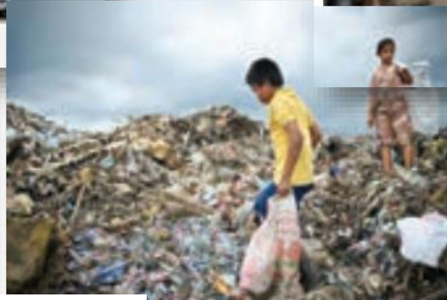
استفاده از کار کودکان در جمع آوری زباله - فیلیپین