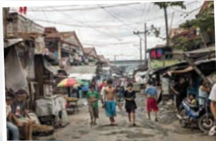
بیش از چهار میلیون نفر از مردم فیلیپین در زاغه‌ها زندگی می‌کنند.