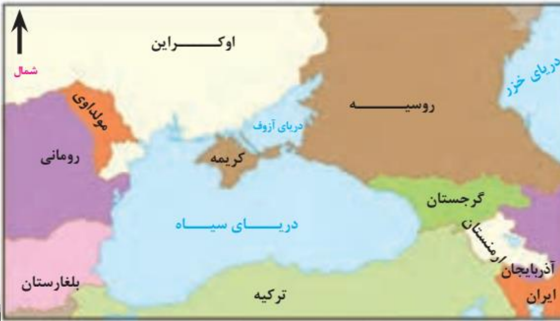
موقعیت جغرافیایی شبه جزیره کریمه

دولت های غربی معتقدند که تسلط بر منطقه کریمه، فرمانروایی بر دریای سیاه و منطقه اوراسیاست و به همین دلیل، به پیوستن کریمه به روسیه اعتراض دارند. امروزه این شبه جزیره به موضوع کشمکش بین اوکراین و روسیه با مداخله امریکا و دولت های غربی عضو پیمان ناتو تبدیل شده است.