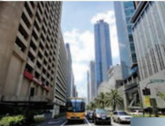
خیابانی در مانیل پایتخت فیلیپین

سیاست ها و تصمیماتی که حکومت یک کشور در زمینه اقتصاد، اشتغال و توزیع در آمد اتخاذ می کند و همچنین نوع برنامه ریزی و بودجه ای که به نواحی مختلف کشور (شهر، روستا، استان و ...) اختصاص می دهد، بر توزیع امکانات و تجهیزات در نواحی مختلف اثر می گذارد. در نتیجه، ممکن است توزیع امکانات مناسب و عادلانه یا به دور از عدالت باشد و چشم اندازها و فضاهای جغرافیایی متفاوتی ایجاد شود.