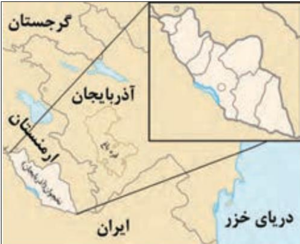
ناحیه سیاسی ویژه - ناحیه خودمختار نخجوان

به عبارت دیگر، خودمختاری، استقلال محدود یک واحد سیاسی در اداره امور خود در داخل یک کشور است.