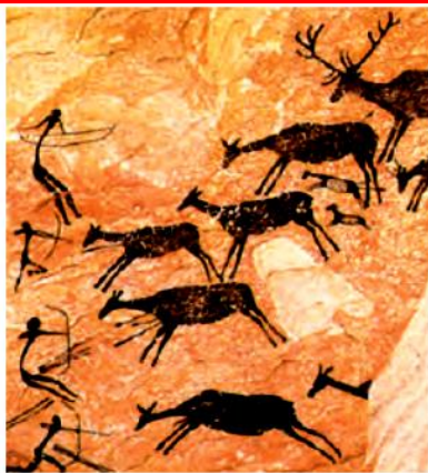
تصویر نقاشی از داخل غار لاسکو در فرانسه، عده‌ای معتقدند که این نقاشی‌ها مربوط به ۱۳۰۰۰ سال پیش است.

نقاشی‌های به‌جا مانده روی دیوار غارهای قدیمی یا تخته سنگ‌ها نشان می‌دهد که شکار در تأمین غذای انسان‌ها در آن دوره نقش مهمی داشته است.