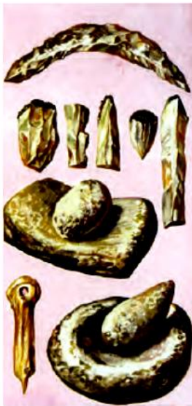
ابزارهای سنگی اولیه برای کشاورزی و آرد کردن گندم و جو

کشاورزی هم مانند کشف آتش زندگی انسان را تغییر داد. پیش از آن، انسان‌ها مجبور بودند برای به دست آوردن غذا از جایی به جای دیگر بروند اما با رواج کشاورزی، مردم در کنار رودها و چشمه‌ها برای خود خانه‌های دائمی ساختند و در یکجا ساکن شدند.