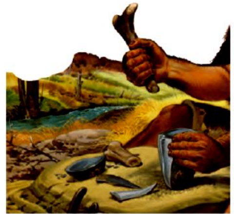
▲ نمونه‌هایی از ابزارهای سنگی که انسان‌ها برای شکار درست کرده بودند.

شاید در گذشته‌های دور، انسان‌ها متوجه آتشی که در اثر رعد و برق به وجود می‌آمد، شدند و بعدها بی‌برند که با به هم زدن بعضی سنگ‌ها می‌توانند آتش درست کنند. کشف آتش تغییرات زیادی در زندگی انسان به وجود آورد.