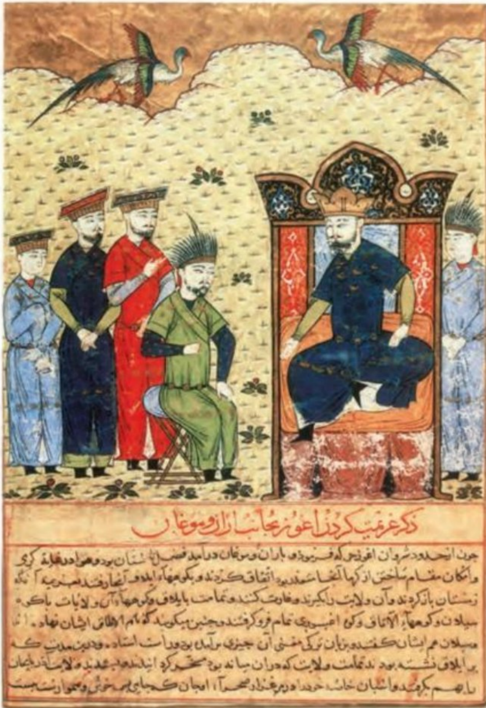
برگی از جامع التواریخ، نقاشی با آبرنگ و آب طلا