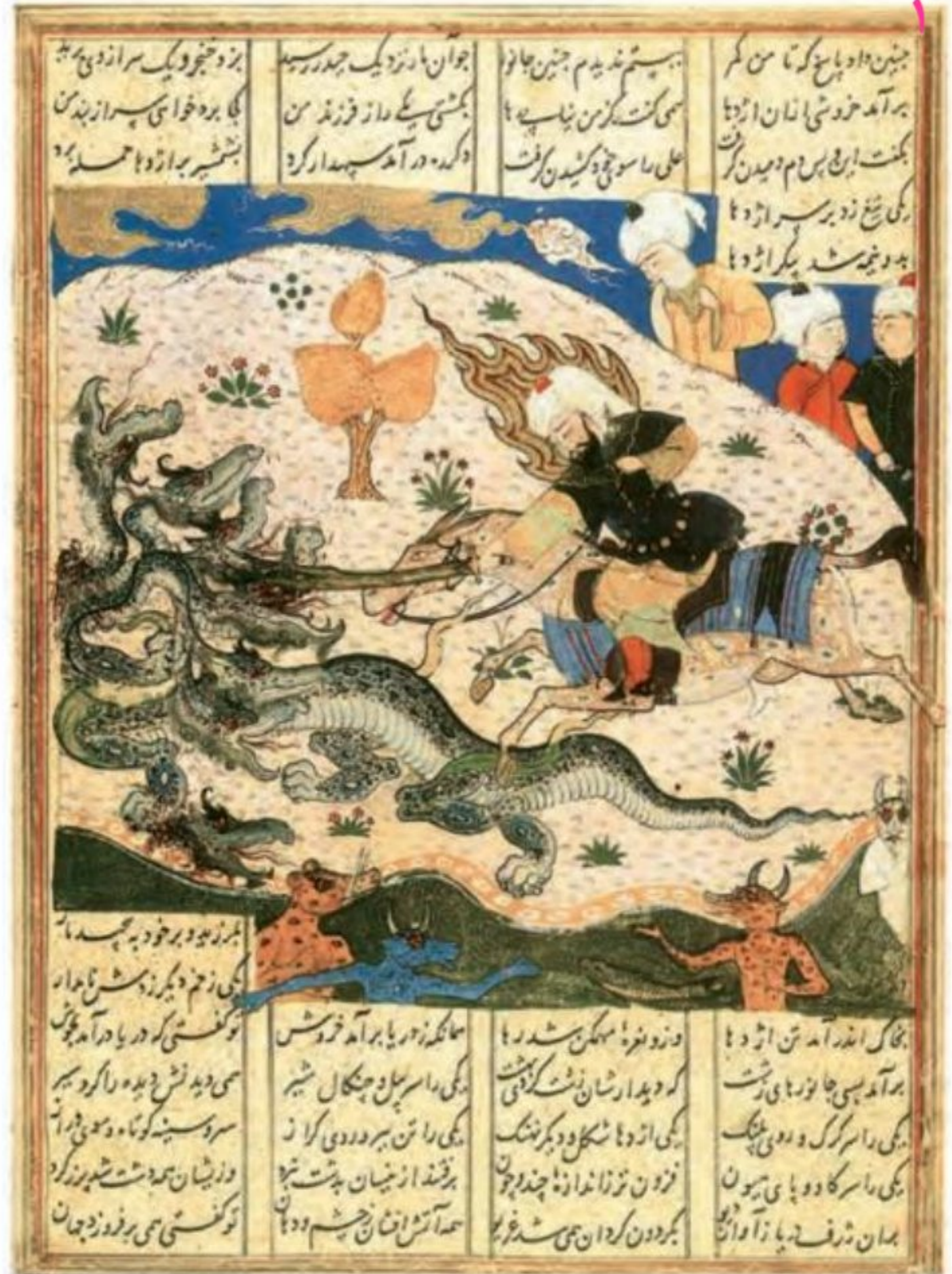
برگی از ظفرنامه شرف الدین علی یزدی