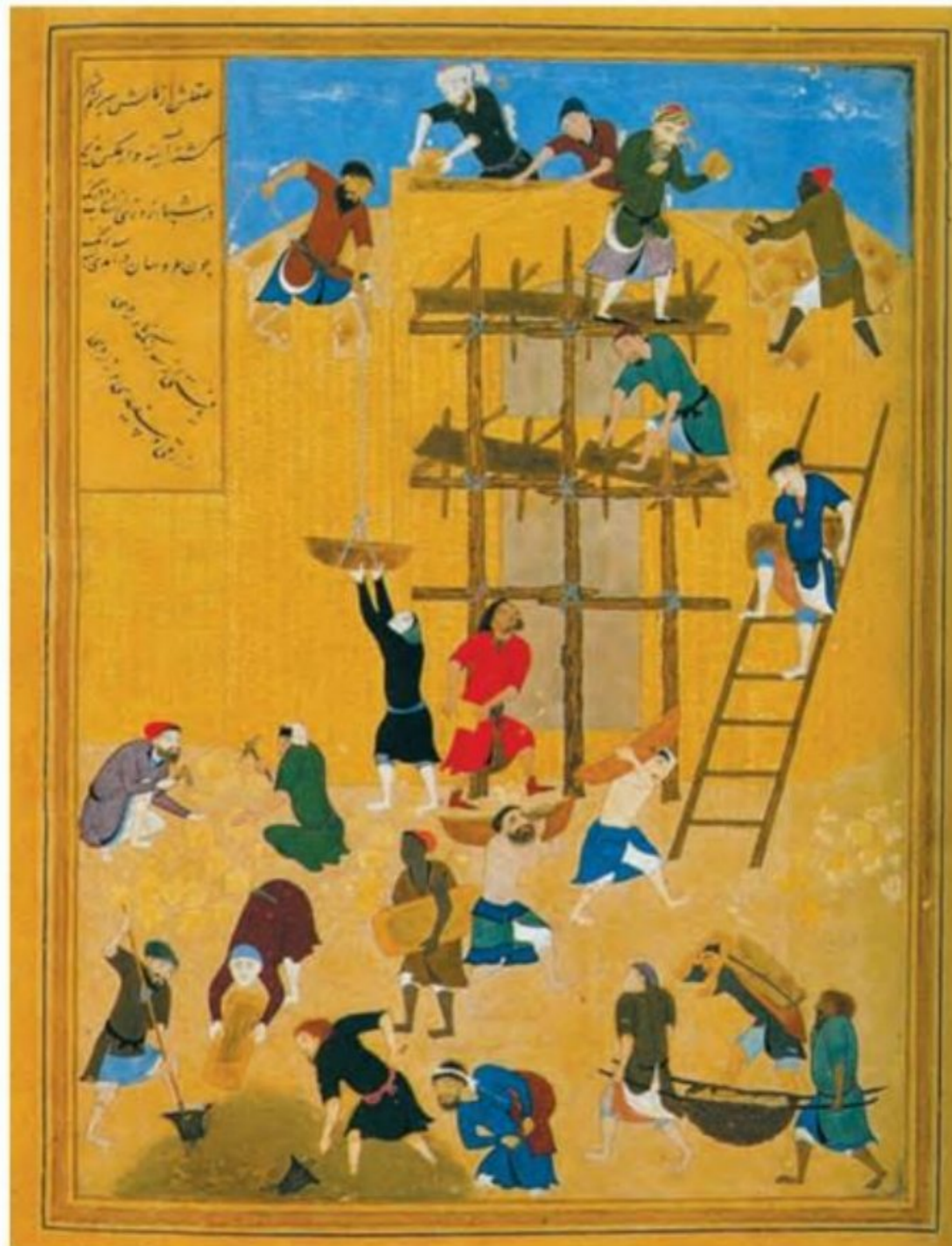
خمسه نظامی (ساختن کاخ خورنق) اثر کمال‌الدین بهزاد نقاش مکتب هرات سال ۸۹۹ق

۷) هنر نگارگری در روزگار جانشینان تیمور چون شاهرخ و نوادگانش از جمله بایسنقر میرزا، در سراسر ایران به ویژه خراسان گسترش شگفت‌انگیز یافت. در این دوره، مصور کردن کتاب‌های گوناگون از نجوم گرفته تا شاهنامه و دیوان‌های شعر به لحاظ کمی و کیفی افزایش پیدا کرد و کتاب‌هایی با قطع بزرگ پدید آمد. کیفیت خوب و فراوانی کاغذ و مواد نگارگری از قبیل رنگ و طلا در پدید آمدن کتاب‌های مصور به هنرمندان کمک زیادی کرد. فاخرترین نمونه شاهنامه مصور شده در عصر تیموری، شاهنامه بایسنقری است که به دستور شاهزاده بایسنقر، پسر شاهرخ که سیاستمداری هنرمند و هنرپرور بود، خوشنویسی و مصور شد. ۷