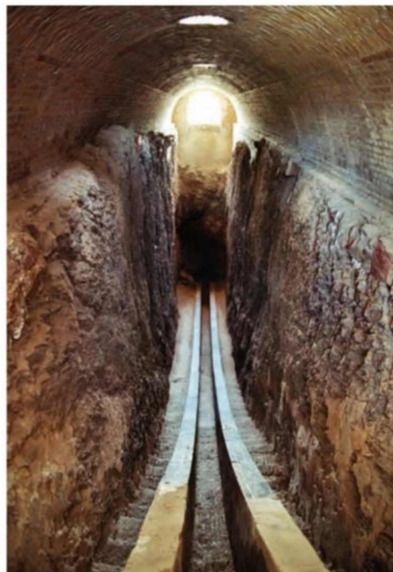
صفحه آخر رساله محیطیه - کتابخانه آستان قدس رضوی، شماره ۲۲۹