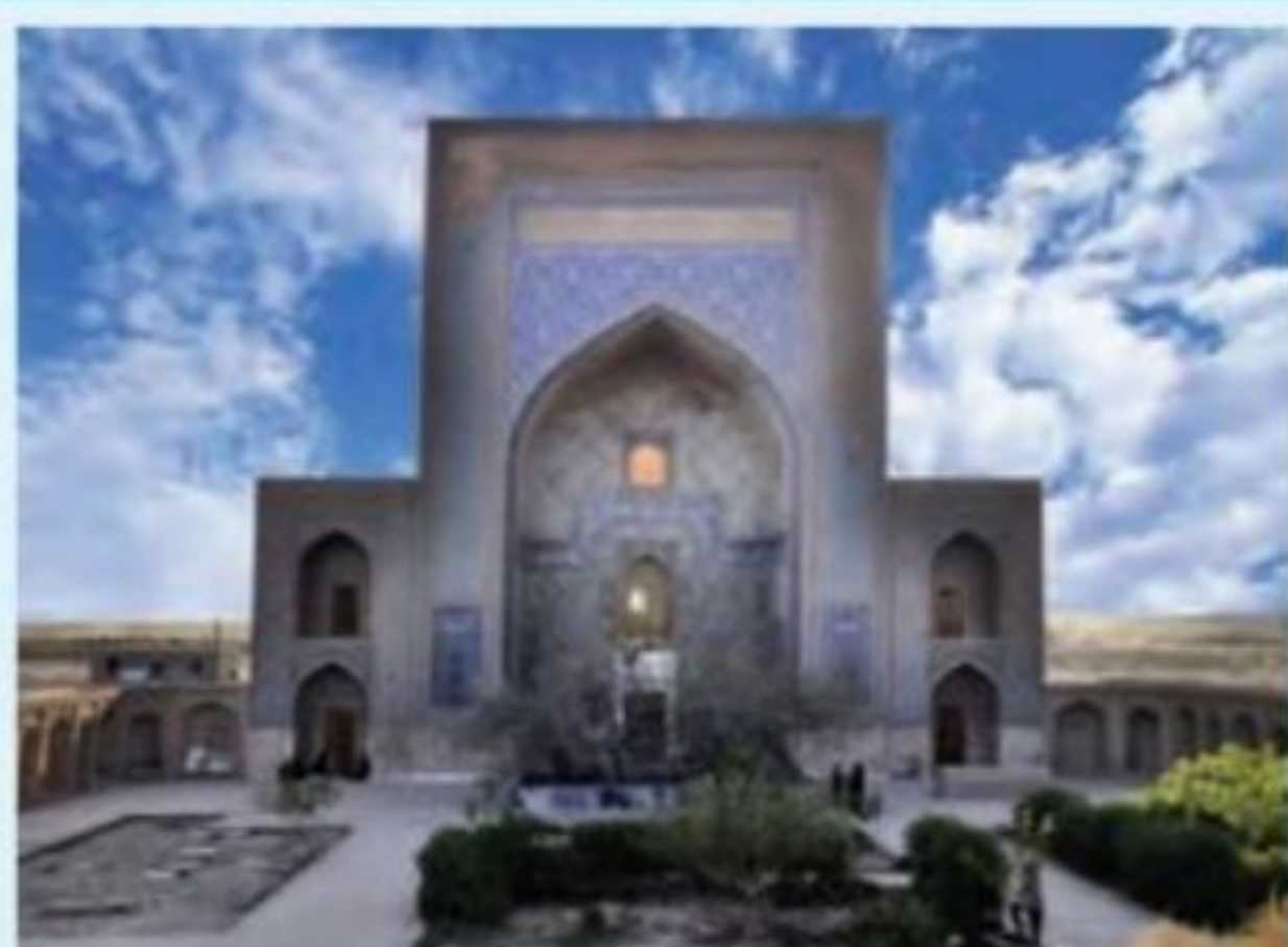
آرامگاه شیخ زین‌الدین تائبادی - شهرستان تائباد

تیمور گورکانی در یکی از یورش‌های خود به ایران، چون به تربت جام رسید، بر آن شد که از مولانا شیخ زین‌الدین ابوبکر تائبادی، یکی از مشایخ بزرگ صوفی، دیدن کند. جمعی از بزرگان شهر از مولانا تائبادی تقاضا کردند که دعوت امیر تیمور را گردن نهد، ولی او امتناع کرد و گفت: «فقیر را با امیر هیچ مهمی نیست». چون تیمور اصرار کرد، مشایخ و بزرگان ضمن نامه‌ای به حکم مصلحت از مولانا خواستار شدند که با تیمور ملاقات کند، اما ابوبکر تائبادی همچنان امتناع ورزید و گفت: «من مردی روستایی هستم و تکلفات درباری نمی‌دانم». تیمور خود روی به اقامتگاه مولانا تائبادی نهاد، و به عزلتگاه شیخ رفت و از او خواست که نصیحتی گوید. او امیر را به عدل و داد نصیحت نمود و گفت: «از ظلم و جور بپرهیز و اتباع خود را از اعمالی که بر خلاف دیانت است منع کن». امیر تیمور به او گفت: «چرا شاه را نصیحت نکردی (منظور شاه قبلی است) که خمر می‌خورد و به ملامی و مناهی اشتغال داشت؟». مولانا جواب داد: «او را گفتیم، نشنید. حق تعالی تو را به او گماشت. تو اگر نیز نشنوی، دیگری بر تو گمارد!»