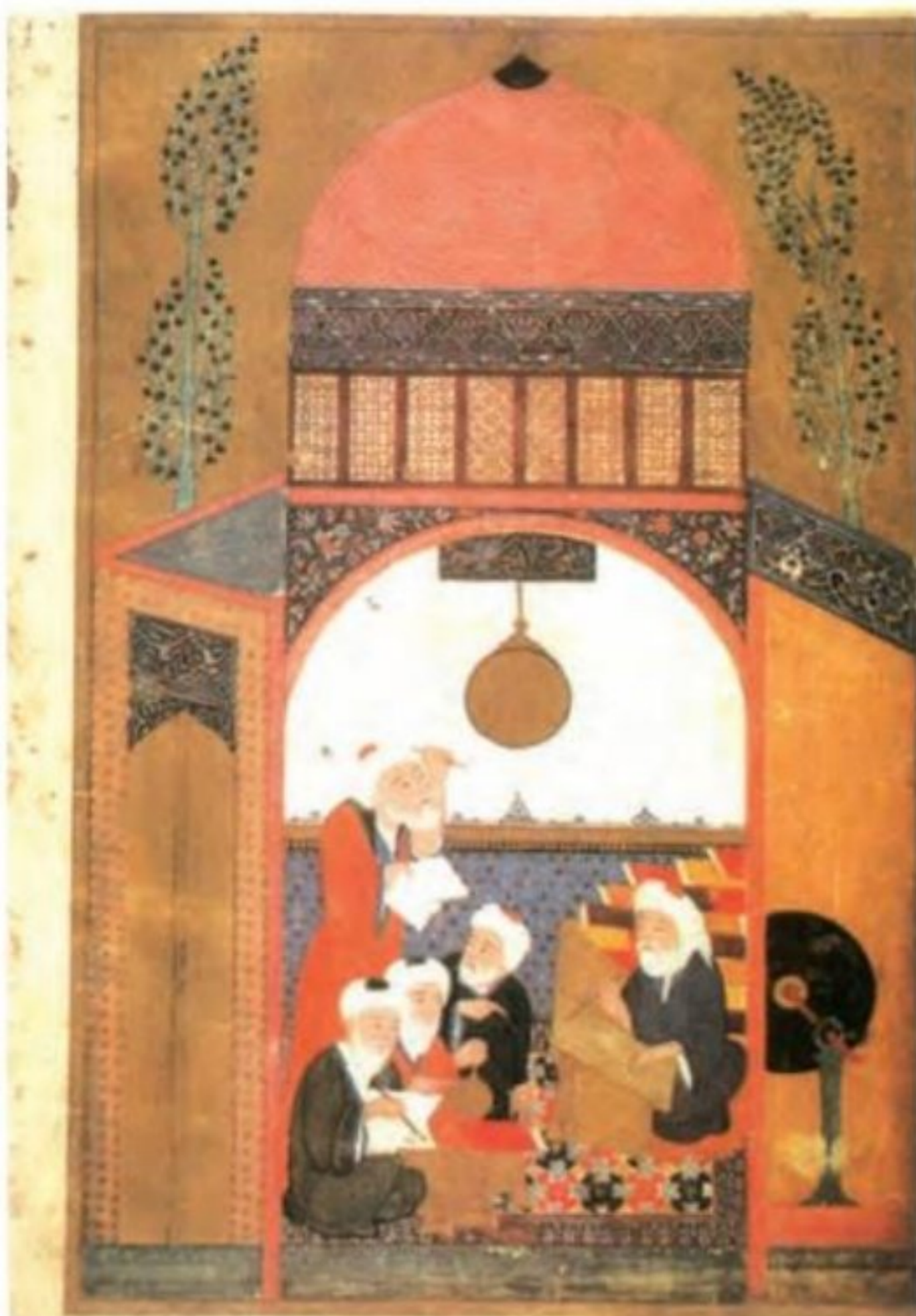
خواجه نصیرالدین توسی و دانشمندان دیگر هنگام کار در رصدخانه مراغه