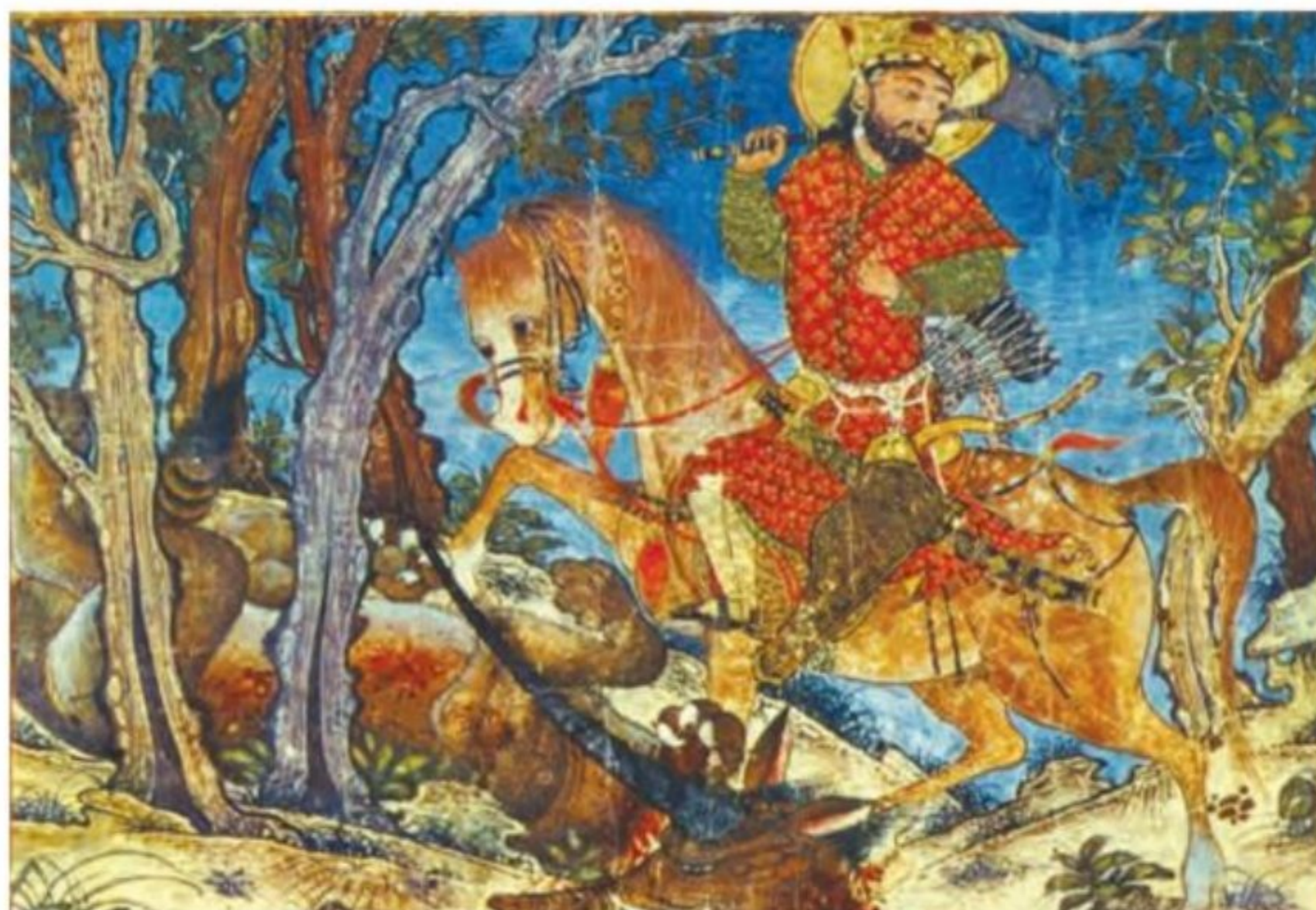
برگی از شاهنامه دموت - بهرام گور در حال شکار، موزه هنر دانشگاه هاروارد

۱- نگارگری و خوشنویسی (هنر نگارگری و نقاشی در عصر ایلخانی و تیموری رونق و رشد بسزایی داشت. در عصر ایلخانان، هنر نگارگری که تلفیقی از سنت‌های نقاشی ایرانی و چینی بود، بیشتر در کتاب‌آرایی و مصور ساختن کتاب‌های تاریخی و متون ادبی و نیز کتاب‌های پزشکی، جانورشناسی و نجوم جلوه‌گر شد. ایلخانان مغول از مشوقان پدید آوردن شاهنامه‌های مصور به شمار می‌روند. نمونه باقی‌مانده آن، شاهنامه مشهور به دموت است) ۶ ۶ قلمرو پهناوری که مغول‌ها در بخش وسیعی از آسیا از چین تا دریای مدیترانه فتح کردند، دارای پیشینه فرهنگی و هنری عظیم و پیشرفته‌ای بود. در نتیجه فتوحات مغول، تجارب و سنت‌های هنری و هنرمندان سرزمین‌های فتح شده با یکدیگر پیوند خوردند و زمینه مناسبی برای شکوفایی هنر در دوران ایلخانان و تیموریان فراهم شد. پیدایش مراکز بزرگ فرهنگی و هنری در شهرهای مختلف، به خصوص مراغه، تبریز، شیراز، هرات و سمرقند و تأسیس کتابخانه‌های عظیم در این شهرها، تأثیر ژرفی بر رونق