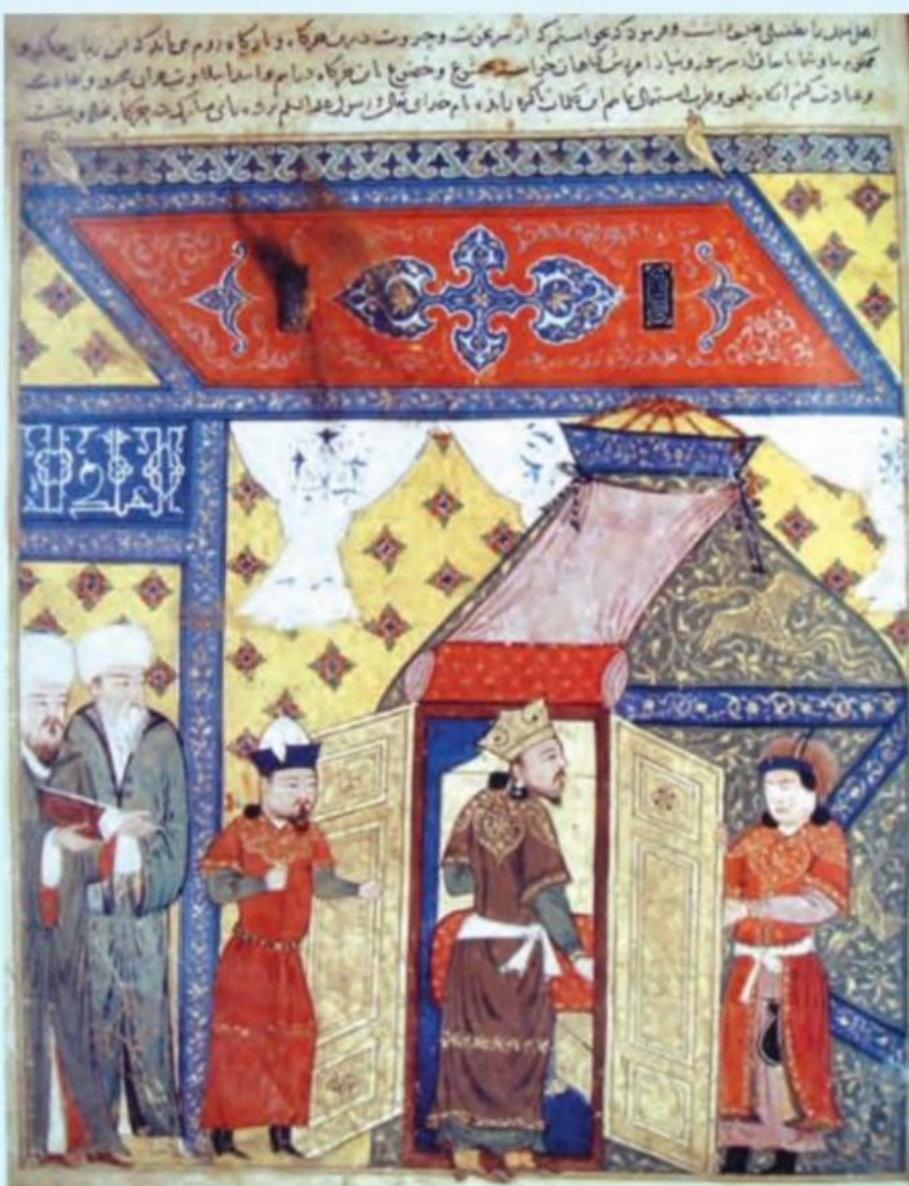
نگاره اسلام آوردن غازان خان

تکودار (حک ۶۸۱ - ۶۸۳ ق) پسر هولاکوخان، نخستین ایلخان مسلمان به شمار می‌رود. او پیش از رسیدن به حکومت، مسلمان شد و نام اسلامی احمد را برای خود برگزید. دولتمردان ایرانی و در رأس آنها شمس‌الدین محمد جوینی، نقش زیادی در به قدرت رساندن وی داشتند. تکودار در دوران کوتاه فرمانروایی خود اقدامات مؤثری در سیاست داخلی و خارجی به نفع مسلمانان انجام داد. اگرچه این ایلخان مسلمان توسط ارغون که از سوی بزرگان و شاهزادگان غیرمسلمان مغول پشتیبانی می‌شد، از قدرت برکنار و کشته شد، اما بزرگان ایرانی بر تلاش خود برای مسلمان شدن مغولان و مهار رفتارهای غیرمدنی آنها افزودند. آنان سرانجام موفق شدند که غازان‌خان، هفتمین ایلخان را که شخصیت مقتدری داشت به دین اسلام رهنمون سازند (۶۹۴ ق). بسیاری از امیران و سپاهیان مغول نیز به تبعیت از وی مسلمان شدند. غازان که نام اسلامی محمود را بر خود نهاده بود، اسلام را دین رسمی اعلام کرد و در مسجد جامع تبریز نماز گزارد. وی اقدامات مهمی در جهت اسلامی کردن جامعه و حکومت انجام داد و برای سادات و مشایخ و بزرگان دین، مقرری تعیین کرد.