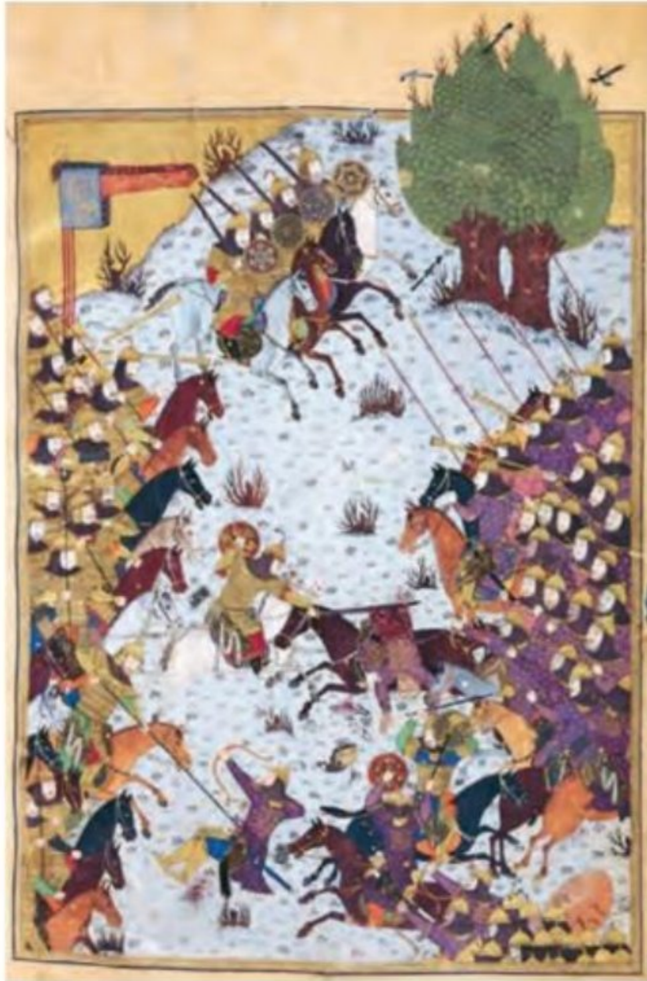
صفحه‌ای از نگاره‌های شاهنامه بایسنقری

۷) هنر نگارگری در روزگار جانشینان تیمور چون شاهرخ و نوادگانش از جمله بایسنقر میرزا، در سراسر ایران به ویژه خراسان گسترش شگفت‌انگیز یافت. در این دوره، مصور کردن کتاب‌های گوناگون از نجوم گرفته تا شاهنامه و دیوان‌های شعر به لحاظ کمی و کیفی افزایش پیدا کرد و کتاب‌هایی با قطع بزرگ پدید آمد. کیفیت خوب و فراوانی کاغذ و مواد نگارگری از قبیل رنگ و طلا در پدید آمدن کتاب‌های مصور به هنرمندان کمک زیادی کرد. فاخرترین نمونه شاهنامه مصور شده در عصر تیموری، شاهنامه بایسنقری است که به دستور شاهزاده بایسنقر، پسر شاهرخ که سیاستمداری هنرمند و هنرپرور بود، خوشنویسی و مصور شد. ۷