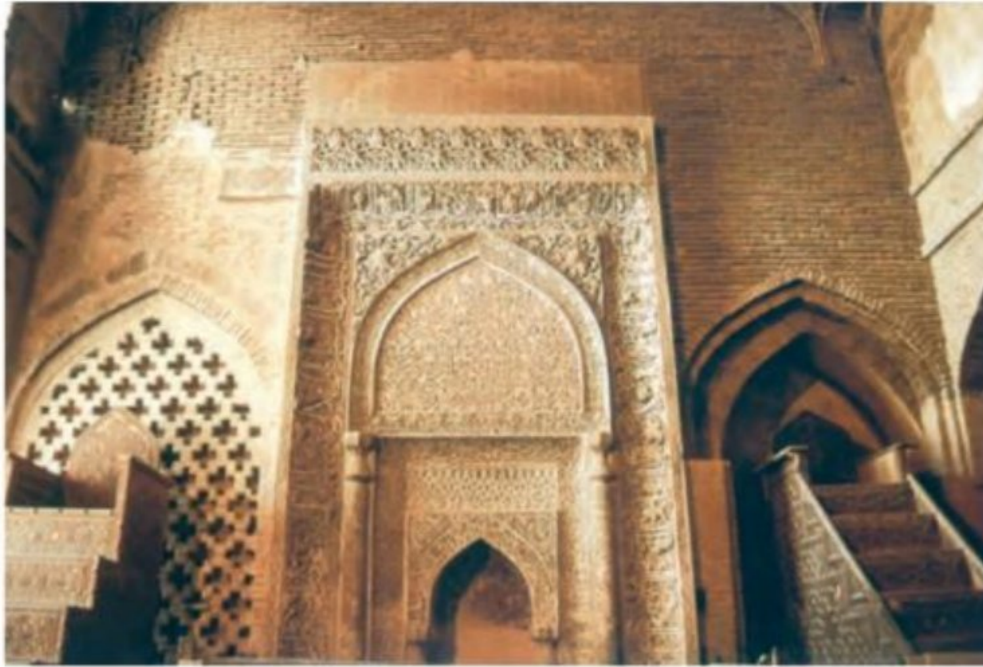
محراب مسجد جامع اصفهان

۱۰- چه عاملی باعث احیای فعالیت های علمی در دوره ایلخانی شد؟