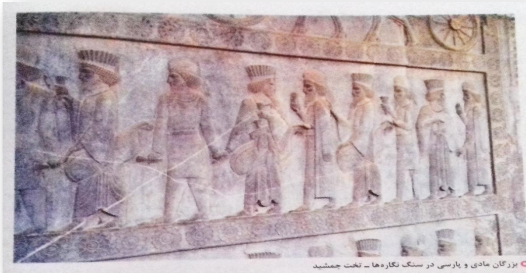
بزرگان مادی و پارسی در سنگ نگاره‌ها - تخت جمشید