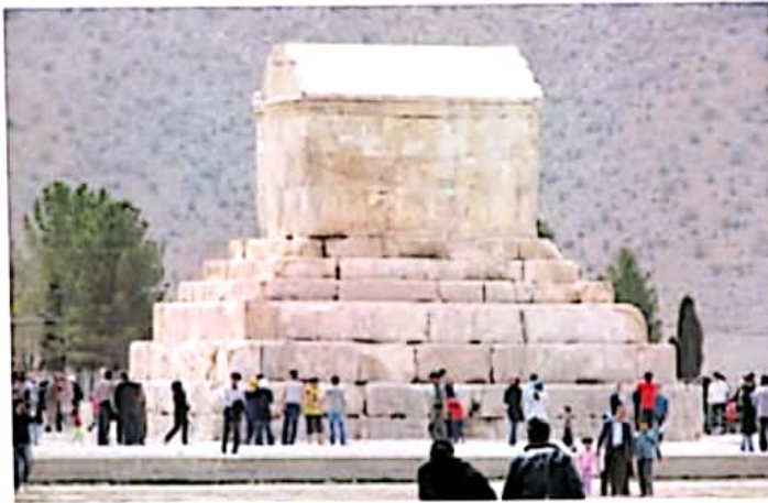
مقبره‌ی کوروش - پاسارگاد