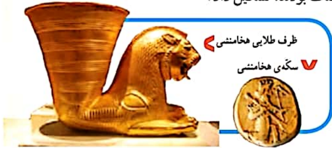
ظرف طلایی هخامنشی

۱۶) در چاپارخانه‌ها همیشه اسب‌های تازه نفس آماده‌ی حرکت بودند. پیک‌ها (نامه‌رسان‌ها) در آنجا اسب خود را عوض می‌کردند و سوار بر اسب‌های تازه نفس، نامه‌ها را به دورترین نقاط کشور می‌رساندند. ۱۶ از دیگر کارهای مهم داریوش این بود که دستور داد سگه‌هایی از طلا بسازند. او همچنین یک سپاه ده‌هزار نفری از سربازان ورزیده، که همیشه آماده‌ی جنگ بودند، تشکیل داد.