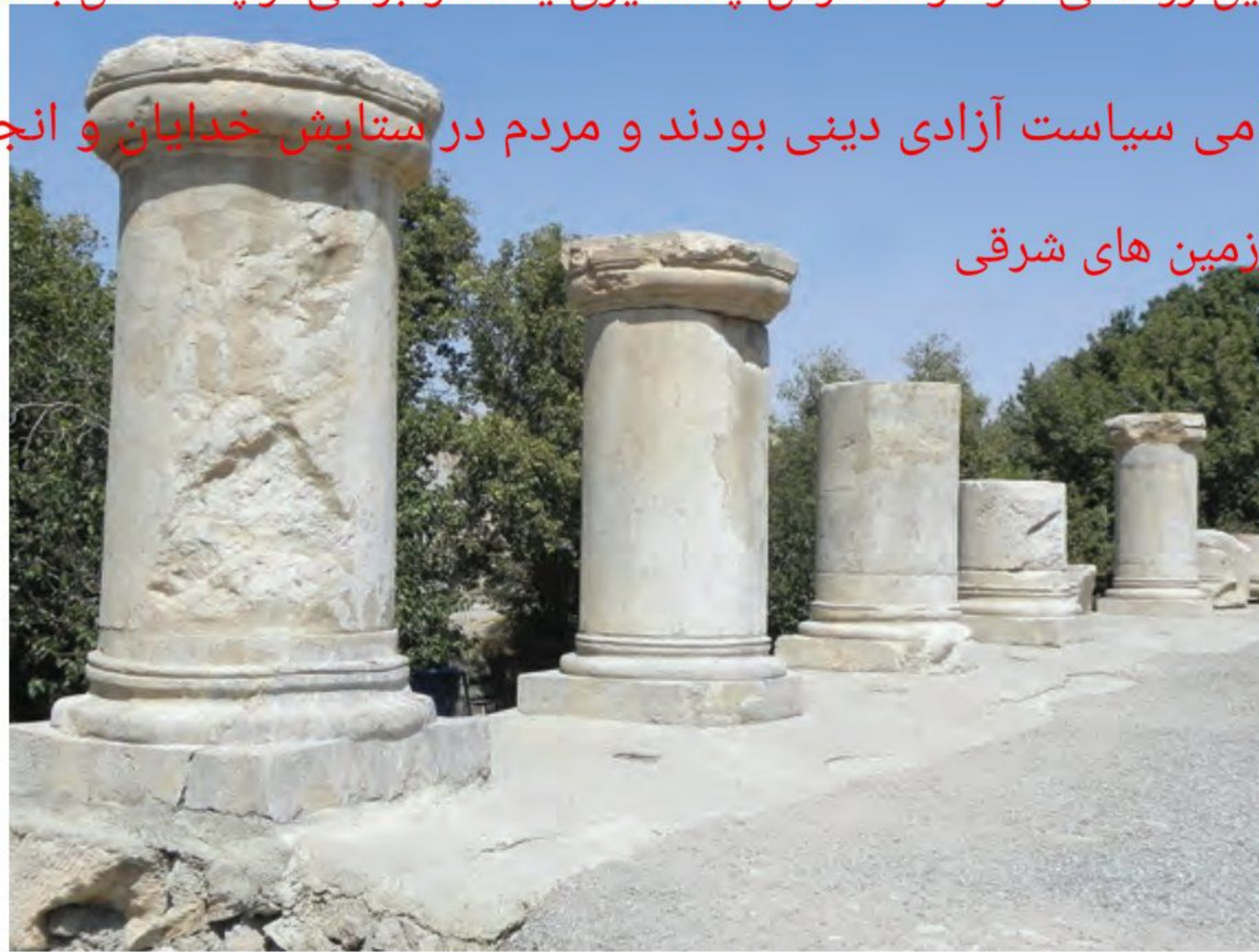
بقایای معبد آناهیتا در کنگاور

اشکانیان همانند هخامنشیان حامی سیاست آزادی دینی بودند و مردم در ستایش خدایان و انجام مراسم دینی خود آزاد بودند