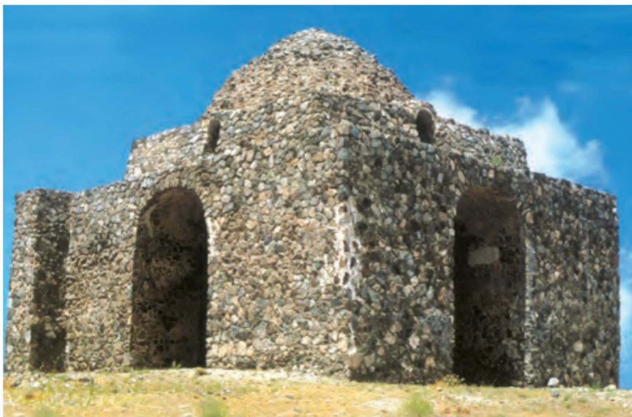
○ آتشکده ای نزدیک مشهد متعلق به دوره ساسانی

1) در دین زرتشتی، آتش، عنصری مقدس بود و زرتشتیان با نیایش در برابر آتش، اهوره مزدا را ستایش می کردند. به همین دلیل در دوره ساسانیان آتشکده های بسیاری در شهرها و روستاهای ایران ساخته شد. 2) آتشکده آذربایجان در خراسان، مخصوص کشاورزان، آذرگشنسپ در آذربایجان، ویژه شاهان و آذر فرنبغ در فارس، خاص موبدان، بزرگ تر و شکوهمندتر از دیگر آتشکده ها بودند. 2) در عصر ساسانیان، اوستا به زبان پهلوی ترجمه و شرح و تفسیرهایی بر آن نوشته شد. همچنین کتاب های اعتقادی بر اساس تعالیم زرتشت به زبان پهلوی تالیف شد. 3) جمله مهم ترین و مفصل ترین این کتاب ها باید از دینکرد نام برد که دانشنامه ای مشتمل بر عقاید زرتشتی است. 3) کتاب