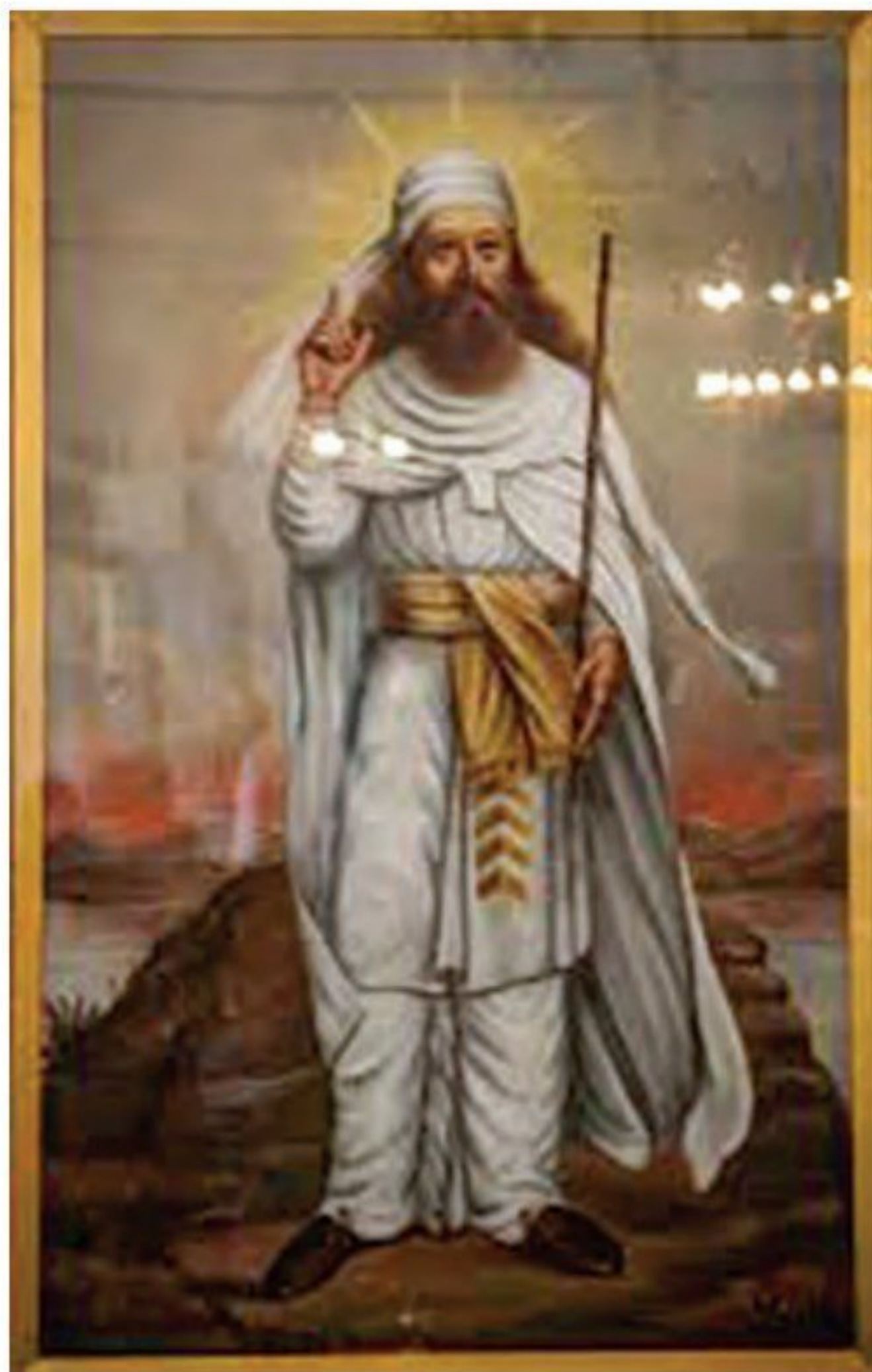
○ نگاره خیالی زرتشت در آتشکده یزد

3 تعالیم زرتشت) اساس تعالیم زرتشت بر یگانگی و پرستش آهوره‌مزدا قرار دارد. بر پایه آموزه‌های زرتشت، آهوره‌مزدا، آفریدگار آسمان‌ها و زمین، خورشید، ماه و ستارگان، آب‌ها و گیاهان، روشنایی و تاریکی است. هیچ چیز از دایره قدرت و خواست او بیرون نیست. مطابق تعالیم زرتشتی، گروهی