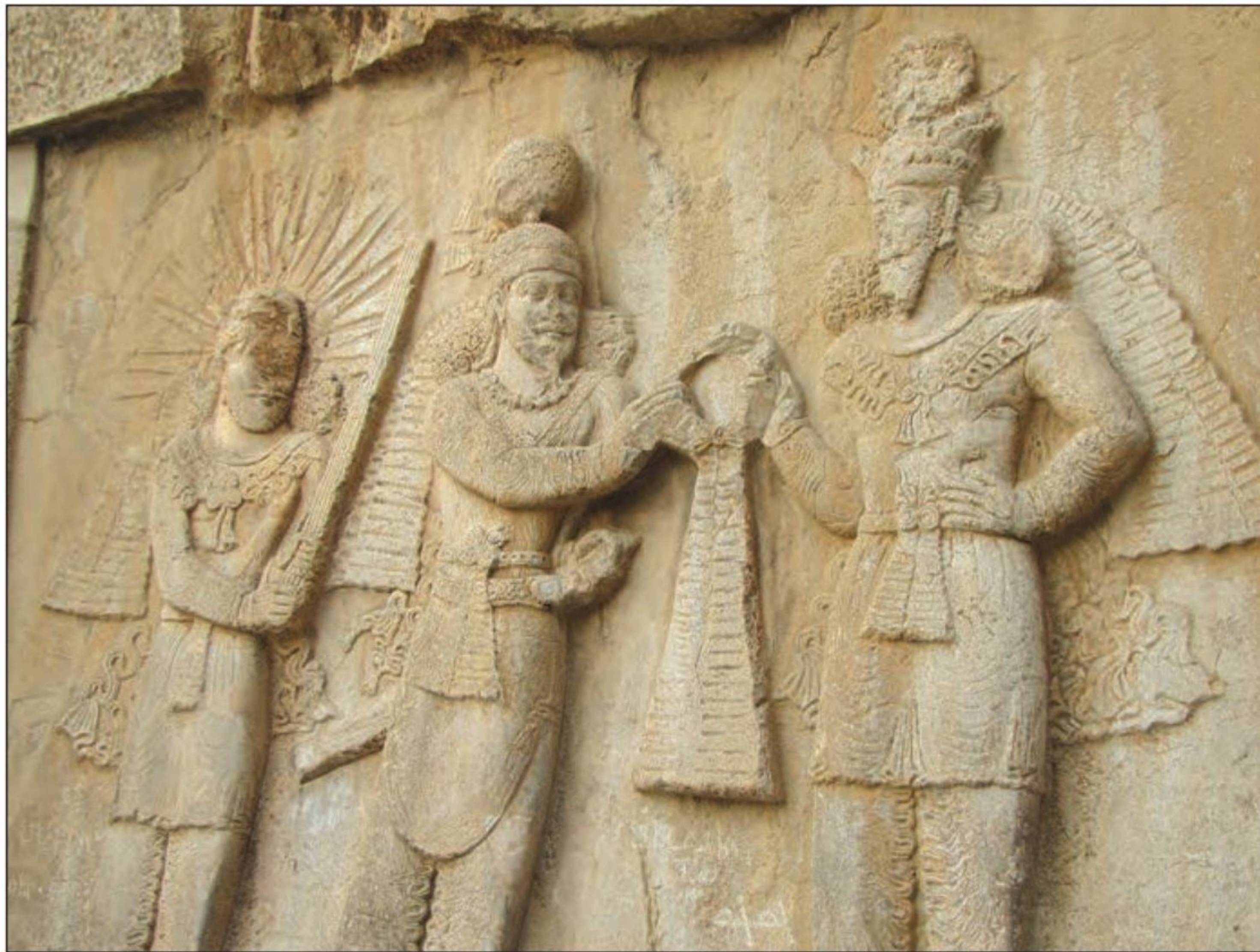
● طاق بستان، آهوزه مزدا (سمت راست) هنگام اعطای حلقه قدرت به اردشیر دوم و یا به قولی شاپور دوم ساسانی، ایزد میترا (سمت چپ)

ساسانیان: درباره وضعیت دین در دوره ساسانی و سیاست دینی ساسانیان، اخبار و آگاهی های بیشتری در دسترس است. منابع این اخبار و آگاهی ها عبارتند از (سنگ نوشته ها، یونانی و رومی و نیز شاهنامه فردوسی) 1