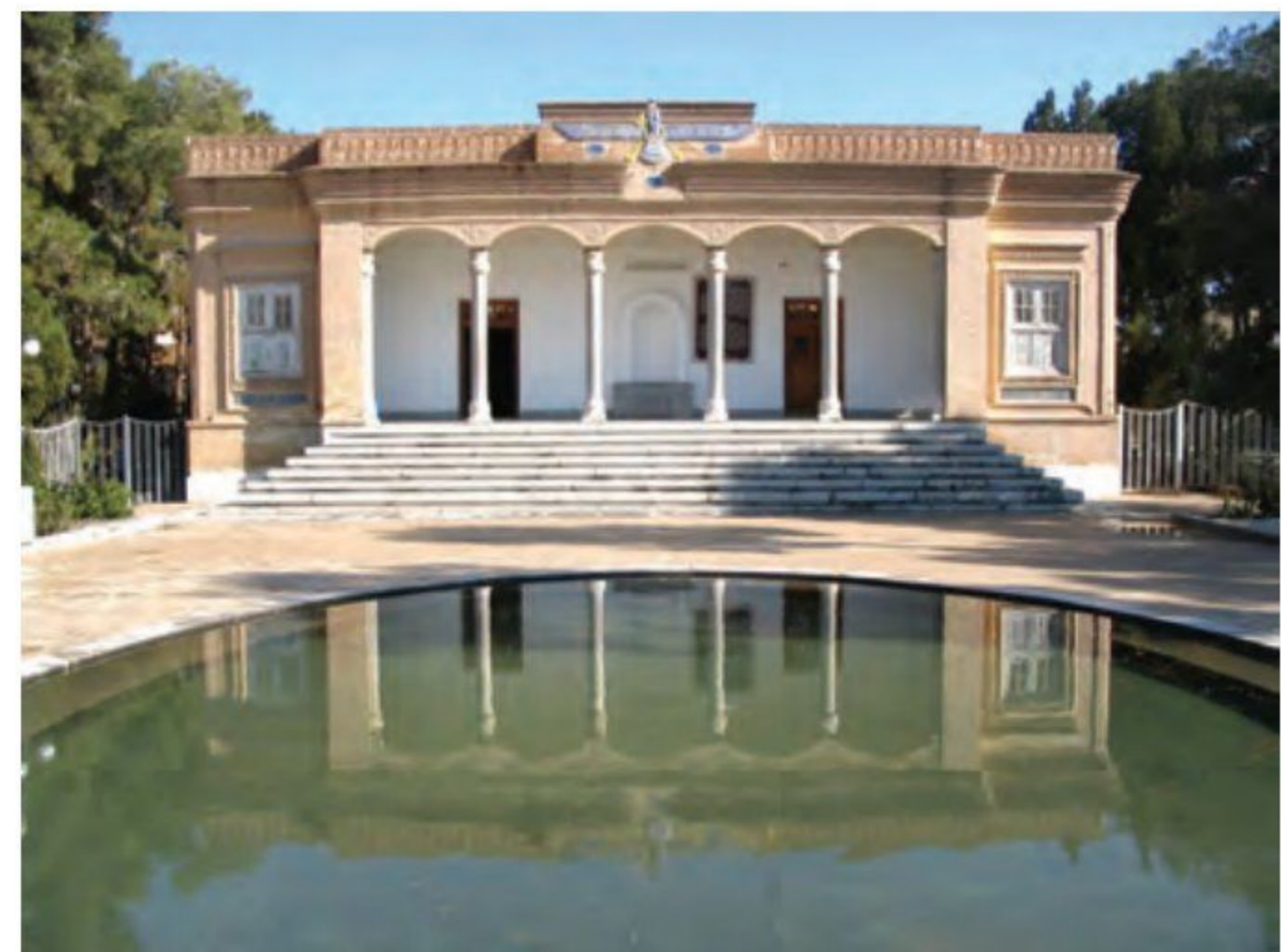
○ آتشکده یزد