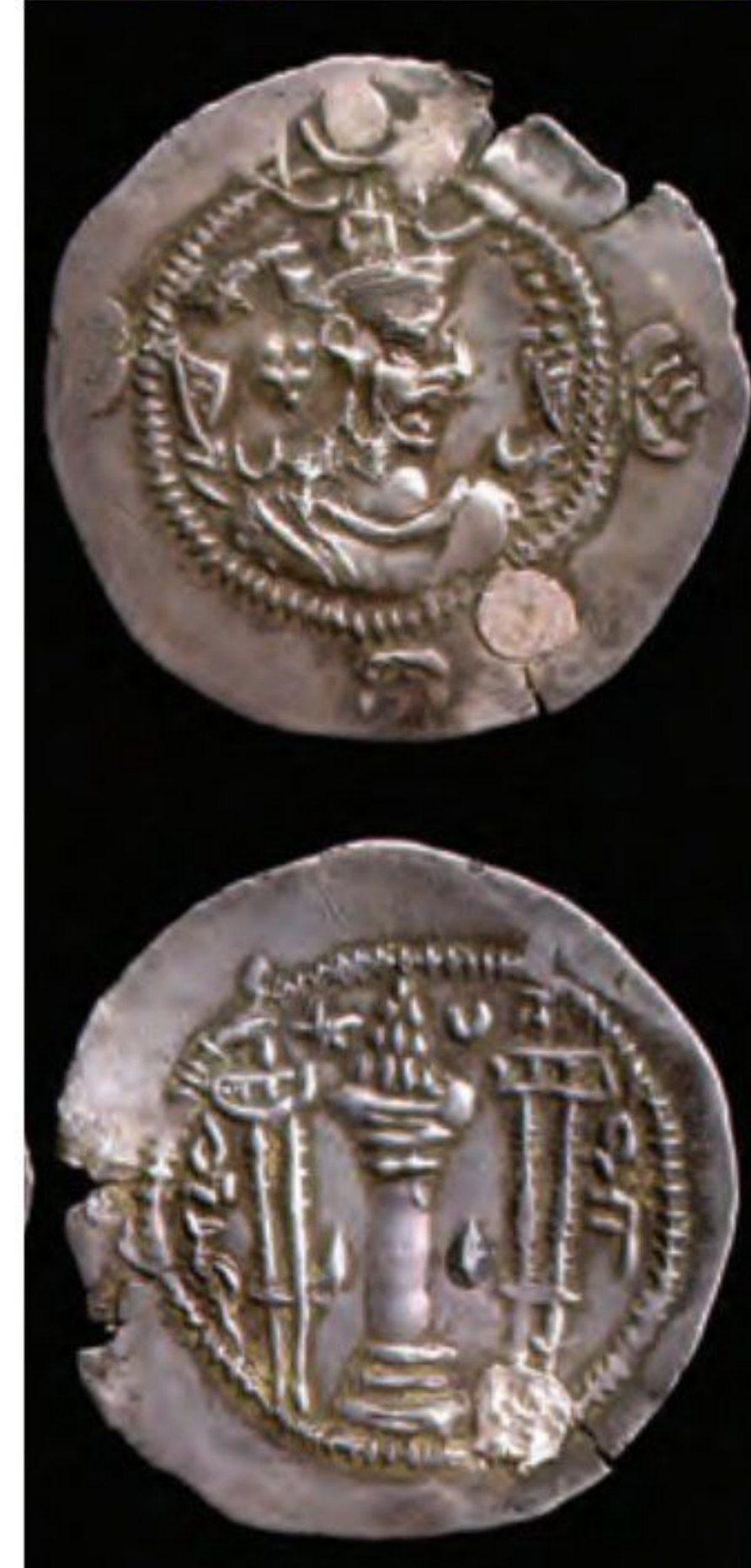
○ سکه ساسانی با نقش آتشدان ○ کرتیرموبد بزرگ در سنگ نگاره بهرام دوم - نقش رستم