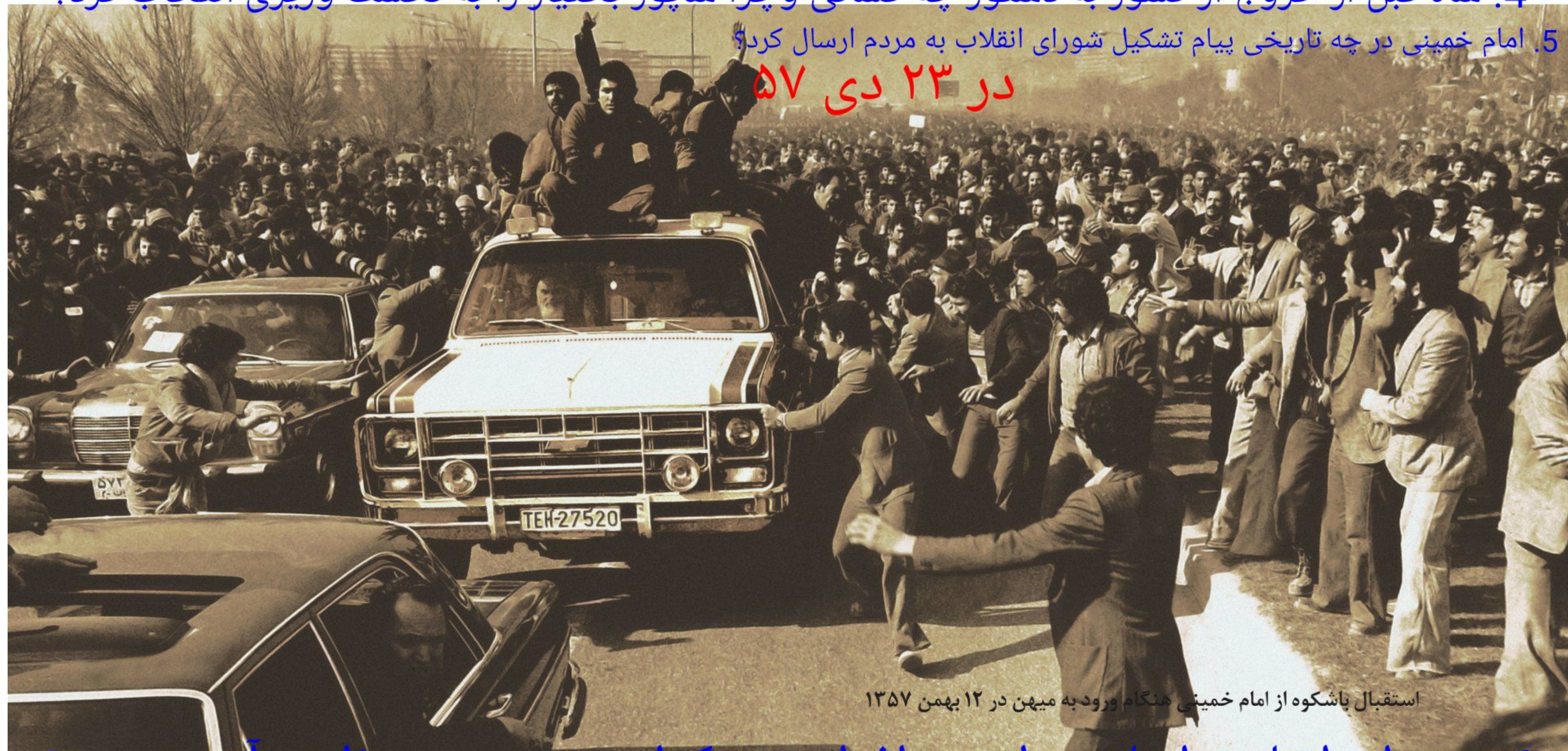
استقبال پاشکوه از امام خمینی هنگام ورود به میهن در ۱۲ بهمن ۱۳۵۷

5. امام خمینی در چه تاریخی پیام تشکیل شورای انقلاب به مردم ارسال کرد؟ در ۲۳ دی ۵۷