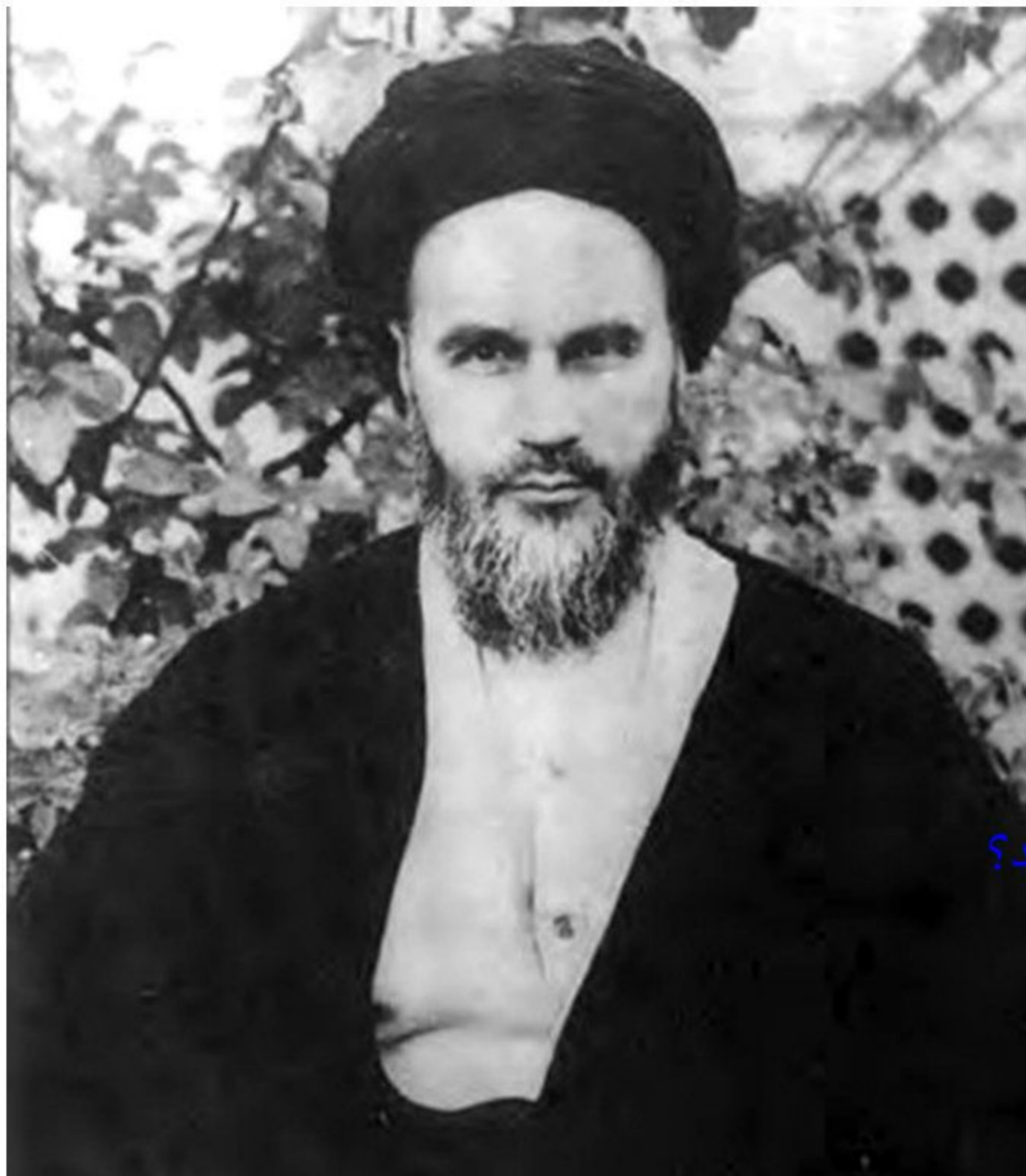
امام خمینی، رهبر نهضت اسلامی

10. مردم چه شهرهایی در برابر انقلاب سفید شاه قیام کردند؟