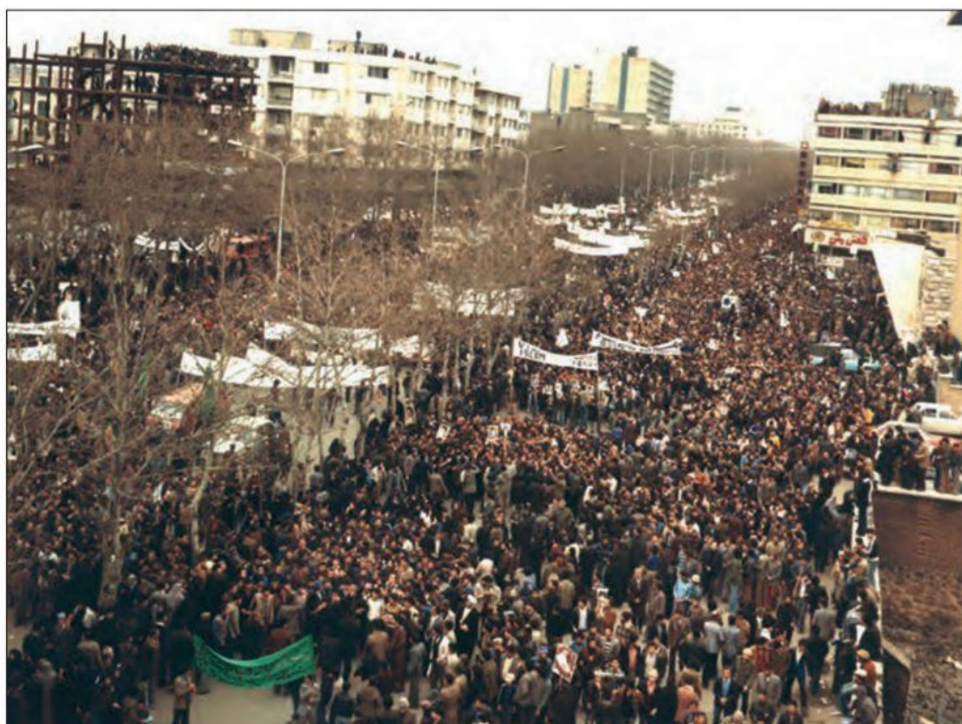
راه پیمایی میلیونی مردم تهران در تاسوعای حسینی، ۱۹ آذر ۱۳۵۷

4 4 حماسه ماه محرم (شاه پس از سرکوب تظاهرات دانشجویان و دانش آموزان در مقابل دانشگاه تهران (۱۳ آبان)، ارتشبد غلامرضا ازهاری را جانشین شریف امامی کرد تا وی با برقرار کردن حکومت نظامی از سرعت حرکت انقلاب بکاهد). 4 اما شروع ماه محرم، مبارزه را وارد مرحله تازه ای کرد. در روزهای تاسوعا و عاشورا میلیون ها تن از مردم در شهرهای مختلف، از جمله تهران، با شرکت در تظاهراتی مسالمت آمیز سقوط حکومت پهلوی و برقراری حکومت اسلامی را فریاد زدند.