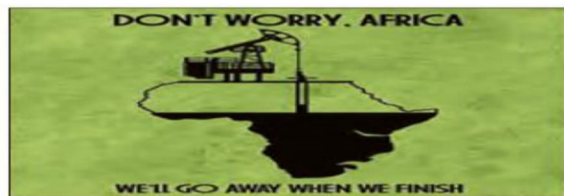
در نتیجه استعمار، فقیرترین قاره مسکونی دنیاست.