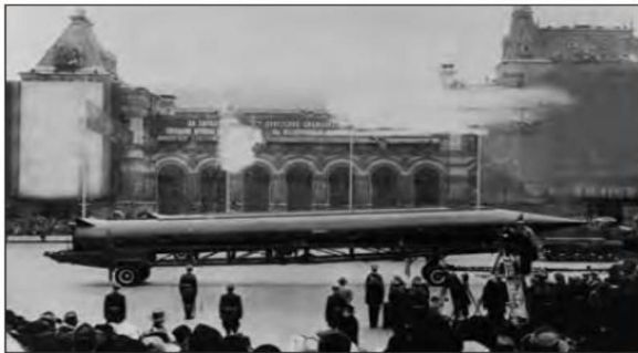
■ تصمیم شوروی مبنی بر استقرار موشک های میان برد در کوبا

خیر- دو جنگ اول و دوم به کشورهای اروپایی و غربی محدود نشدند، بلکه همه جهان را درگیر خود ساختند. بعد از جنگ جهانی دوم نیز، صلیحی پایدار برقرار نشد.