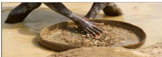
قاره آفریقا از منابع و معادن ارزشمندی مانند نفت، الماس، طلا، اورانیوم، آهن، مس و نقره برخوردار است اما