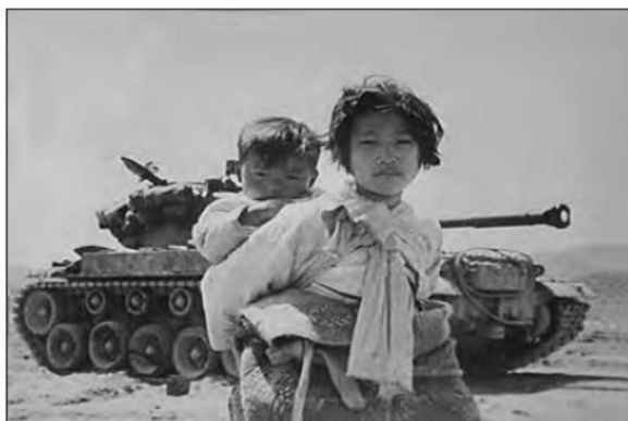
■ جنگ ویتنام جهنمی ترین جنگ قرن بیستم نام گرفت. این جنگ زمانی آغاز شد که آتش جنگ کره به تازگی خاموش شده بود. در این

به اقتصاد کشورهای صنعتی که وابسته به تسلیحات نظامی بود، رونق بخشید.