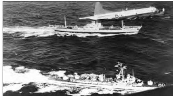
■ بحران موشکی کوبا، که جهان را تا آستانه جنگ جهانی سوم پیش برد؛ حضور هم زمان ناوهای شوروی و آمریکا در آب های کوبا