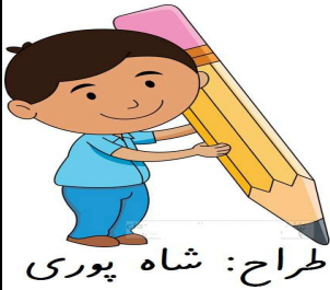
طراح: شاه پوری

نام زیبای شما؟..... دبستان غیر دولتی زکریا یک ( دوره اول ) ناحیه ۳ اصفهان