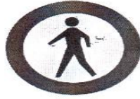
عبور عابر پیاده ممنوع