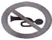
بوق زدن ممنوع

۵- هر یک از تابلوهای زیر چه نشانه‌ای هستند و چه پیامی برای ما دارند؟