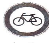
عبور دوچرخه سوار ممنوع