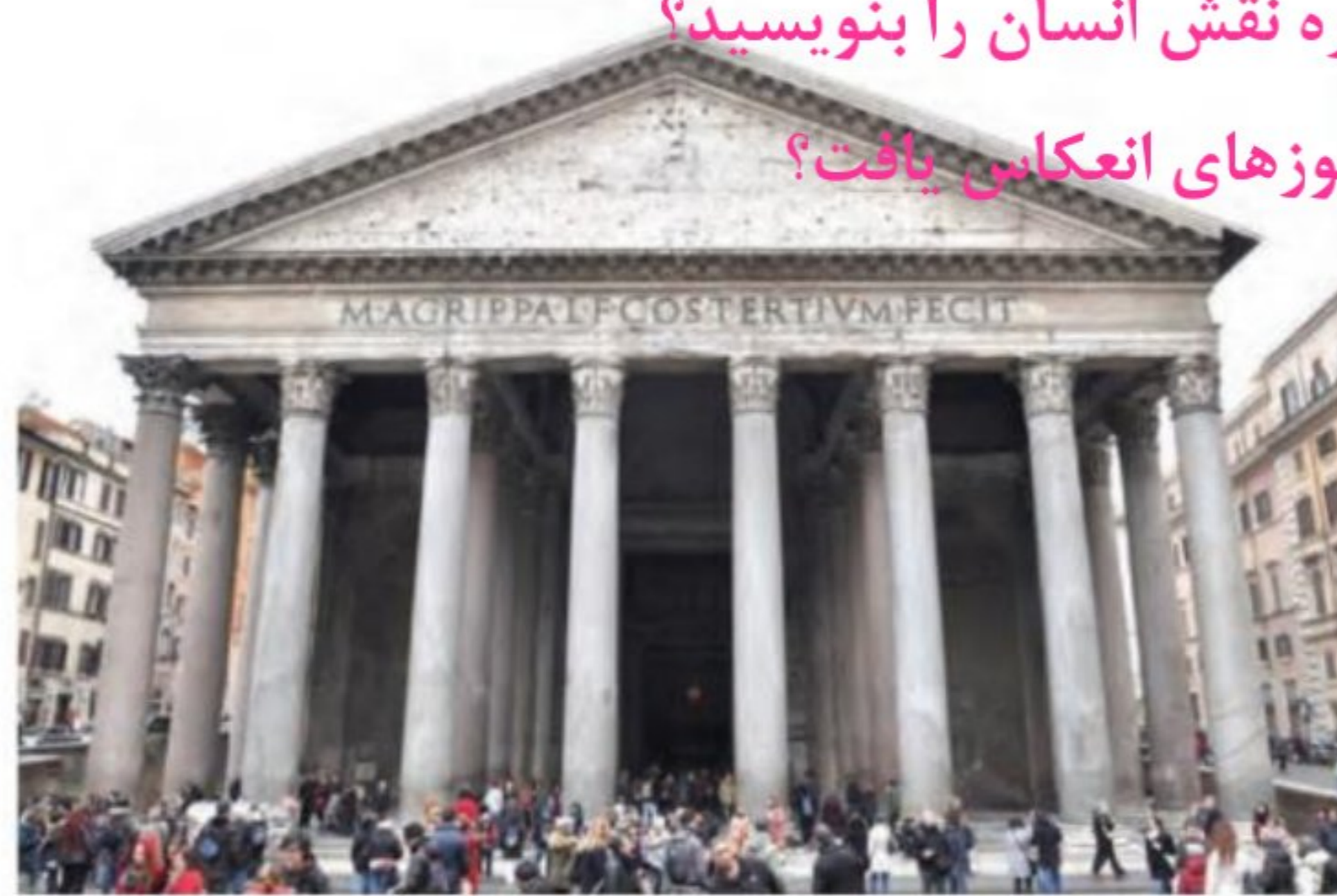
معبد پانتئون رم - از بناهای دوران روم باستان

۱۱- تفکر اومانیستی بیشتر در چه حوزه‌های انعکاس یافت؟