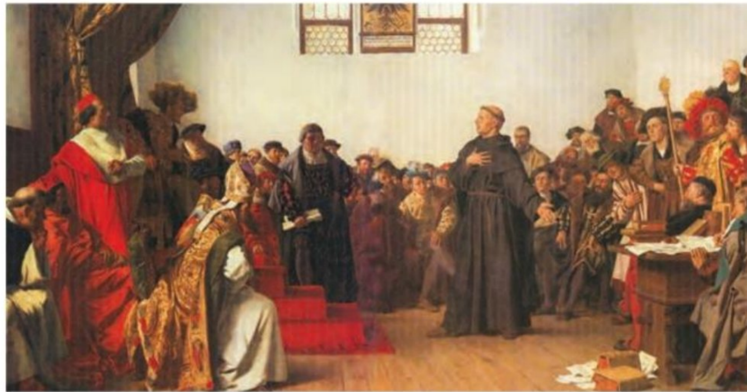
لوتر هنگام دفاع از خود در دادگاه امپراتوری مقدس روم

تأملات گستردهٔ خود در باب آیین مسیح و کتاب مقدس به این نتیجه رسید که برخلاف دیدگاه غالب کلیسایان، آنچه مایهٔ رستگاری انسان می‌شود ایمان است و نه انجام دادن کارهای نیک. لوتر با ابراز این نظر در واقع به جنگ با کلیسا برخاست. وی بعداً بر پایهٔ همین نظر، مسئلهٔ آمرزش گناهان توسط کلیسا را در برابر پرداخت پول و انجام برخی خدمات نقد و نفی کرد. او خدا را پدری مهربان می‌شمرد که بی‌هیچ چشمداشتی گناهان بندگانش را می‌بخشد) (۳۲)