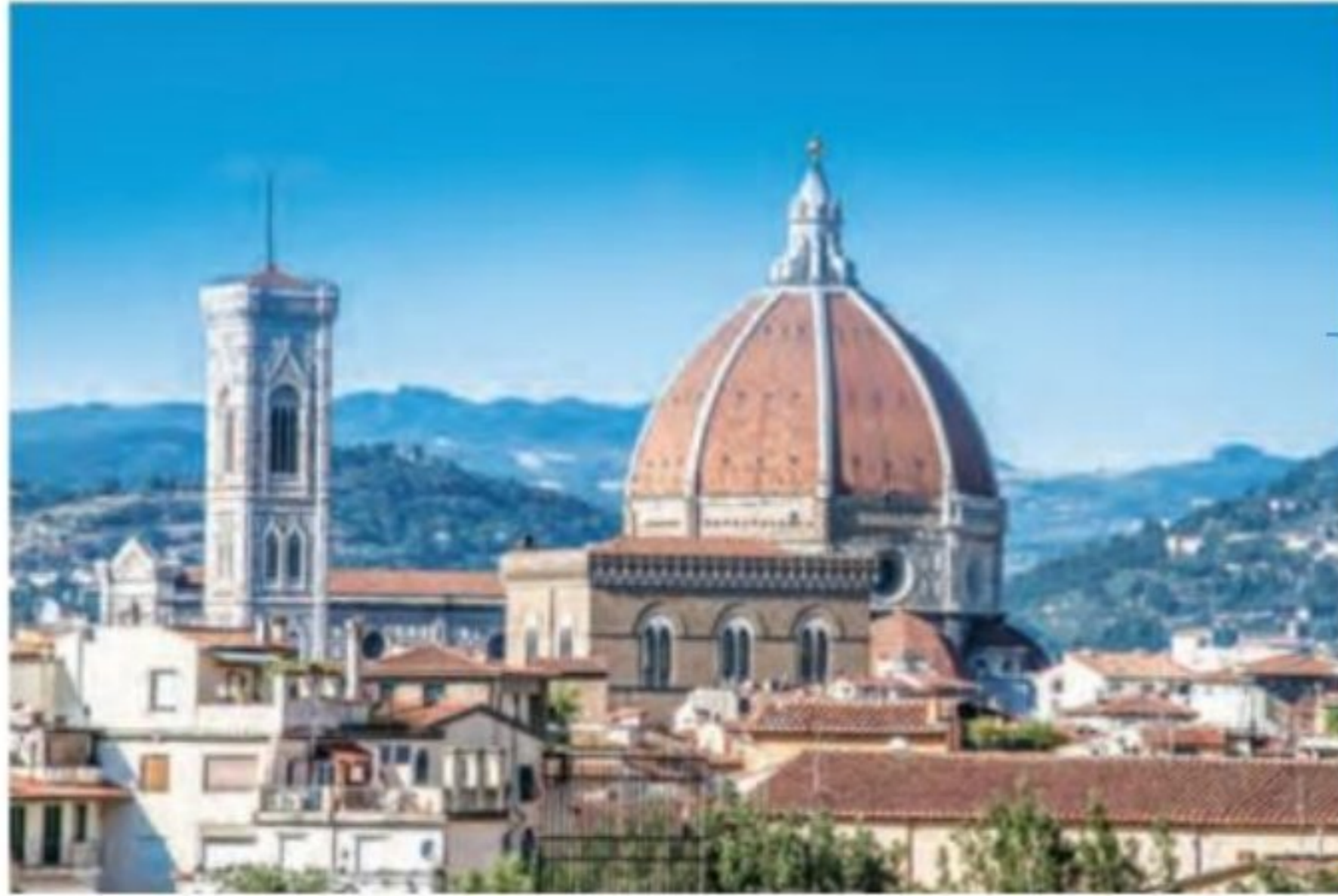
فلورانس ملکه شهرهای اروپا در عصر رنسانس

از سده ۱۱م به تدریج در اروپا شهرنشینی و تجارت، در پیوندی تنگاتنگ با یکدیگر، دوباره رونق گرفت. جنگ های صلیبی تأثیر فراوانی بر رشد شهرها و تجارت به ویژه در مناطق ساحلی اروپا گذاشت. تأثیر این جنگ ها بر رونق و شکوفایی شهرها در ایتالیا بیش از سایر سرزمین های اروپایی بود. شهرهای ایتالیایی در آن زمان، سرآمد شهرهای اروپا در تجارت، بانکداری و صنعت به شمار می رفتند. شهرهای بندری ونیز ۱ ، جنوا ۲ ، پیزا ۳ و پالمو ۴ تجارت در دریای مدیترانه و سواحل غربی اروپا را در اختیار داشتند. فلورانس ۵ ، مرکز داد و ستد کالاهای قیمتی فلزی و چرمی بود و تجارت پارچه را در بخش وسیعی از اروپا به خود اختصاص داده بود.