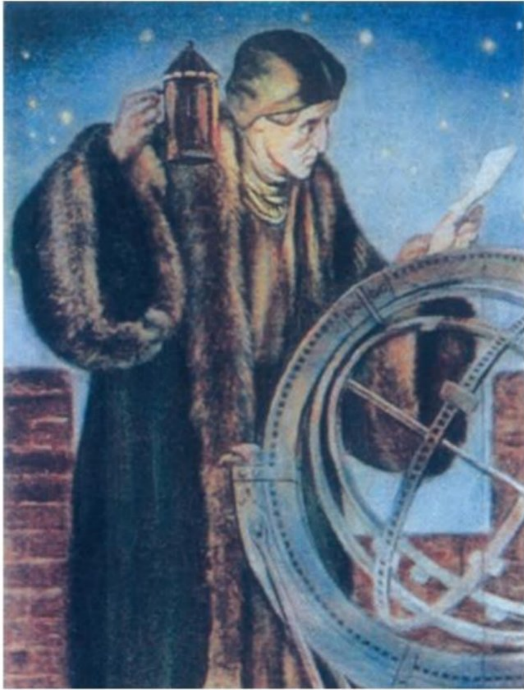
کوپرنیک در حال رصد ستارگان