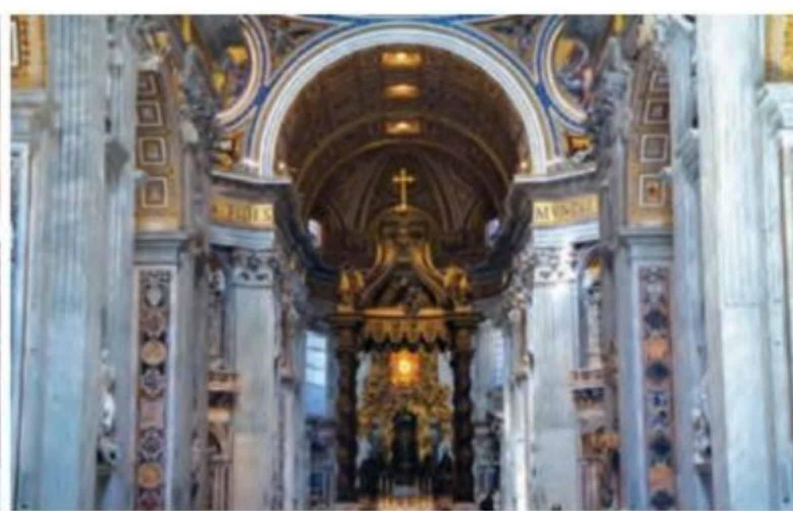
کلیسای سن پیترو در رم

عصر نوزایی، تأثیر ژرفی بر تعلیم و تربیت نهاد. اندیشه انسان‌گرایی برای تعالی و رشد جسمی و روحی انسان اهمیت و ارزش فراوانی قائل بود و انسان‌گرایان بر اصل آموزش‌پذیری انسان و شکوفایی استعدادها و توانمندی‌های بالقوه او از طریق آموزش به شدت تأکید می‌کردند. دانشمندان عصر رنسانس با مطالعه و بررسی آثار و نوشته‌های دوره باستان، رساله‌های متعددی درباره تعلیم ۱۴