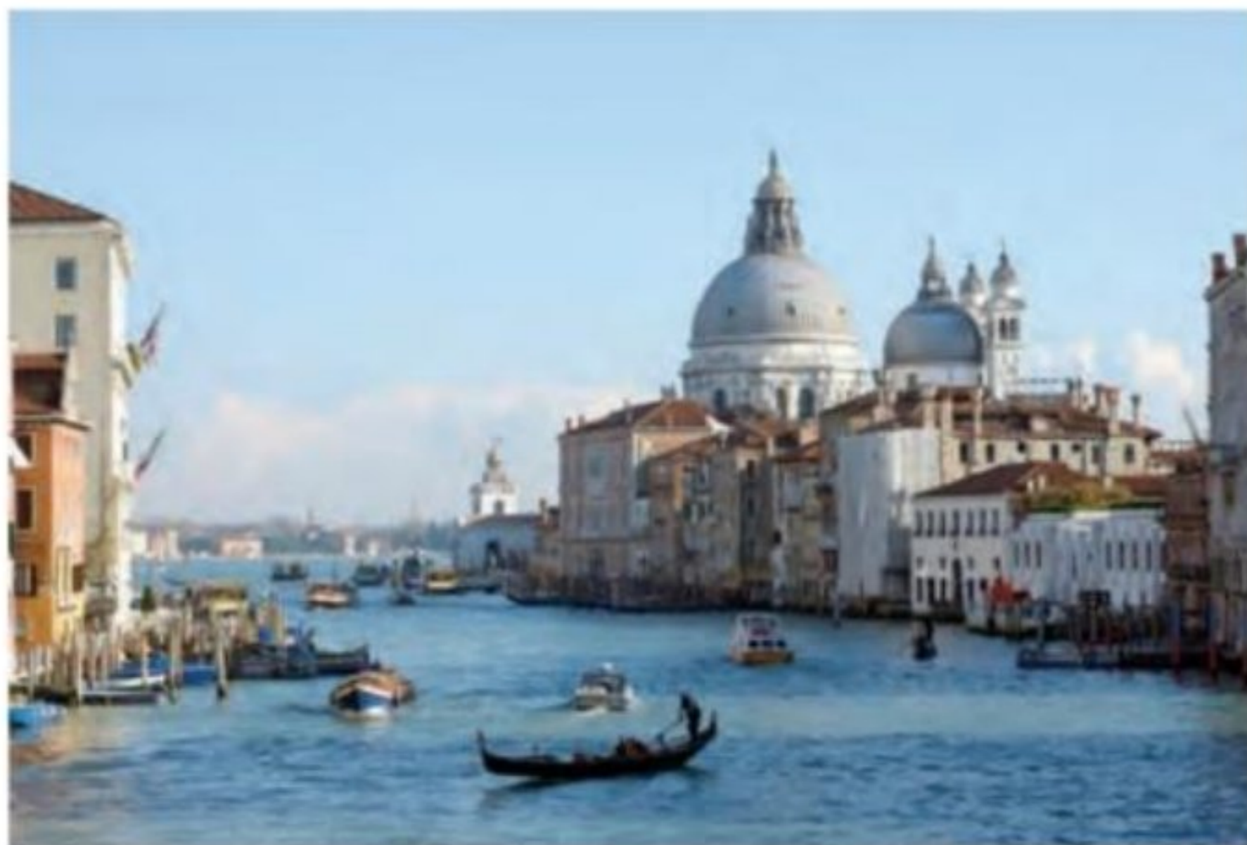
ونیز - ایتالیا

از سده ۱۱م به تدریج در اروپا شهرنشینی و تجارت، در پیوندی تنگاتنگ با یکدیگر، دوباره رونق گرفت. جنگ های صلیبی تأثیر فراوانی بر رشد شهرها و تجارت به ویژه در مناطق ساحلی اروپا گذاشت. تأثیر این جنگ ها بر رونق و شکوفایی شهرها در ایتالیا بیش از سایر سرزمین های اروپایی بود. شهرهای ایتالیایی در آن زمان، سرآمد شهرهای اروپا در تجارت، بانکداری و صنعت به شمار می رفتند. شهرهای بندری ونیز ۱ ، جنوا ۲ ، پیزا ۳ و پالمو ۴ تجارت در دریای مدیترانه و سواحل غربی اروپا را در اختیار داشتند. فلورانس ۵ ، مرکز داد و ستد کالاهای قیمتی فلزی و چرمی بود و تجارت پارچه را در بخش وسیعی از اروپا به خود اختصاص داده بود.