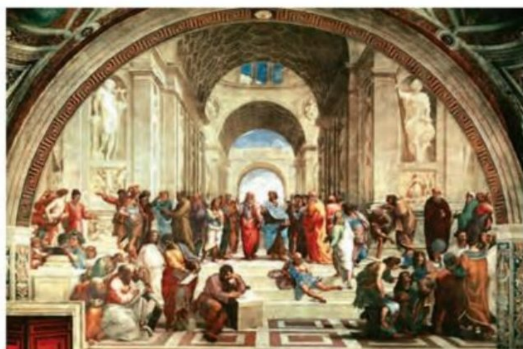
تابلوی «مدرسه آتن» اثر رافائل

۱۳) هنر رنسانس با ظهور سه هنرمند مشهور ایتالیایی یعنی لئوناردو داوینچی ۱ ، رافائل ۲ و میکل آنژ ۳ به اوج پیشرفت و شکوفایی رسید. آنان در زمره بزرگ‌ترین نوابع تاریخ هنر جهان به شمار می‌روند. داوینچی دارای هوش و نبوغ سرشاری بود. او علاوه بر آنکه در نقاشی، مجسمه‌سازی و معماری سرآمد هنرمندان به شمار می‌رفت، در علوم مختلف از قبیل ریاضی، مهندسی و زمین‌شناسی نیز سررشته داشت. مشهورترین اثر نقاشی او شام آخر و مونالیزا ۴ یا لبخند ژکونده ۵ است. ۱۳