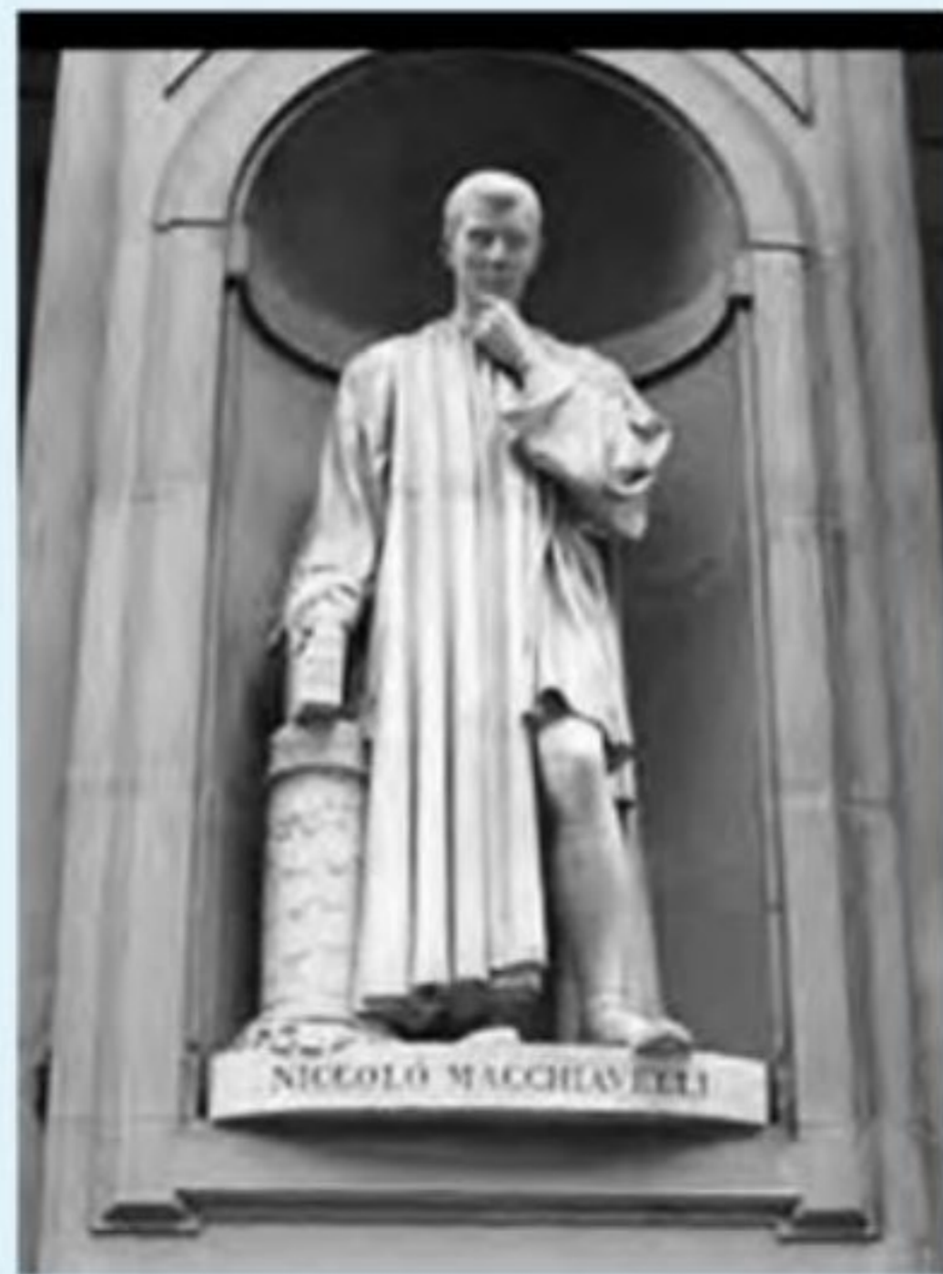
تندیس نیکولو ماکیاوولی