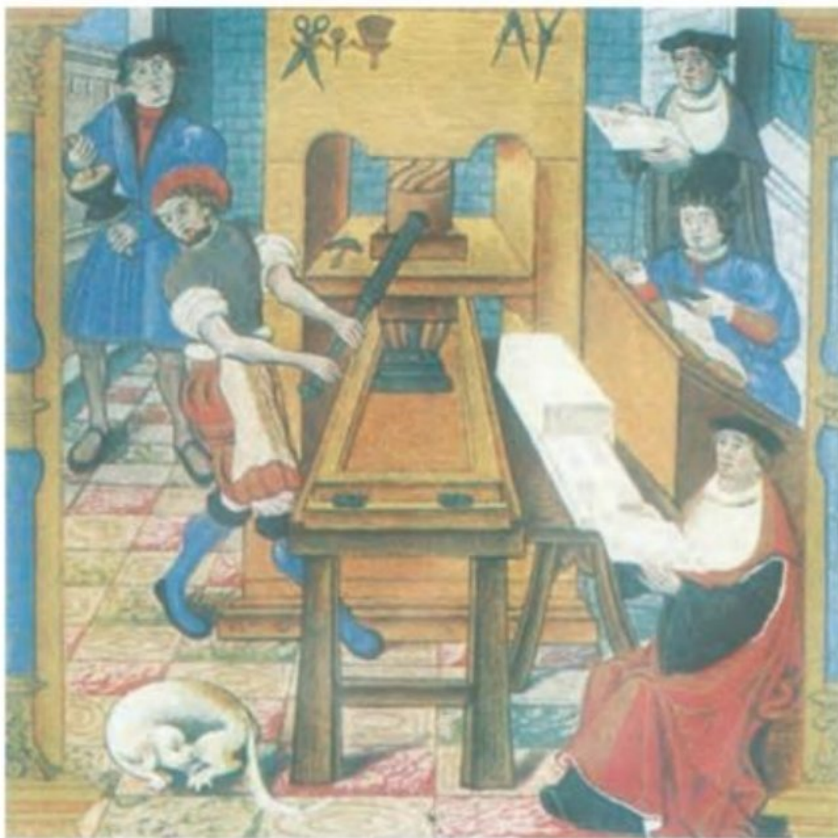
کارگاه چاپ اواخر قرن ۱۵م

۱۷) در اواسط قرن شانزدهم نیکلاس کوپرنیک ۱ در رساله گردش اجرام سماوی، نظریه چرخش زمین به دور خورشید را مطرح کرد. پیش از این، براساس نظریه زمین مرکزی ۲ بطلمیوس، کلیسا و دانشمندان بر این باور بودند که زمین ثابت و خورشید بر گرد آن می‌چرخد. با مطالعات برخی از دانشمندان از جمله کپلر ۳ نظریه کوپرنیک اثبات شد. اختراع تلسکوپ توسط گالیله ۴ ، استاد دانشگاه پیزا، فرضیه‌های کوپرنیک را بیش از پیش تأیید کرد. با گسترش روابط اروپاییان با جهان اسلام از دوره جنگ‌های صلیبی به بعد، پزشکی و داروسازی در اروپا نیز دچار تحول شد. ویلیام هاروی ۵ در زمینه کارکرد قلب و چگونگی گردش خون به موفقیت‌های مهمی دست یافت. در فیزیک و ریاضیات نیز پیشرفت‌هایی صورت گرفت و در قرن ۱۷م با وسعت بیشتری ادامه یافت. در زمینه جغرافیا و نقشه‌برداری نیز اروپاییان از تجربیات مسلمانان بهره‌های فراوانی بردند و به پیشرفت‌های چشمگیری نایل آمدند.