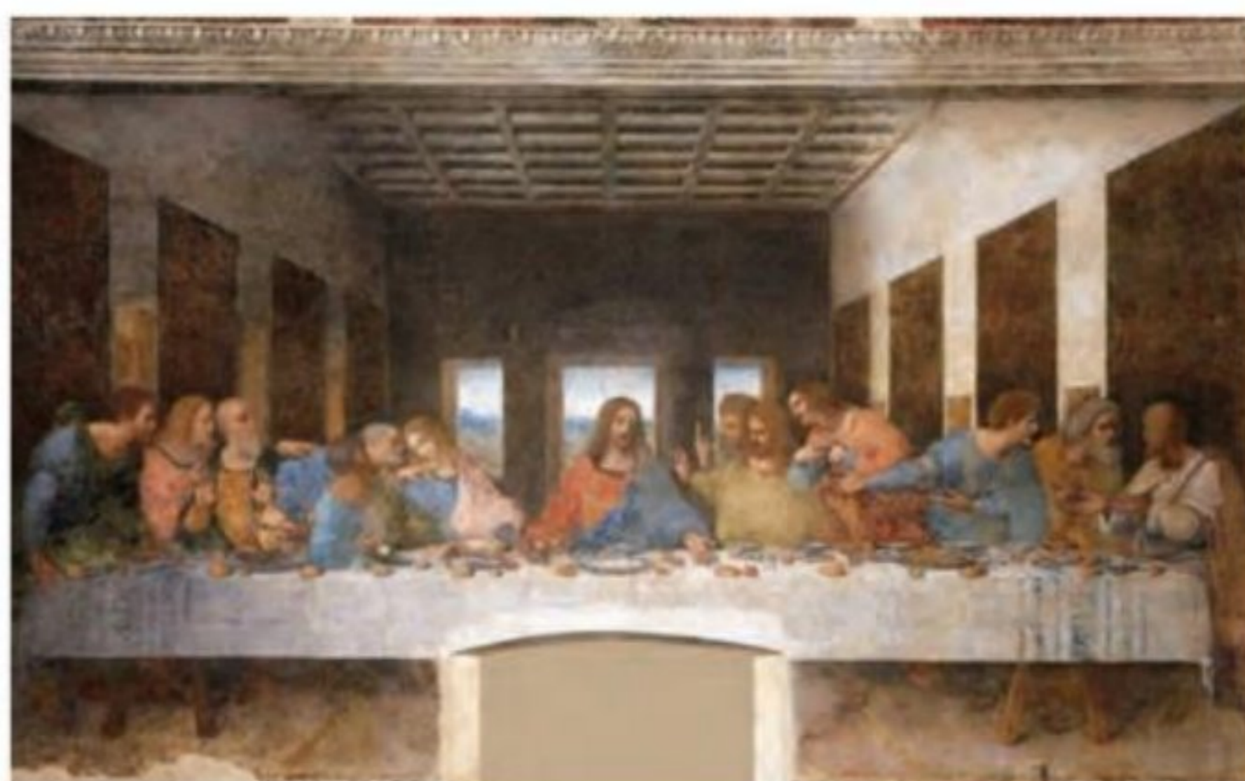
تابلوی «شام آخر» اثر داوینچی

عصر نوزایی، در معماری نیز شیوه نوینی به وجود آورد. معماران عصر رنسانس ساختمان‌های رم باستان را سرمشق خود قرار دادند و الگوی معماری بناهای باستانی را در ساختن کاخ‌ها، کلیساها و نمازخانه‌ها به کار بستند. کاخ‌ها و کلیساهایی که در عصر رنسانس در شهرهای مختلف ایتالیا به ویژه رم، فلورانس و ونیز ساخته شد، بیانگر اوج و شکوه معماری عصر رنسانس است.