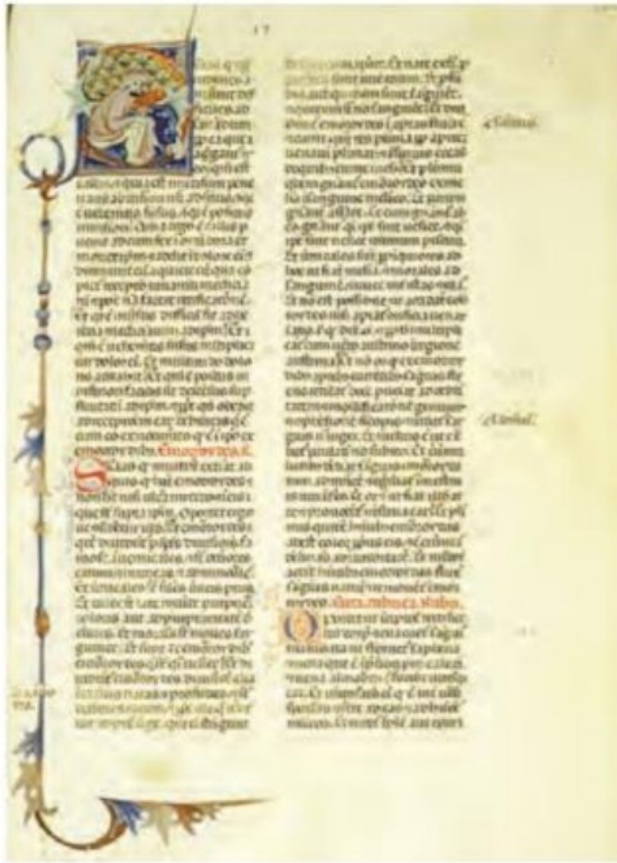
برگی از کتاب قانون ابن سینا که در قرن ۱۴م به زبان لاتین ترجمه شده است.