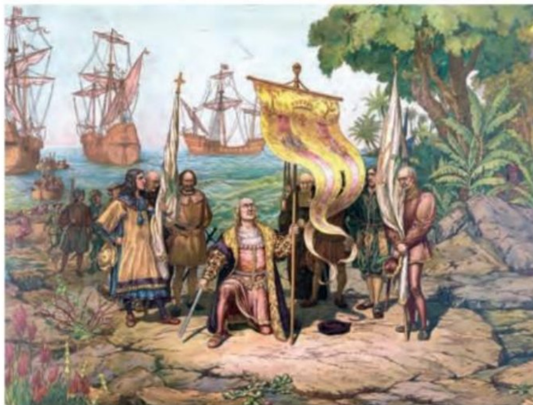
نگاره کریستف کلمب هنگام ورود به دنیای جدید

۲۲- افزایش اطلاعات جغرافیایی و توسعه مهارت دریانوردی اروپاییان در دوران پس از جنگ‌های صلیبی و اواخر قرون وسطا نیز تأثیر شایانی در کشف سرزمین‌ها و راه‌های جدید داشت. اروپاییان تا نیمه سده ۱۵م فنون نقشه‌کشی را تکامل بخشیدند و نقشه‌های نسبتاً دقیقی از دنیای شناخته شده آن روزگار طراحی و ترسیم کردند. به علاوه، اروپاییان در ساختن کشتی و بهره‌گیری از تجهیزات دریانوردی مانند قطب‌نما که چینی‌ها اختراع کرده بودند و أسطرلاب (وسیله‌ای که موقعیت اجرام آسمانی را معلوم می‌کرد)، به پیشرفت فوق‌العاده‌ای رسیدند. (۲۲)