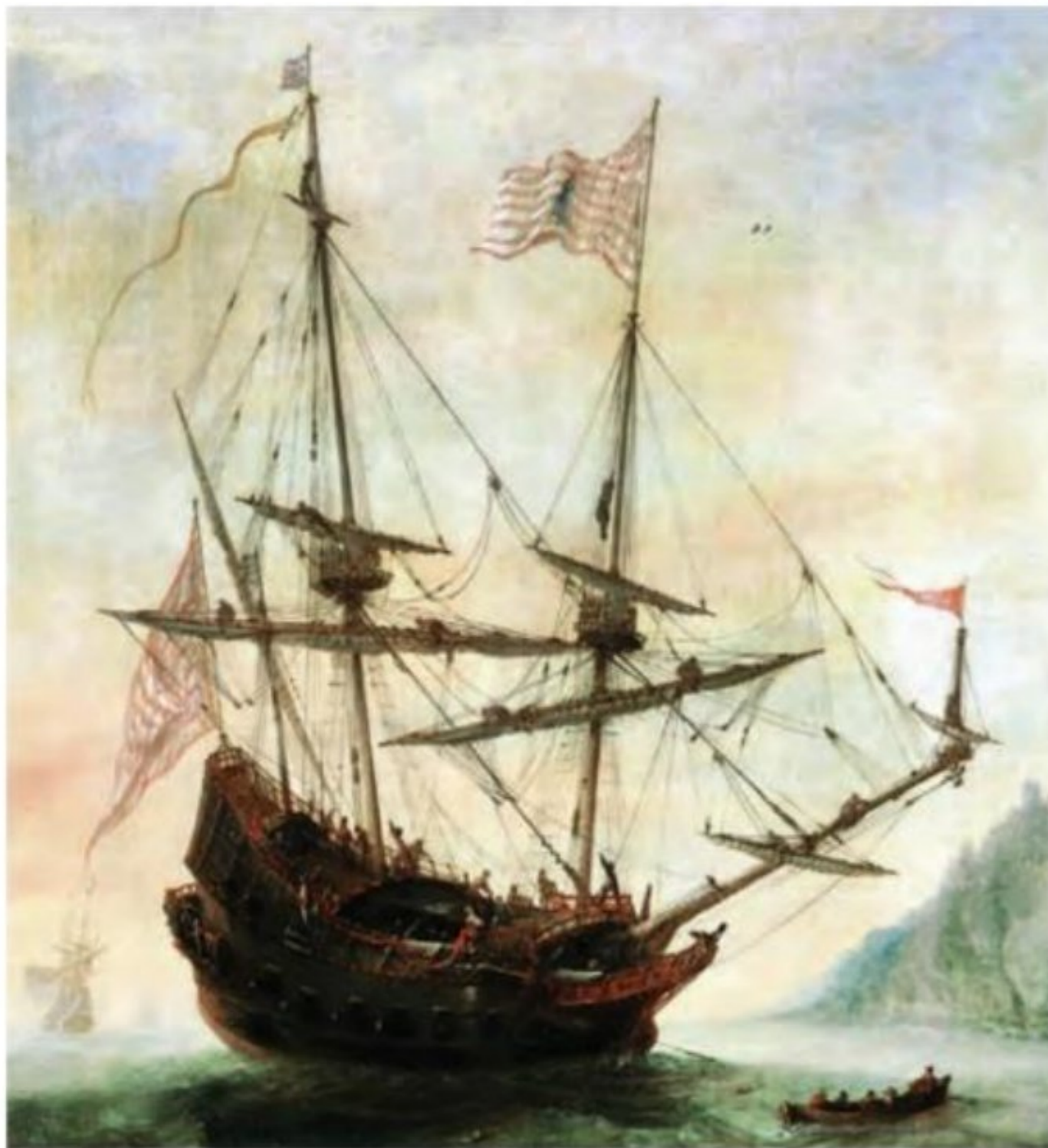
نمونه‌ای از کشتی‌های اروپایی در سده ۱۵ و ۱۶م