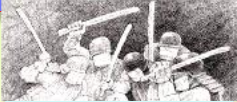
ماجرای به چوب بستن بازرگانان بود