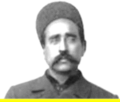
ستارخان و باقرخان