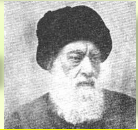
آیت الله طباطبایی

به نشانه ی اعتراض از تهران به ری مهاجرت کردند و در حرم حضرت شاه عبدالعظیم بست نشستند