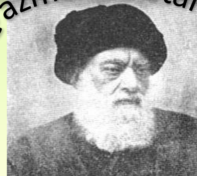
آیت الله سید محمد طباطبایی