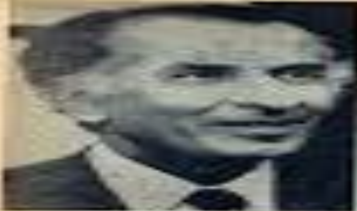
اسامی اعضای دولت جدید