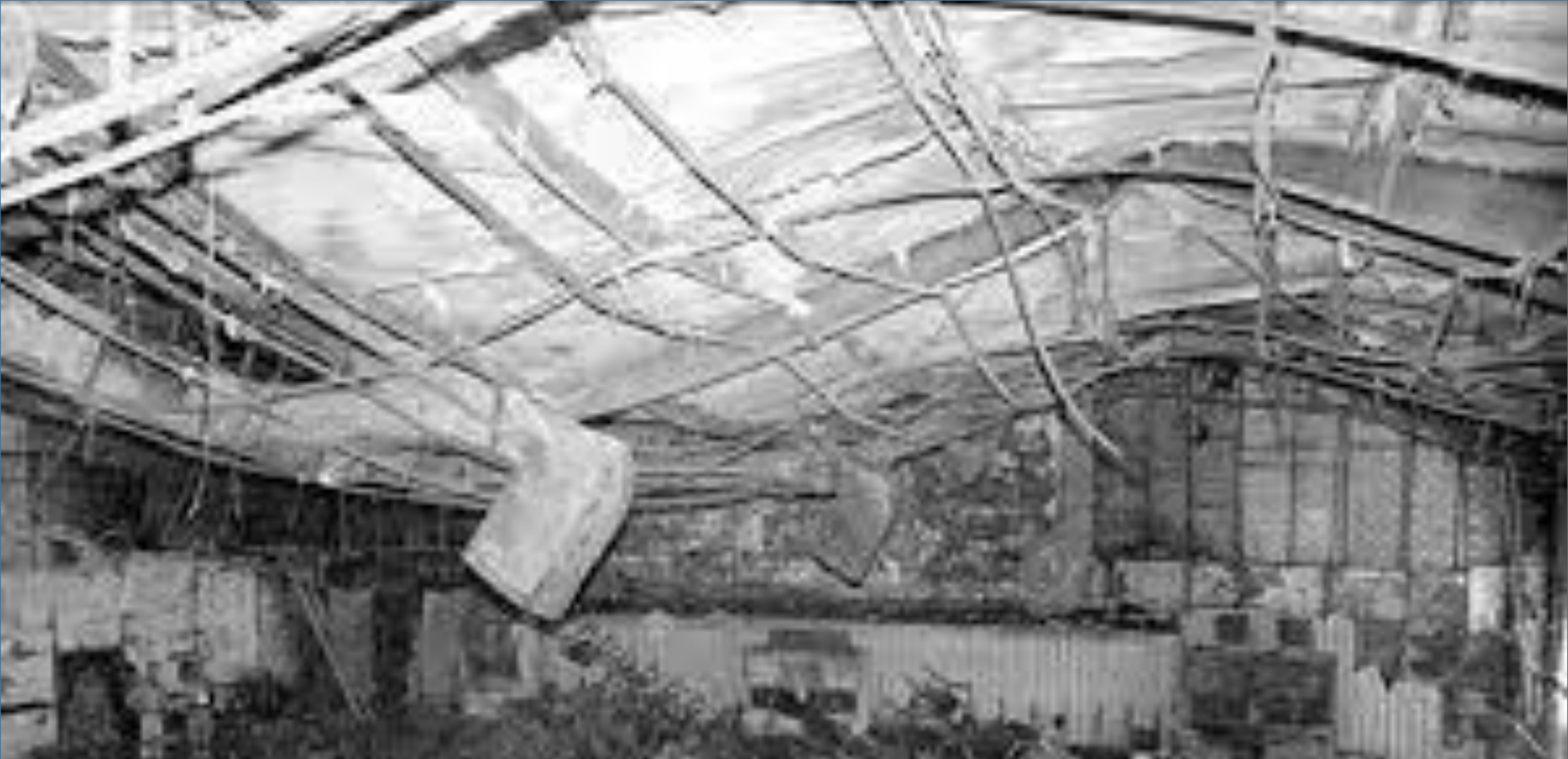
سوختن بیش از ۴۷۷ نفر در حادثه سینما رکس آبادان