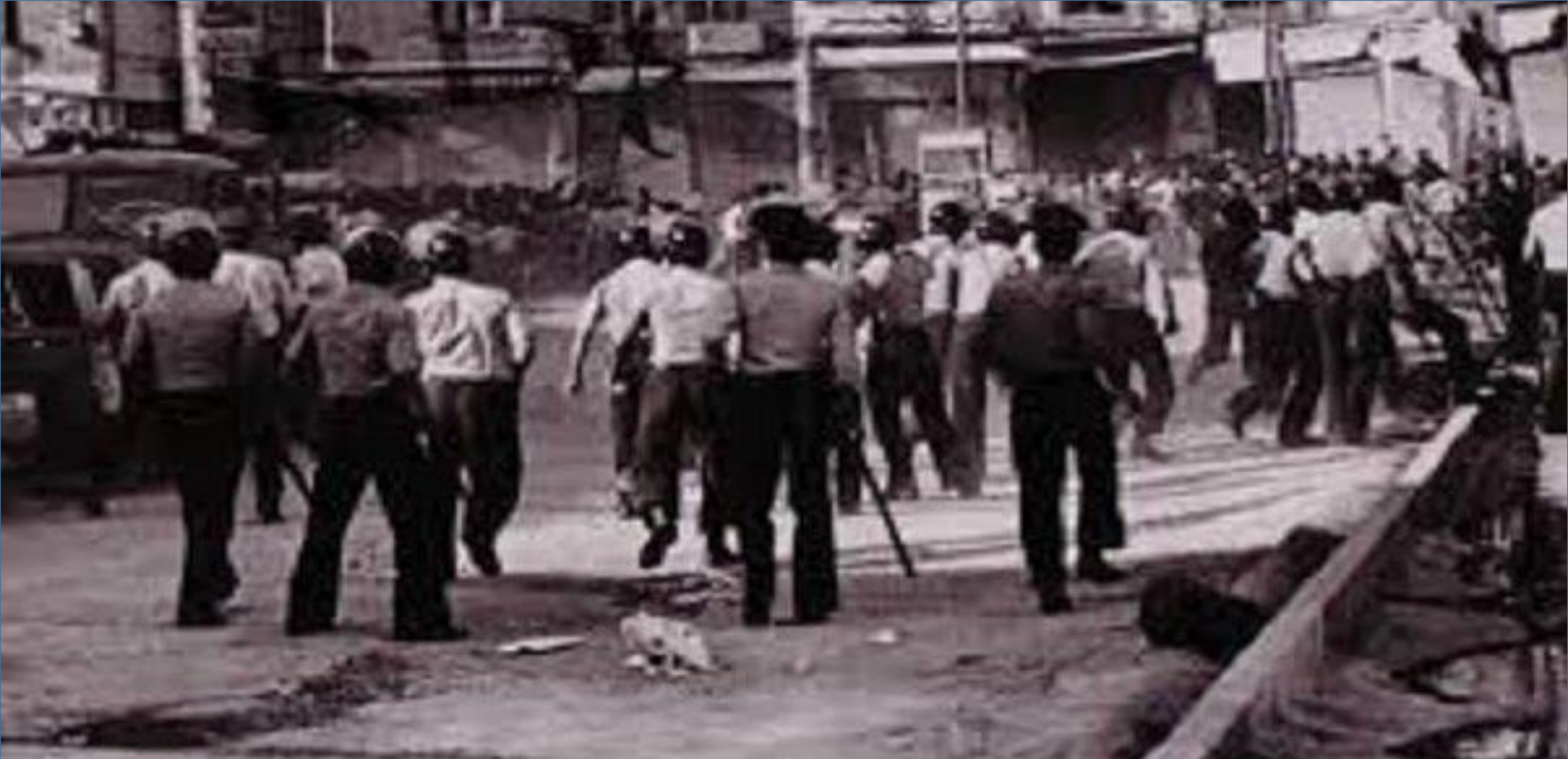
قیام مردم تبریز در چهلّم شهدای قم ( ۲۹ بهمن ۱۳۵۶ )