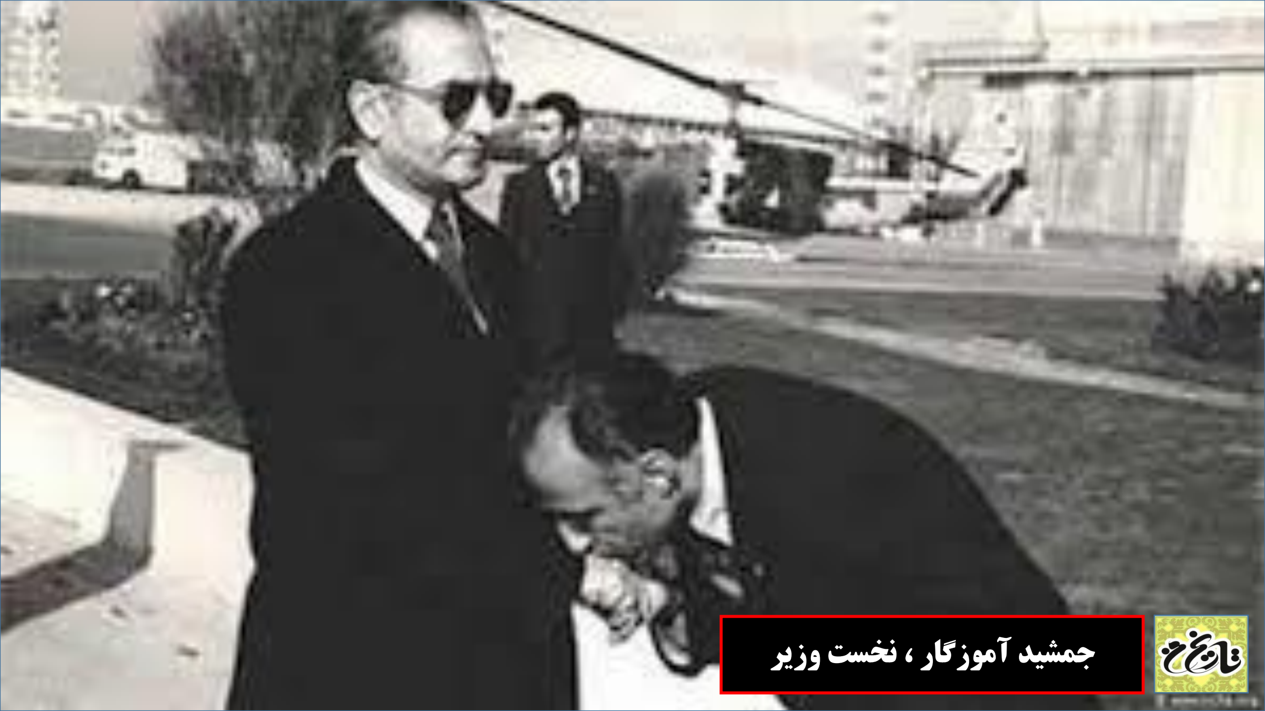
جمشید آموزگار ، نخست وزیر