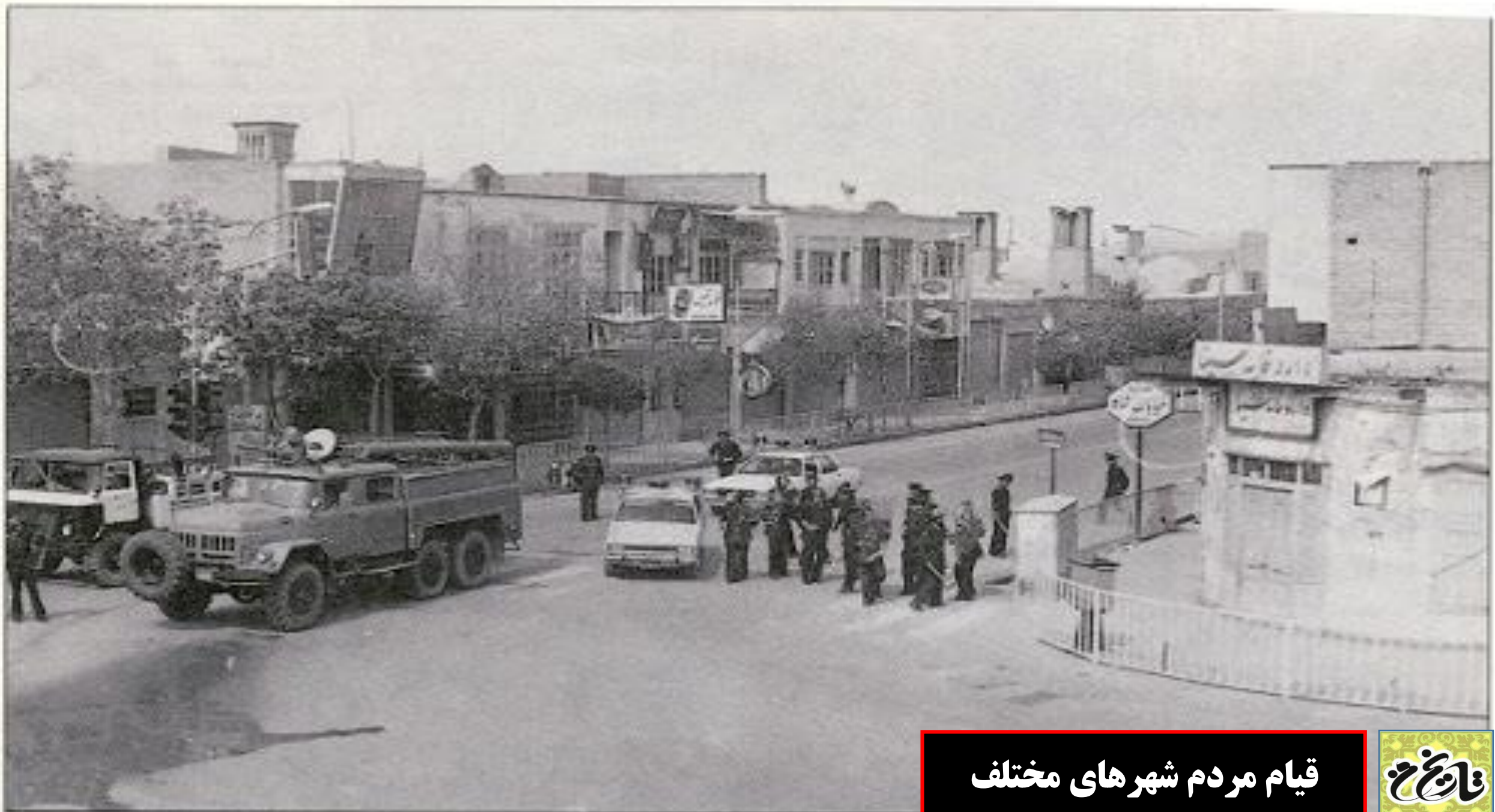
قیام مردم شهرهای مختلف