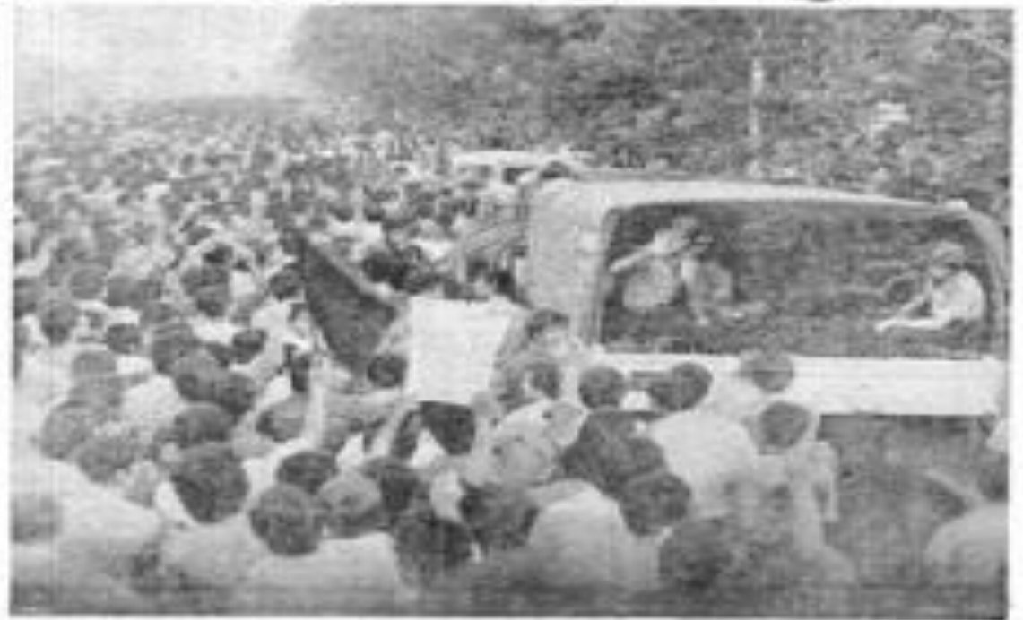
در تظاهرات دیروز، رهبران مذهبی و کثرتی از مردم در خیابانهای تهران شرکت کردند.

شاهنشاهی دعا میکنیم مسلمانان در کنار یکدیگر باشند در همه جهدهای، بدر نفرت و خشونت می باشد!