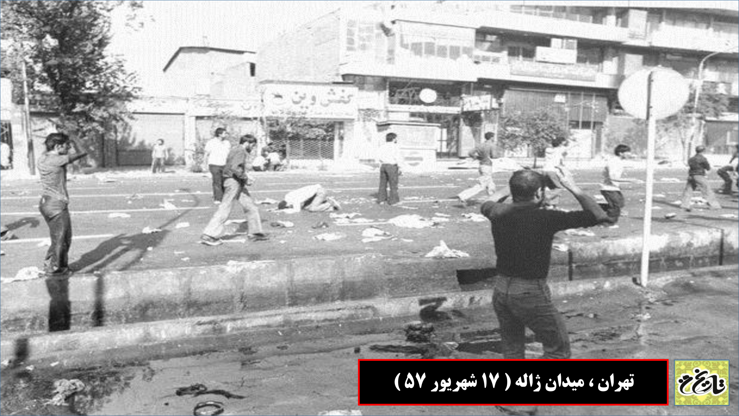
تهران ، میدان ژاله ( ۱۷ شهریور ۵۷ )