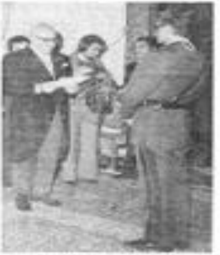
تظاهرات دیروز در تهران و سایر شهرها.

شاهنشاهی دعا میکنیم مسلمانان در کنار یکدیگر باشند در همه جهدهای، بدر نفرت و خشونت می باشد!