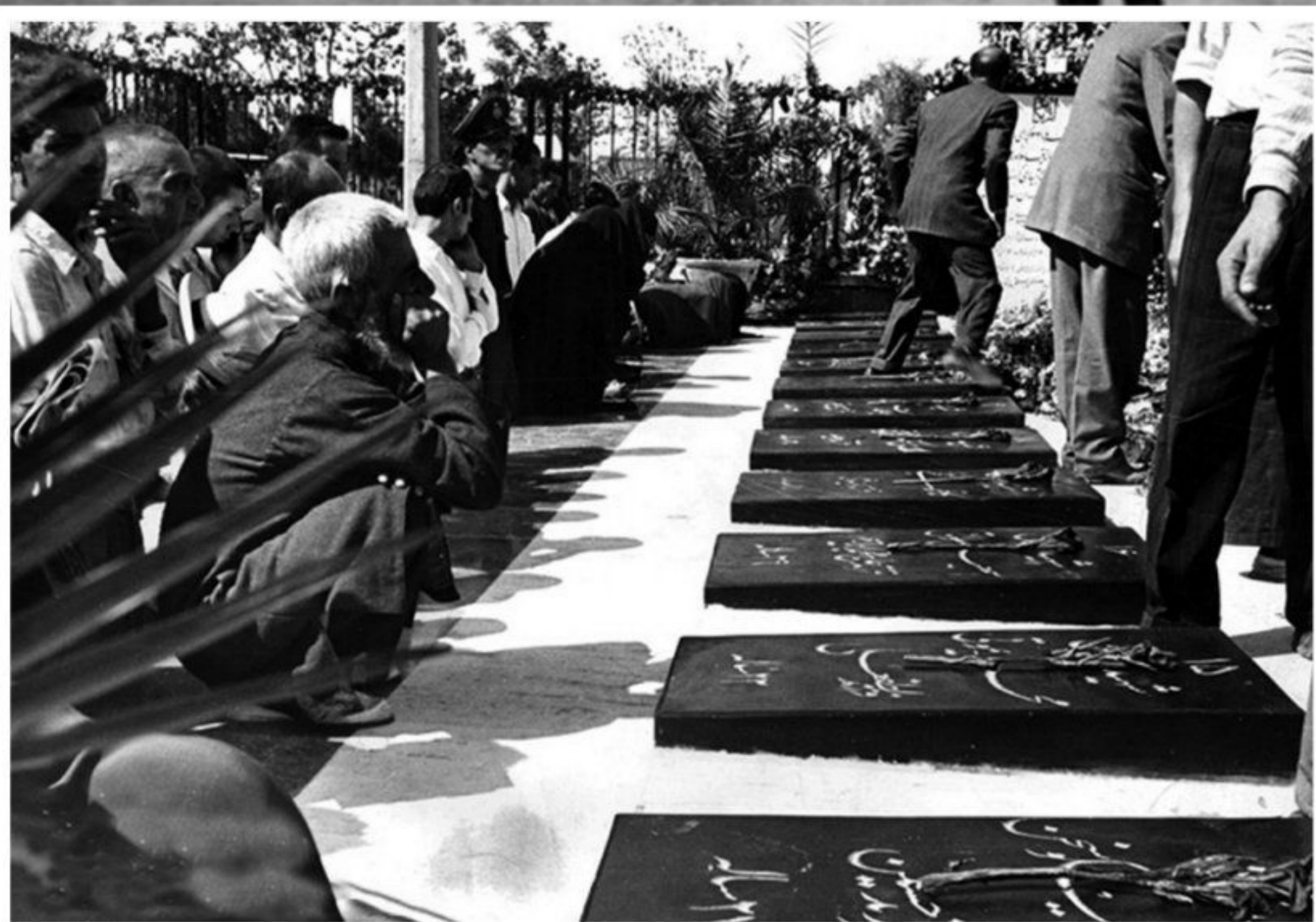
مزار شهدای قیام ۳۰ تیر در گورستان ابن بابویه