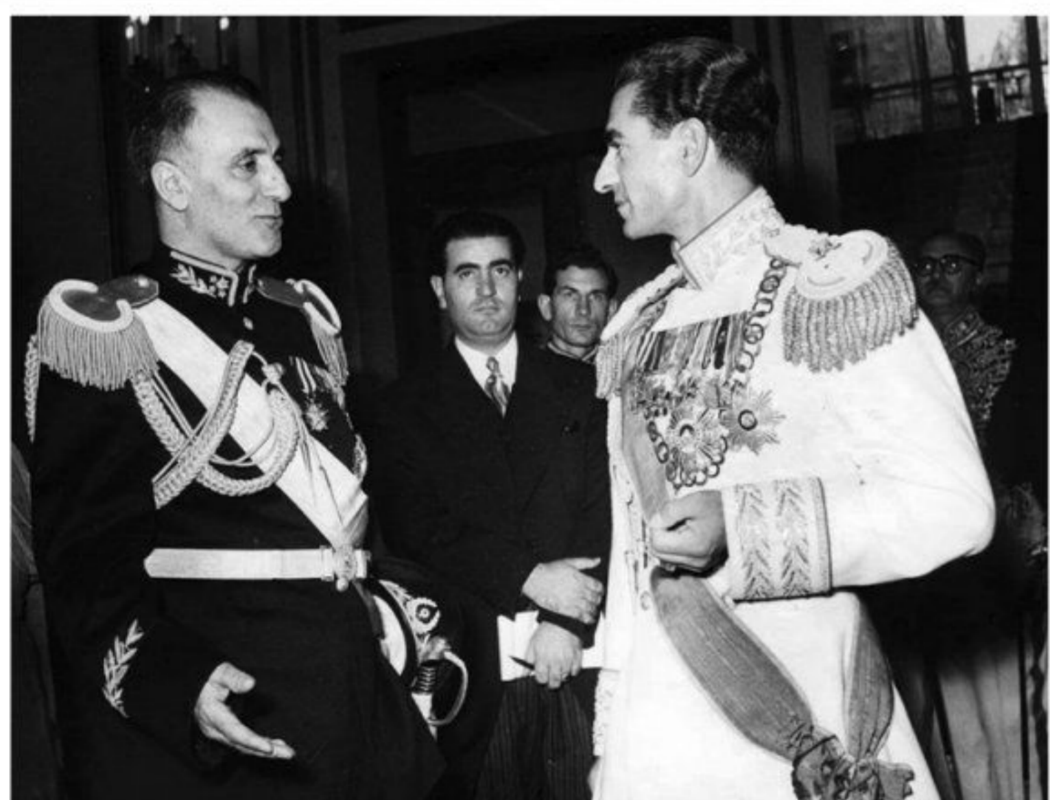
شاه و سرلشکر زاهدی، فرمانده کودتاجیان