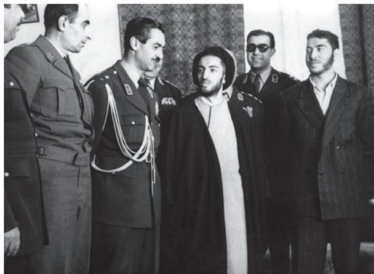
شهیدان نواب صفوی و سید محمد واحدی لحظاتی پس از بازداشت در حضور سرلشکر تیمور بختیار، فرماندار نظامی تهران