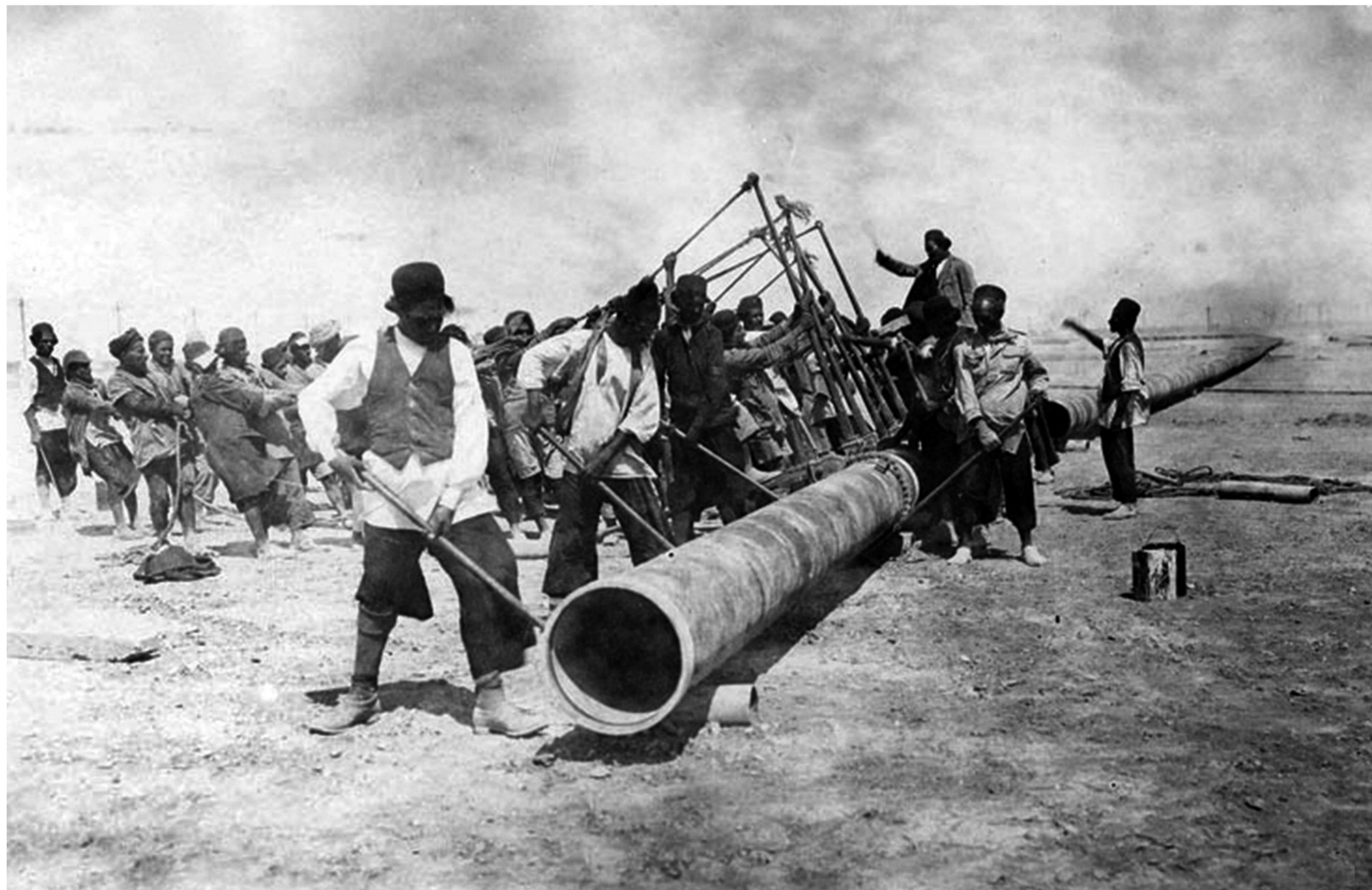
کارگران شرکت نفت هنگام احداث خط لوله نفت در خوزستان

1) به نام «شرکت نفت پارس و انگلیس» ۱ تشکیل شد. این شرکت چاه‌های زیادی در منطقه مسجد سلیمان حفر کرد و خط لوله‌ای هم از آنجا تا آبادان کشید ۲ دولت انگلستان پس از آنکه از ارزش منابع عظیم نفت ایران و اهمیت آن برای نیروی دریایی خود آگاه شد، ۵۱ درصد سهام شرکت نفت پارس و انگلیس را خریداری کرد و حق نظارت کامل بر آن شرکت را به دست آورد (۱۹۱۴م). بدین گونه این شرکت به بازوی پر قدرت اقتصادی و سیاسی دولت انگلیس تبدیل شد و زمینه اعمال نفوذ و مداخله بیشتر انگلیسی‌ها را در ایران فراهم آورد ۲