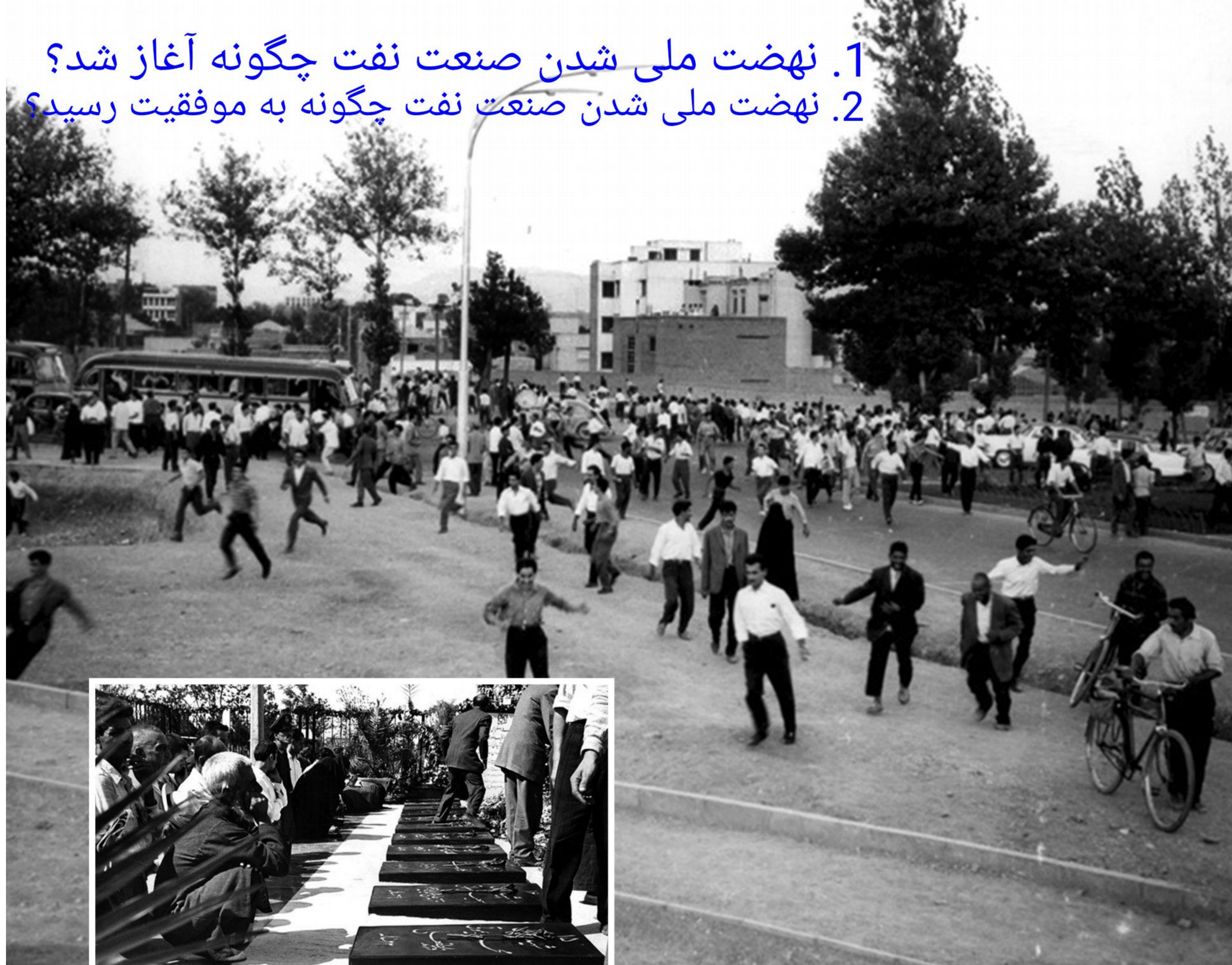
صحنه ای از قیام مردم تهران در ۳۰ تیر ۱۳۳۱