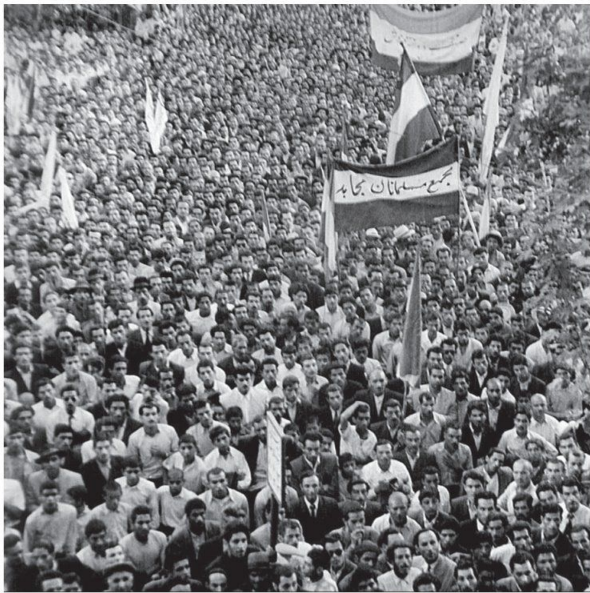
صحنه‌ای از تظاهرات مردم تهران در پشتیبانی از ملی شدن صنعت نفت ایران