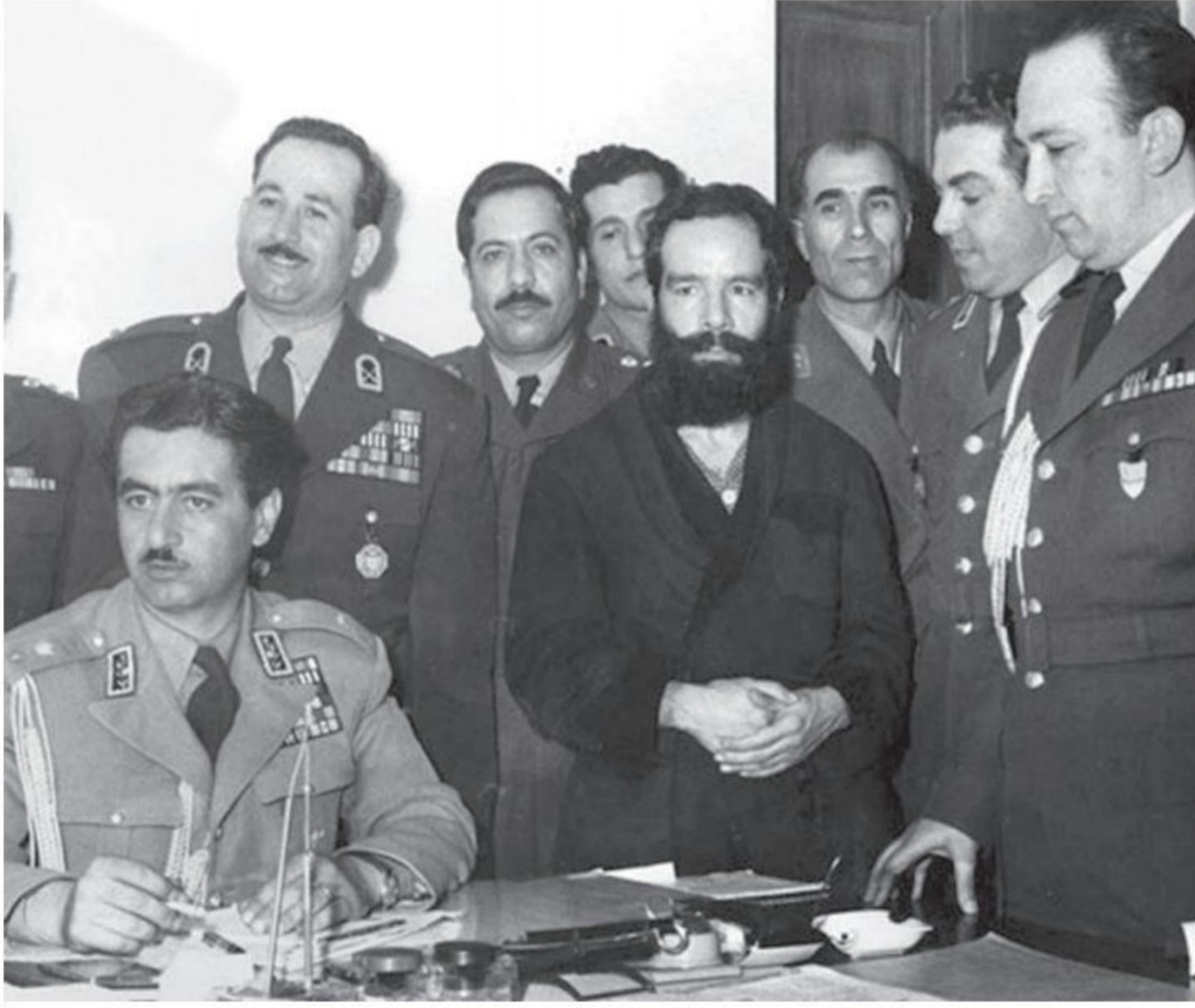
دکتر سید حسین فاطمی، وزیر خارجه و یار نزدیک دکتر مصدق (ردیف جلو نفر وسط) در فرمانداری نظامی تهران - فاطمی چند ماه پس از کودتا دستگیر و پس از محاکمه تیرباران شد.

1) پس از موفقیت کودتا، زاهدی نخست‌وزیر شد و اعلام حکومت نظامی کرد. دکتر مصدق و تعدادی از همکاران و یاران نزدیکش دستگیر و سپس محاکمه شدند. احزاب و گروه‌های سیاسی و روزنامه‌های مخالف، غیرقانونی اعلام شدند و منحل گردیدند. 2) یک سال و اندی پس از کودتای 28 مرداد، حکومت پهلوی با انگلستان و آمریکا درباره مسئله نفت به توافق رسید و به موجب قراردادی، تولید و فروش نفت ایران را به کنسرسیومی ۱ از شرکت‌های نفتی انگلیسی، آمریکایی، هلندی و فرانسوی واگذار کرد. بر اساس این قرارداد مقرر شد که کنسرسیوم به مدت 25 سال نفت ایران را استخراج کند و به فروش برساند و نیمی از سود خالص را برای خود برداشته و در مقابل، نیمی از سود خالص خود را به کشور ما پردازد. 2