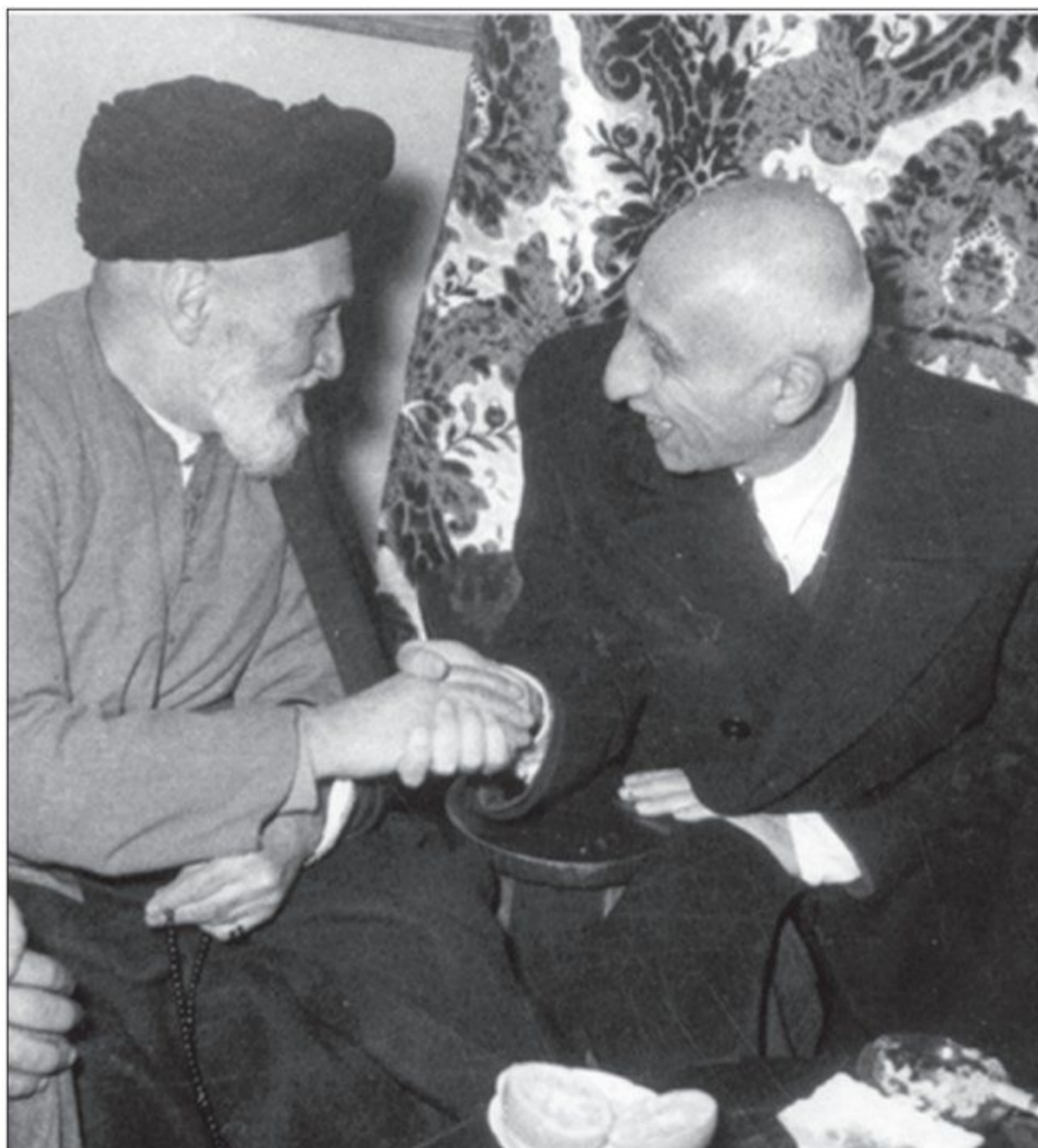
دکتر مصدق و آیت الله کاشانی

1) نمایندگان مخالف قرارداد الحاقی در مجلس شانزدهم، ضمن مخالفت با این قرارداد، طرح ملی شدن صنعت نفت ایران را پیشنهاد کردند 1 . (این طرح با استقبال گسترده شخصیت‌ها، قشرها و گروه‌های مختلف سیاسی، ملی و مذهبی روبه‌رو شد و بسیاری از مطبوعات نیز از آن پشتیبانی کردند. تظاهرات و اعتصاب‌هایی هم در مخالفت با قرارداد الحاقی و طرف‌داری از ملی شدن صنعت نفت برپا شد. آیت‌الله سید ابوالقاسم کاشانی، که سابقه طولانی در مبارزه با استعمار انگلستان داشت، با جدیت تمام از جنبش ملی شدن صنعت نفت حمایت کرد. وی در اعلامیه‌ای، مبارزه برای ملی شدن نفت را تکلیف دینی و وطنی ملت ایران برشمرد و تعدادی از علما نیز نظر او را تأیید کردند 2 .)