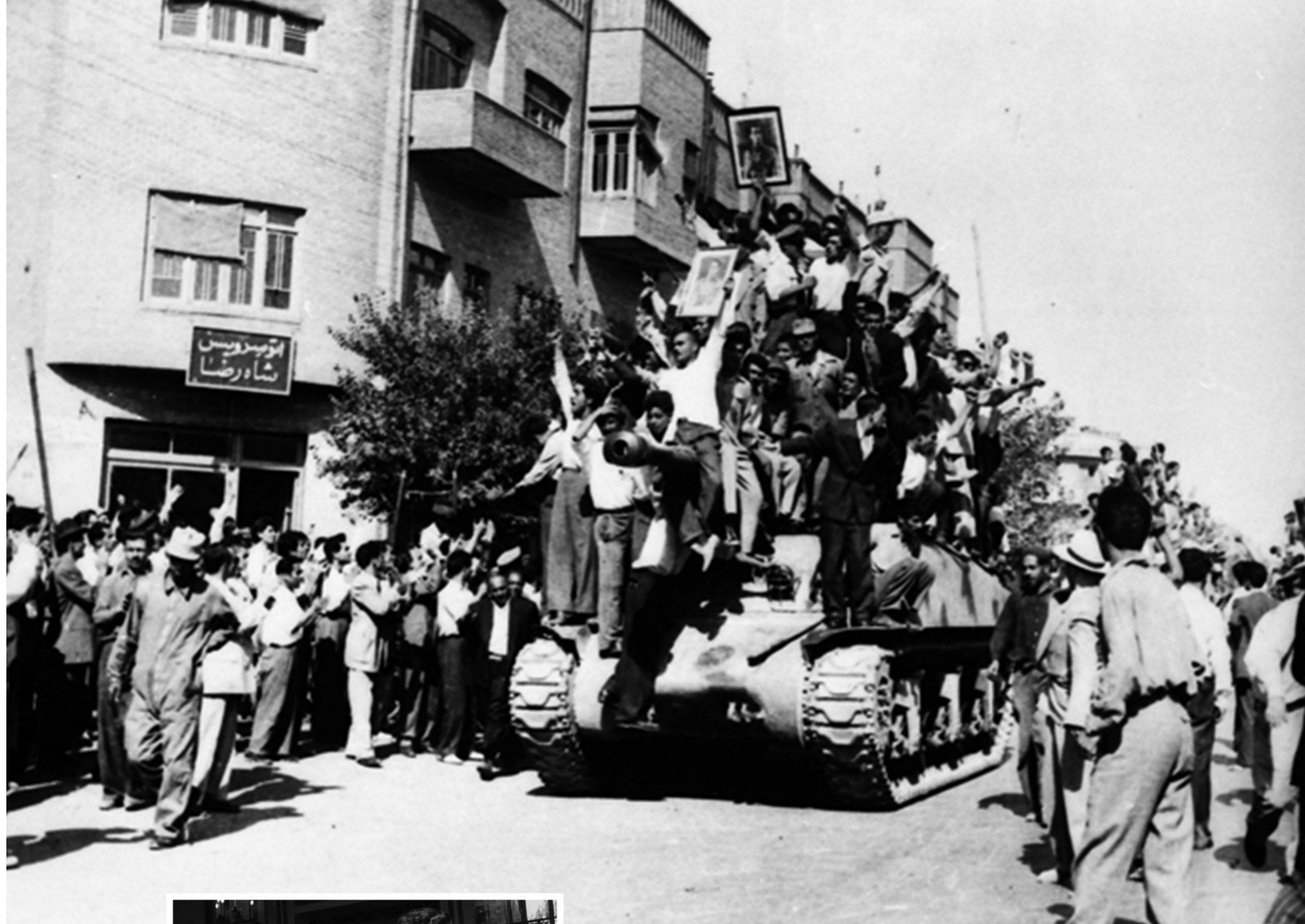
کودتاجیان در خیابان‌های تهران - ۲۸ مرداد ۱۳۳۲