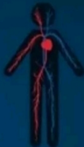
سیستم گردش خون