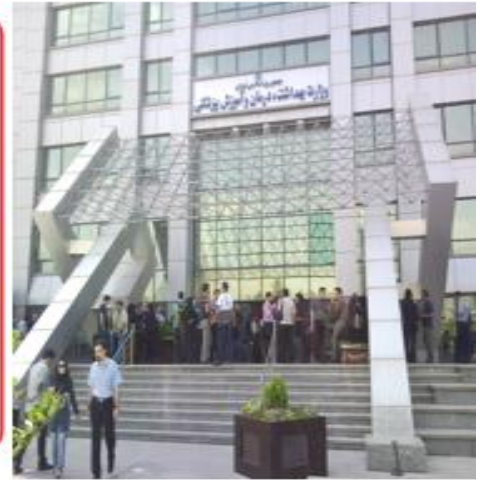
تعداد وزارتخانه های کشور ما نوزده وزارتخانه است.