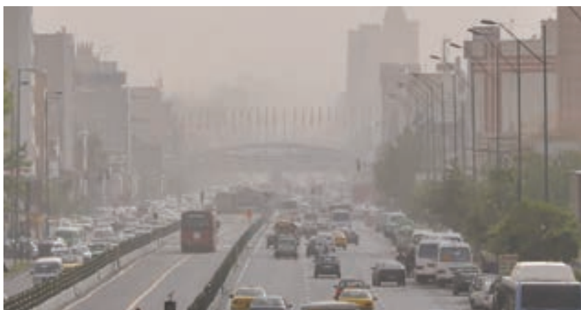
استان تهران - شهر تهران

با دقت به تصویر هوای آلوده نگاه کنید. چرا هوا آلوده شده است؟ چگونه می‌توانیم هوایی سالم داشته باشیم؟