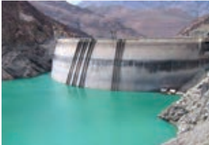
آب پشت سد