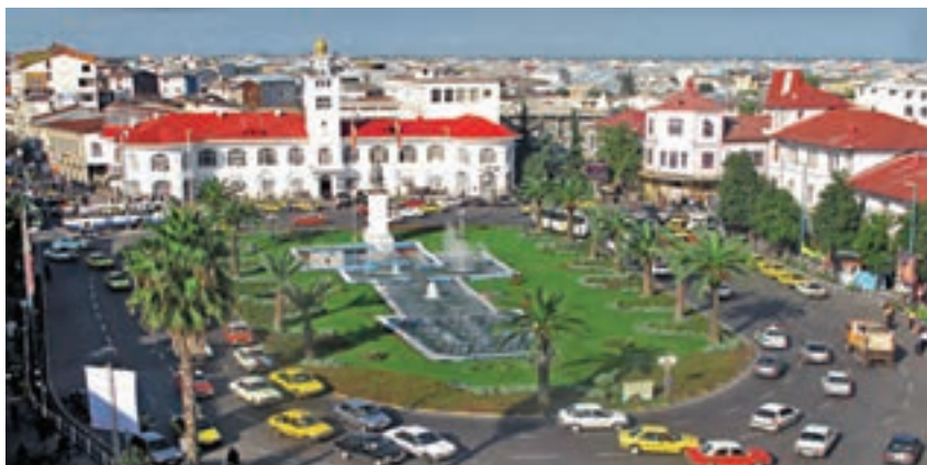
استان گیلان - شهر رشت