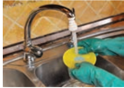
آب در خانه

هر وقت که به آب نیاز داریم، شیر آب را باز می‌کنیم. آبی که مصرف می‌کنیم از کجا آمده است؟ برای اینکه آب، قابل آشامیدن بشود، افراد زیادی تلاش می‌کنند. آب روخانه پشت سد جمع می‌شود و به تصفیه‌خانه می‌رود در آنجا بعد از تصفیه شدن از طریق لوله کشی علم و زندگی در اختیار ما قرار می‌گیرد