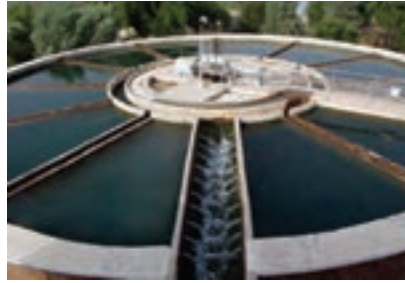
آب در تصفیه‌خانه