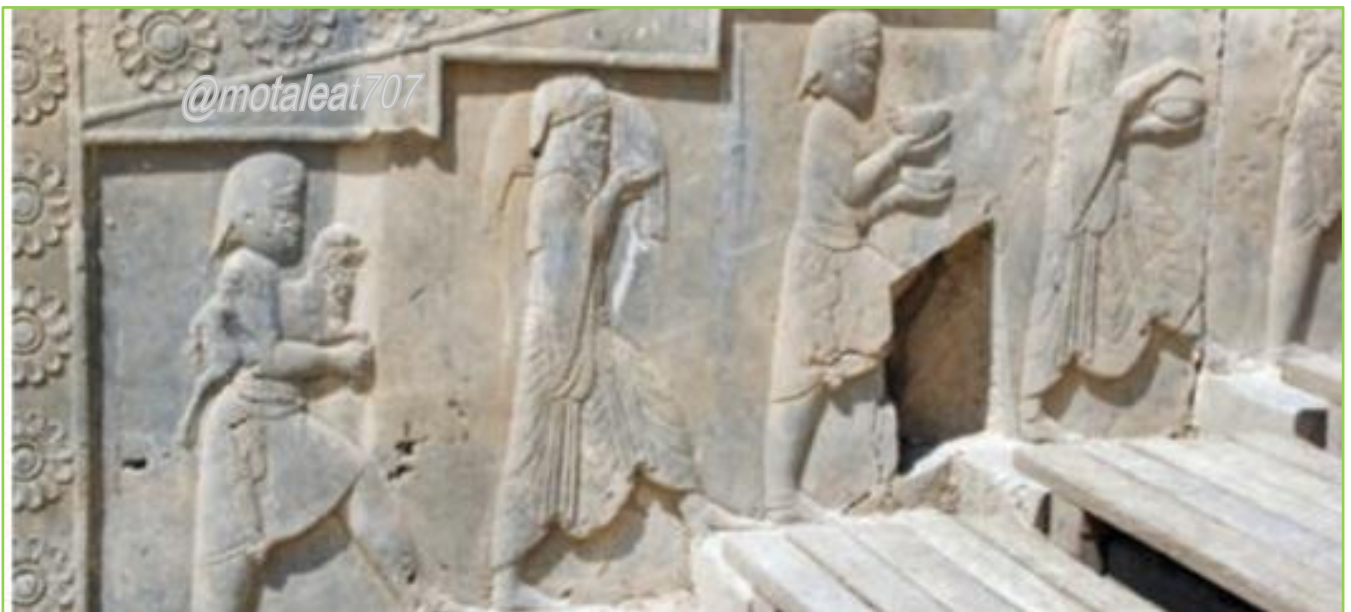
نقش برجسته خدمتکاران در تخت جمشید

در ایران باستان، (۲۳) مالیات، منبع اصلی درآمد حکومتها بود که به صورت نقدی یا جنسی دریافت میشد. (۲۴) بیشترین حجم مالیات را کشاورزان میپرداختند. دامداران به نسبت تعداد دامهایشان و پیشهوران و بازرگانان نیز به میزان کالا و خدماتی که عرضه میکردند، مالیات میدادند. علاوه بر اینها، نوع دیگری از مالیات به نام مالیات سرانه وجود داشت (۲۵) که فقط از عامه مردم وصول میشد و بزرگان و اشراف از پرداخت آن معاف بودند. همچنین (۲۶) در جشن ها و مراسم به تخت نشستن شاهان، بزرگان و عامه مردم هدایایی را به پادشاه پیشکش میکردند. (۲۷) مأموران مالیاتی معمولاً نسبت به مردم سختگیری و ستم میکردند و بیش از آنچه مقرر شده بود، طلب مینمودند. (۲۸) گاهی به دلیل خالی بودن خزانه، میزان مالیاتها را افزایش میدادند. البته در مواقعی نیز به سبب جلوگیری از شورش مردم و یا بروز خشکسالی، فشار برای گرفتن مالیات کمتر می شد.