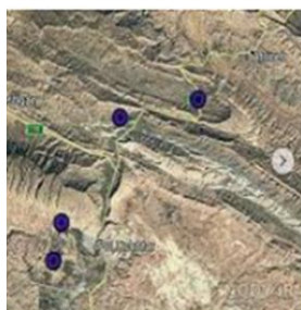
عکس هوایی لرستان

عکس های معمولی با دوربین از مناظر طبیعی، شهر ها، خانه ها و فعالیت های انسانی گرفته می شود.