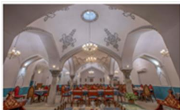
حمام کب خرم آباد

۲. عکس: عکس ها وسیله مهمی برای مطالعه و شناخت محیط هستند.