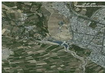
تصاویر ماهواره ای از "بروجرد"

تصاویر ماهواره ای: توسط ماهواره ها تهیه و به زمین فرستاده می شود. از این تصاویر اطلاعات زیادی درباره مکان ها به دست می آوریم.