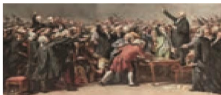
مجلس فرانسه در دوران انقلاب

۲۱- چه کسانی احزاب سوسیالیستی و کمونیستی را تشکیل دادند؟