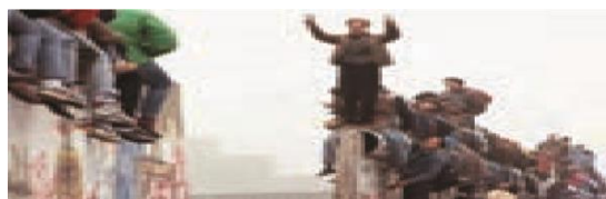
فروپاشی دیوار برلین: این دیوار به مدت ۲۸ سال این شهر را به دو قسمت شرقی و غربی تقسیم کرده بود.

بنابراین، چالش بلوک شرق و غرب از نوع چالش هایی بود که درون یک فرهنگ و تمدن پدید می آید، نه از نوع چالش هایی که بین فرهنگ های مختلف، شکل می گیرد.