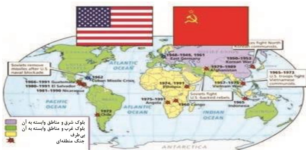
■ چالش و نزاع بلوک شرق و غرب در قرن بیستم

چالش و نزاع بلوک شرق و غرب در سراسر قرن بیستم تا زمان فروپاشی بلوک شرق در سال ۱۹۹۱ م ادامه یافت.