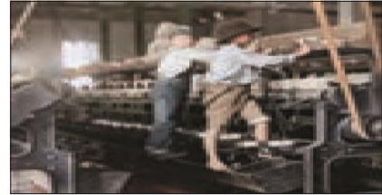
■ بهره کشی از کودکان در دوران انقلاب صنعتی

۸- نظریه پردازان لیبرال، چه عاملی را ضامن پیشرفت جامعه می دانستند؟