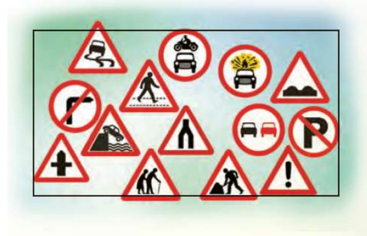
Traffic Signs: تابلوهای راهنمایی و رانندگی