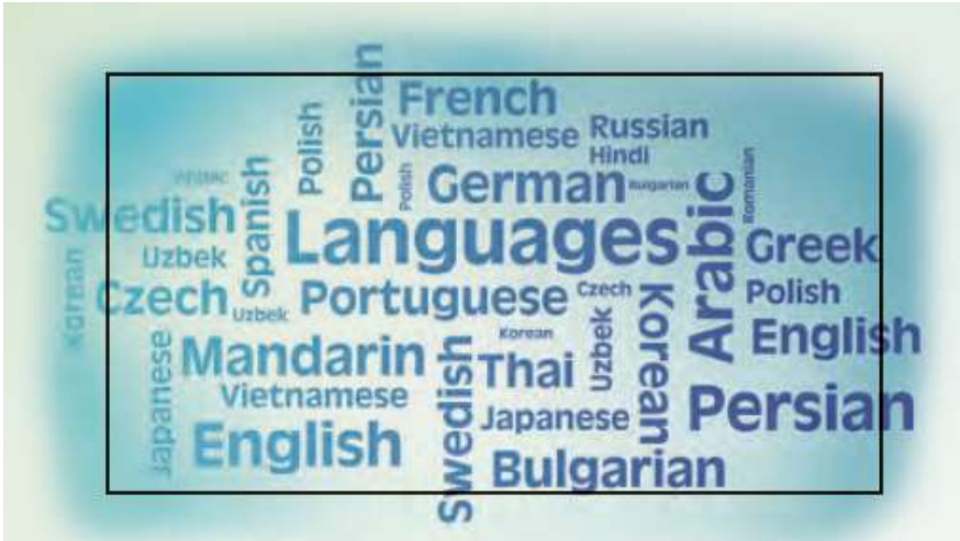
Different Languages: زبان های مختلف