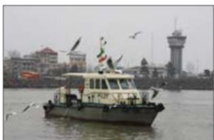
ساحل بندر انزلی - گیلان