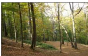
جنگل گلستان - استان گلستان

عملکرد مثبت و منفی انسان را در هر یک از نواحی زیر بررسی کنید و جدول را کامل نمایید