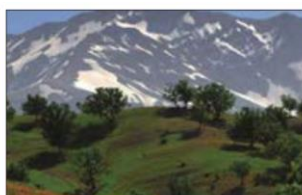
زردکوه - چهارمحال بختیاری