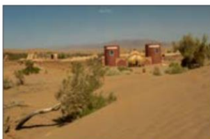
کوبر مصر - اصفهان