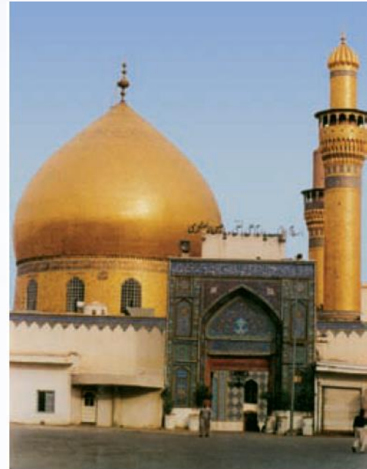
گنبد حرم امام هادی و امام حسن عسکری علیهما السلام