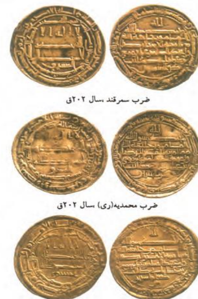
ضرب سمرقند سال ۲۰۲ ق

مناره مسجد جامع سامرا که در دوره خلافت متوکل ساخته شد