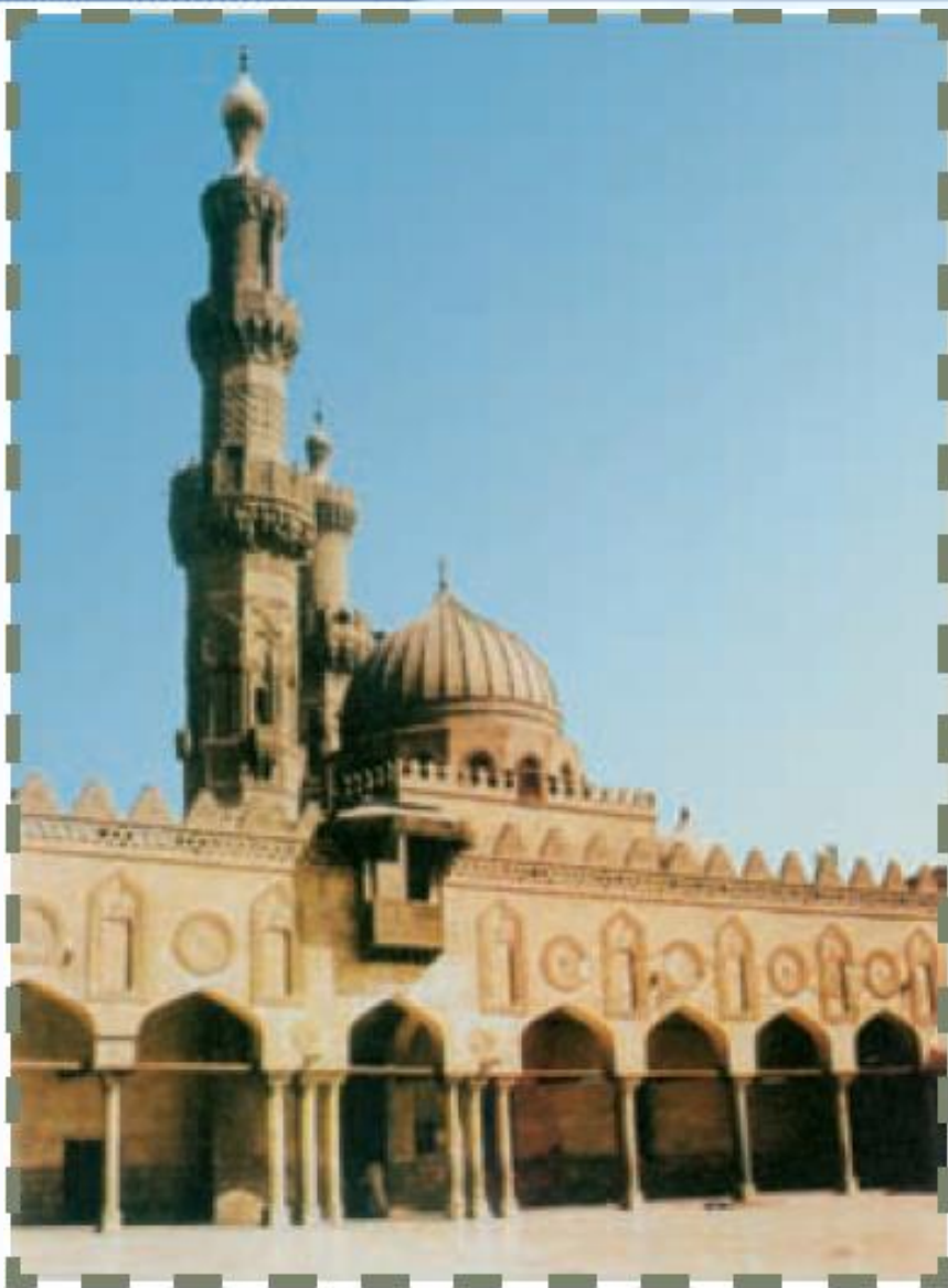
مسجد الازهر قاهره