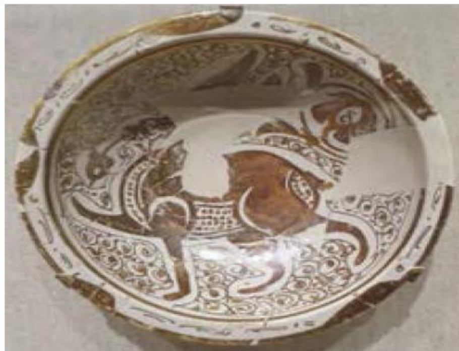
نمونه‌ای از ظروف سفالی عصر قاطمیان