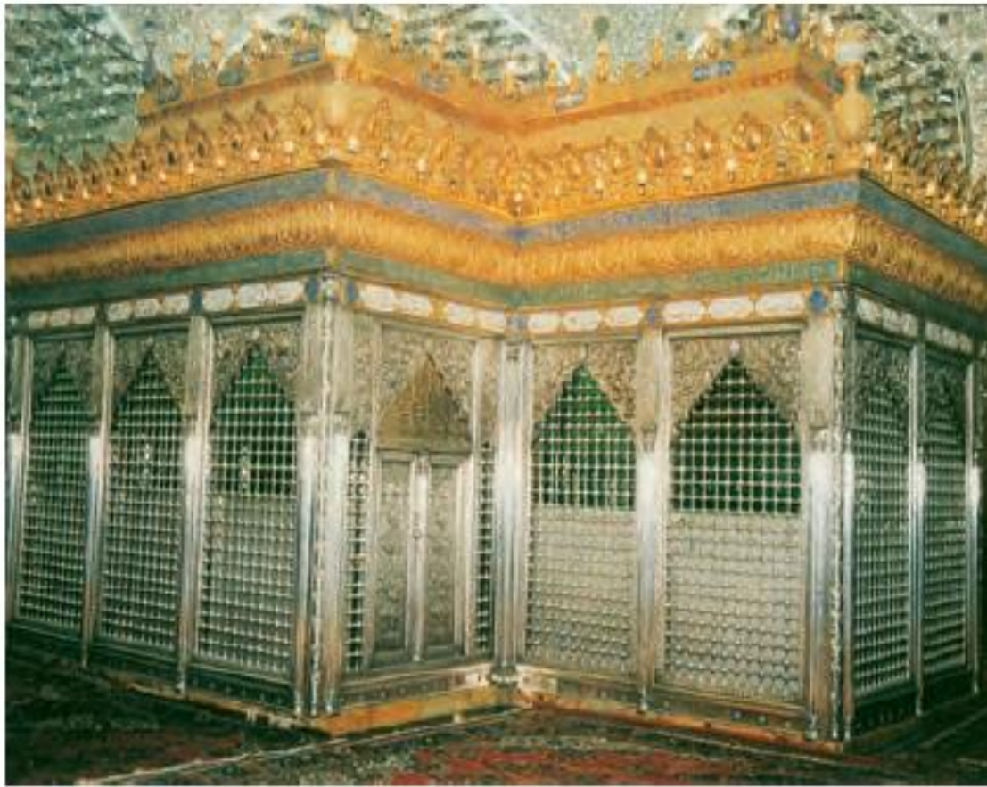
ضريح حرم مطهر امام هادی و امام حسن عسکری علیهما السلام