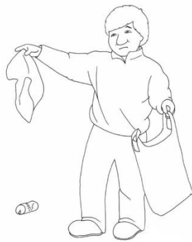
نیکی به طبیعت