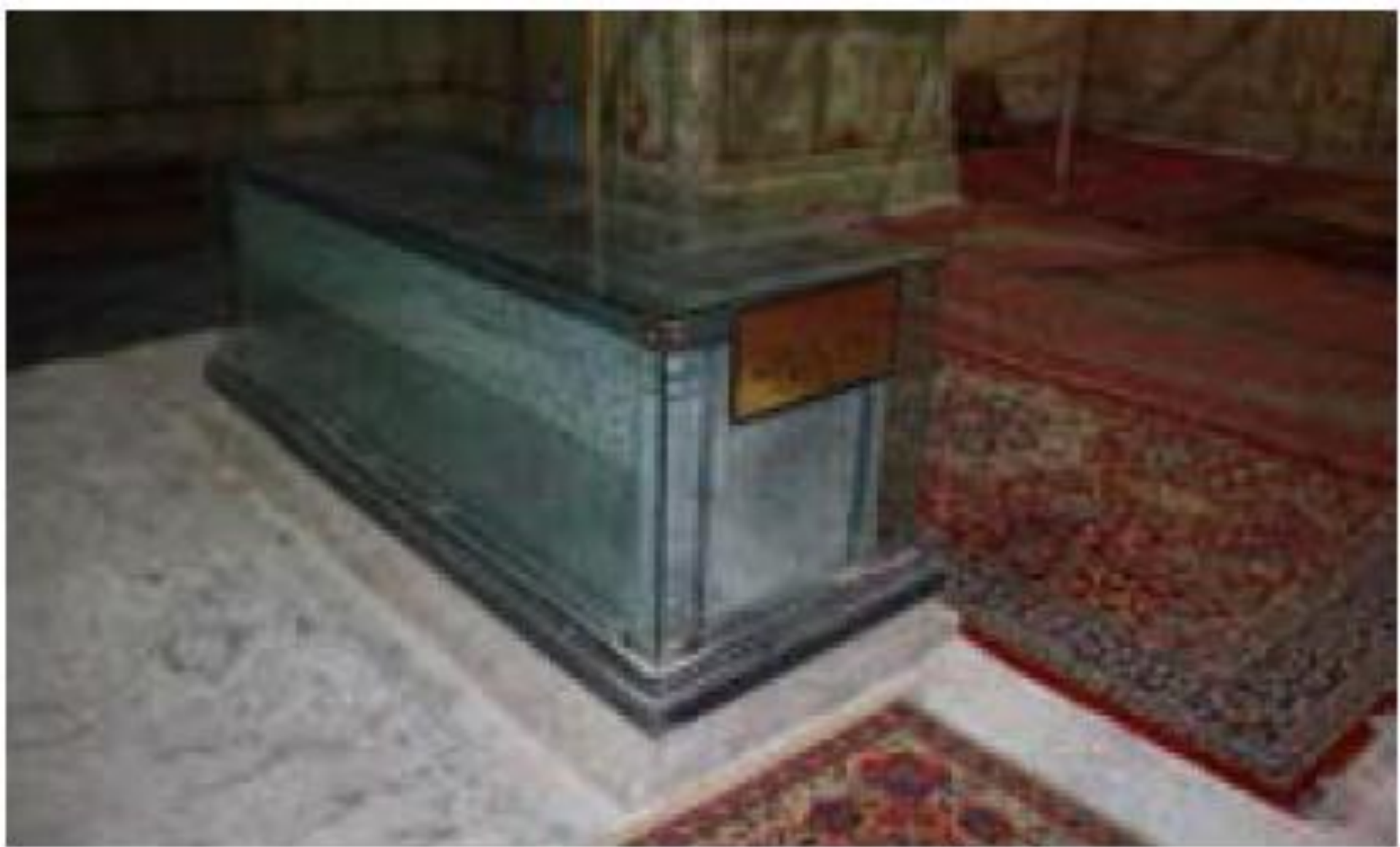
مزار شاه عباس اول - آرامگاه حبیب بن موسی کاشان