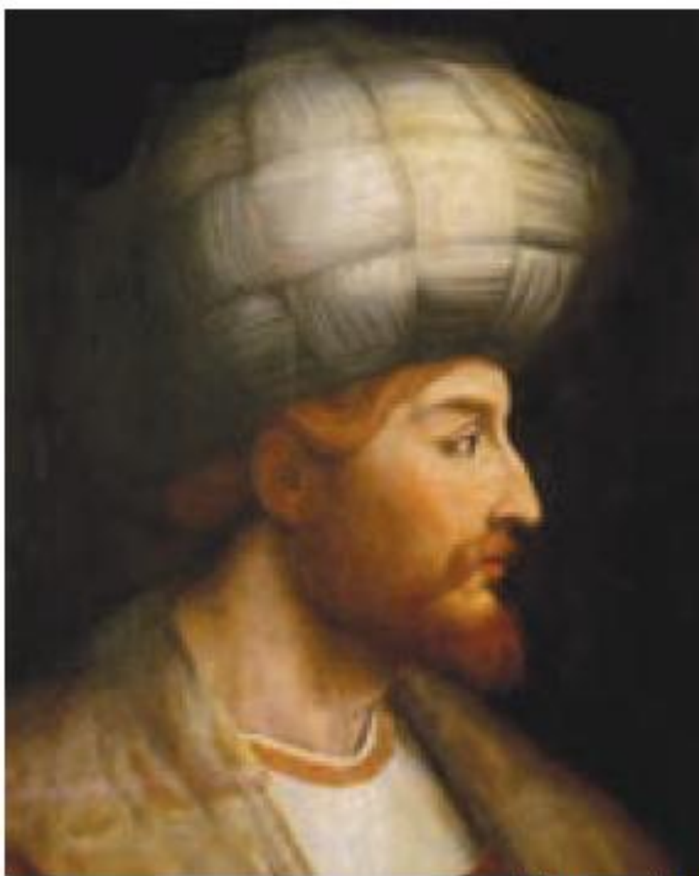
شاه اسماعیل اول