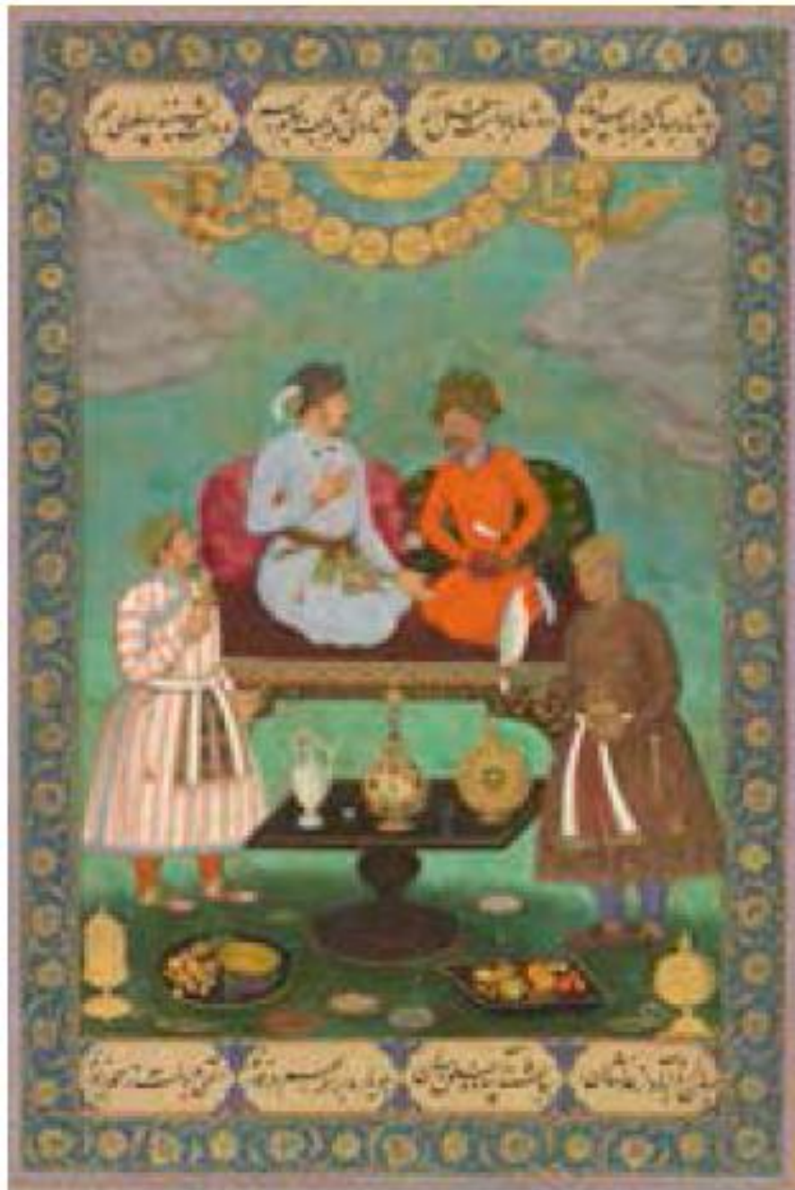
شاه عباس اول صفوی و جهانگیر پادشاه گورکانی هند