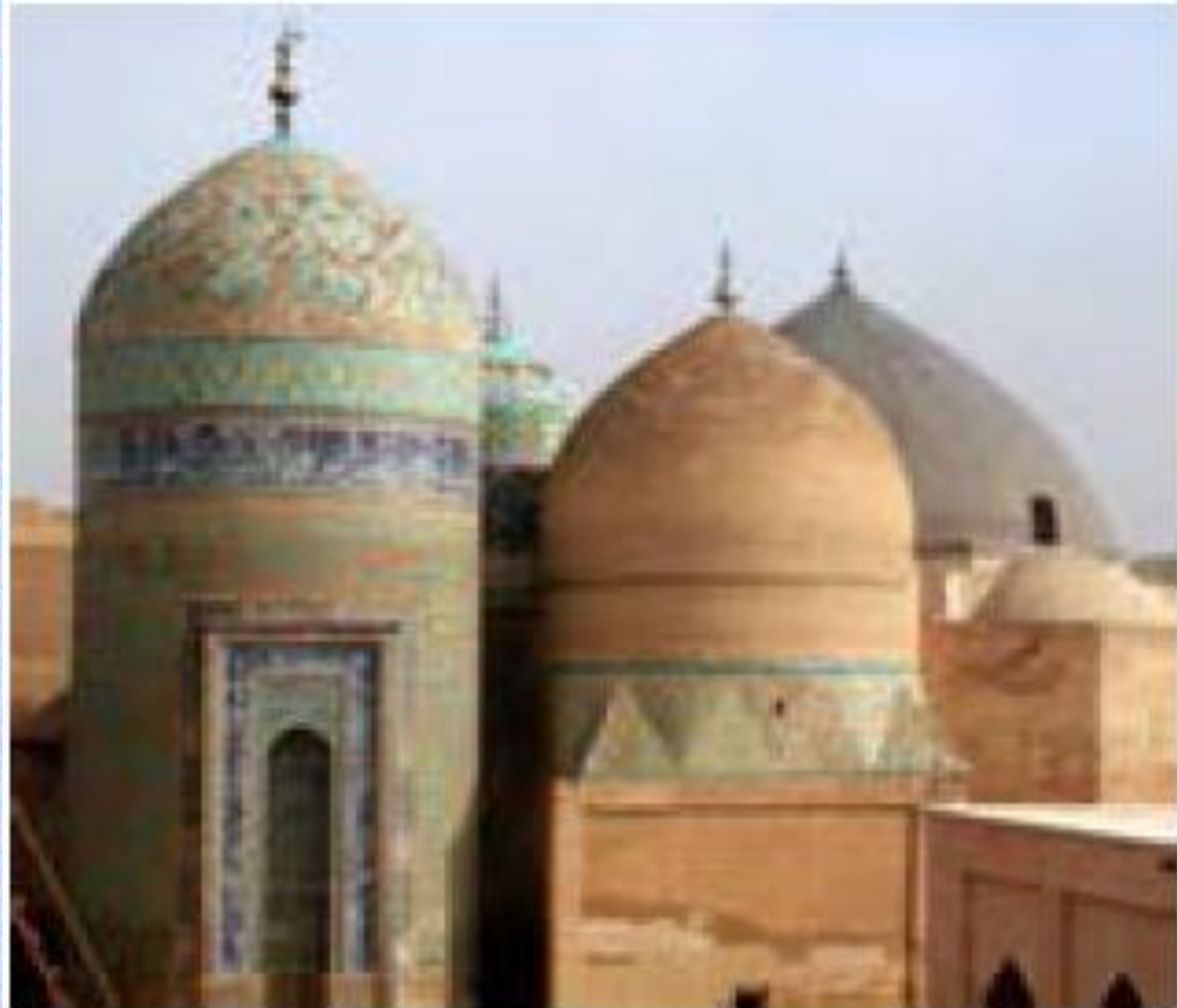
بقعة شيخ صفى الدين اردبيلى - اردبيل