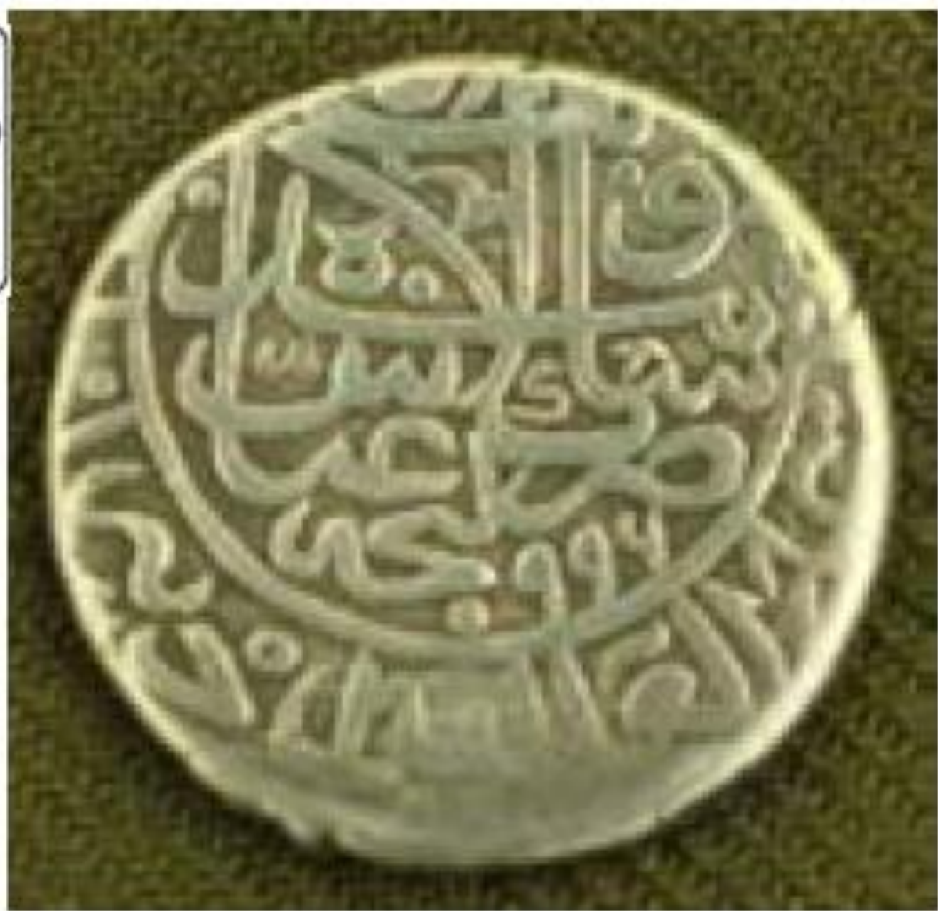
سکه شاه عباس اول