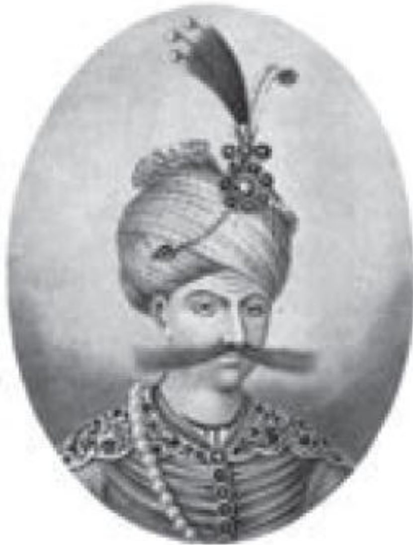
شاه عباس اول صفوی