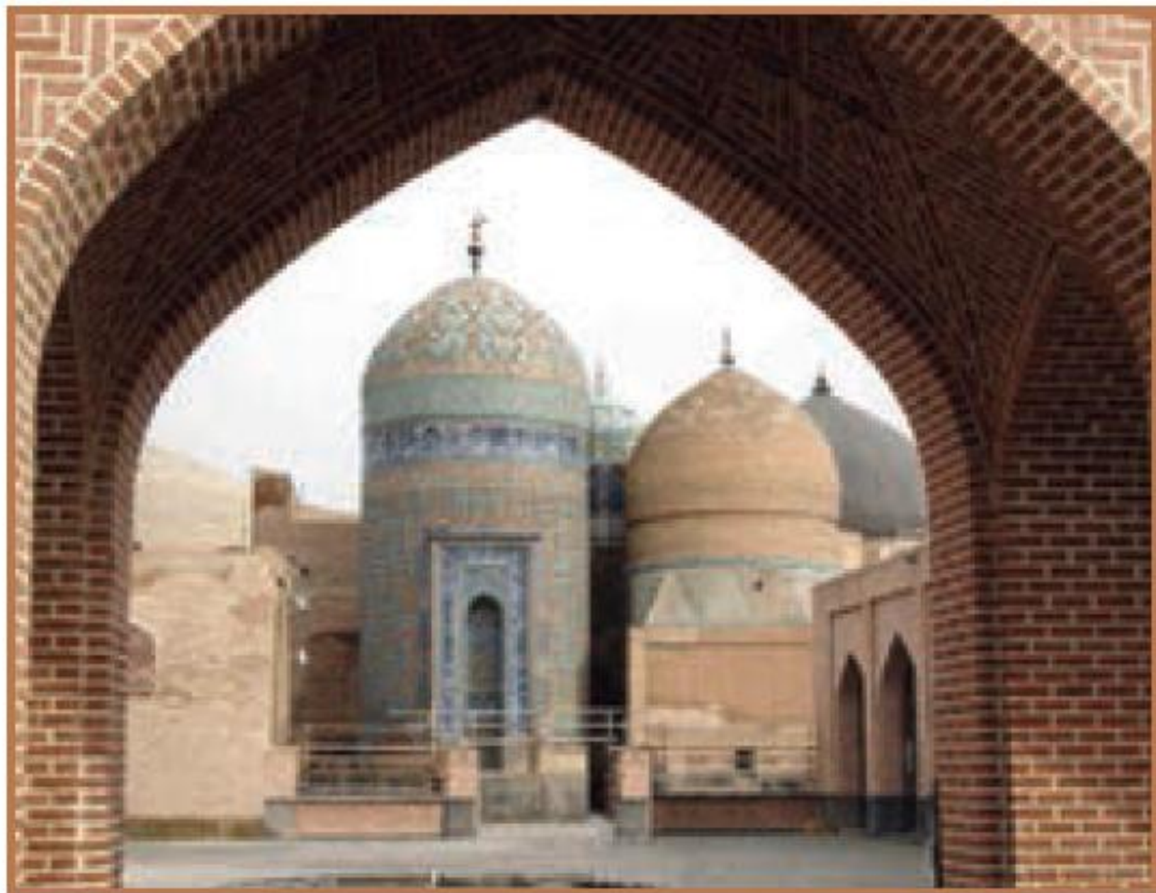
بقعة شیخ صفی الدین اردبیلی در شهر اردبیل