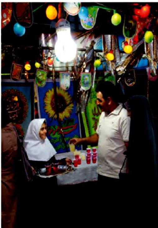
جشن نیمه شعبان

به تصویرهای زیر توجه کنید. این تصویرها چه روزهایی را نشان می‌دهند؟