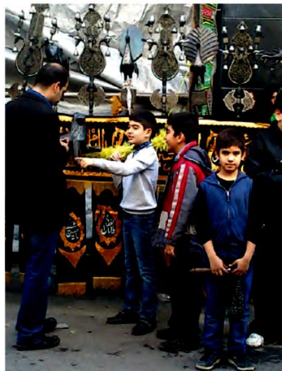
عزاداری‌های تاسوعا و عاشورا