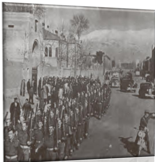
رژه نظامیان انگلیس در خیابان های تهران (جنگ جهانی دوم)

جنگ جهانی دوم با حمله ناگهانی آلمان به لهستان آغاز شد.