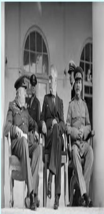
استایل (از شوروی)، روزولت (از آمریکا) و چرچیل (از انگلیس)

سران متفقین در منطقی از جنگ جهانی دوم، جهت تصمیم گیری برای آینده جنگ و نحوه تقسیم جهان بین خود، به تهران آمدند. رؤسای کشورهای آمریکا، انگلیس و شوروی بدون اینکه به محمدرضا شاه چیزی بگویند و حتی او را از سفر خود مطلع کنند از ۹ تا ۱۹ آذر ۱۳۲۲ در سفارت شوروی در تهران به سر بردند و بعد از برپایی جلسه و اتخاذ برخی تصمیمات، بدون اندکی اعتنا به شاه ایران به کشورهای خود بازگشتند.