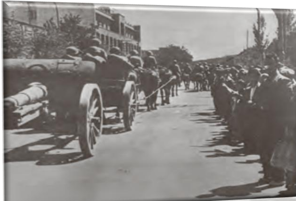
نظامیان شوروی در خیابان های تبریز (جنگ جهانی دوم)