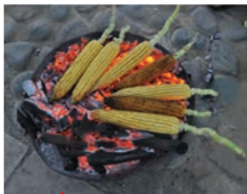
چوب یا زغال سنگ

آیا تا به حال برای پختن غذا از چوب استفاده کرده اید؟ آیا موافقید دیگران هم این کار را انجام دهند؟ چرا؟