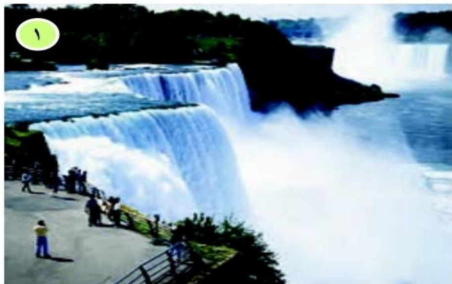
○ آبشار نیاگارا (مرکز کشور کانادا و آمریکا) این آبشار از مجموع سه آبشار به نام های نعل اسب ، آبشار آمریکایی و آبشار نقاب عروس تشکیل شده است.

همچنین کشورهای این قاره دارای مراکز تفریحی ، پارک ها و موزه های حیات وحش بسیار هستند. و از نظر جاذبه های گردشگری تاریخی و غیر طبیعی : کاخ ها ، مراکز خرید و نمایشگاه ها نیز گردشگران زیادی به خود جذب می کنند.