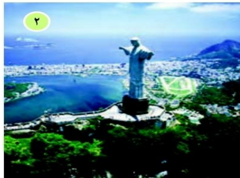
○ ریودوژانیرو، برزیل « تندیس عیسی مسیح (ع) »