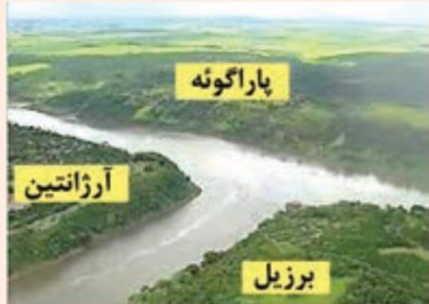
مرز بین سه کشور در آمریکای جنوبی

۱— تصویر الف چه نوع مرزی را نشان میدهد؟ با مراجعه به نقشه آمریکای جنوبی، موقعیت کشورها و رودهای مرزی آن‌ها را توضیح دهید.