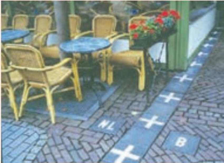
مرز بین بلژیک و هلند