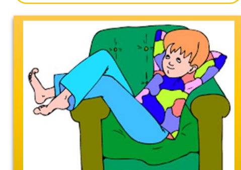
a lazy person یک شخص تنبل