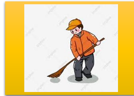
a hard working worker یک کارگر سخت کوش hardworking # تنبل lazy