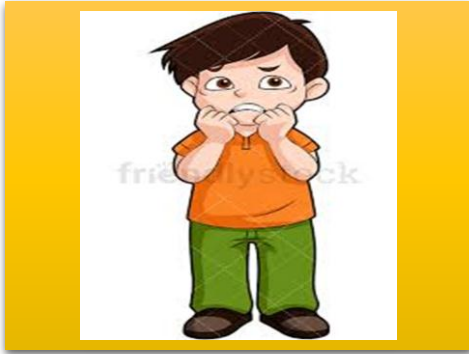
a nervous boy یک پسر مضطرب nervous # خونسرد calm مضطرب