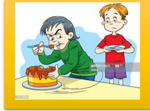
a selfish person یک شخص خودخواه selfish # generous