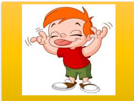
a rude kid یک بچه بی ادب rude بی ادب # مودب polite