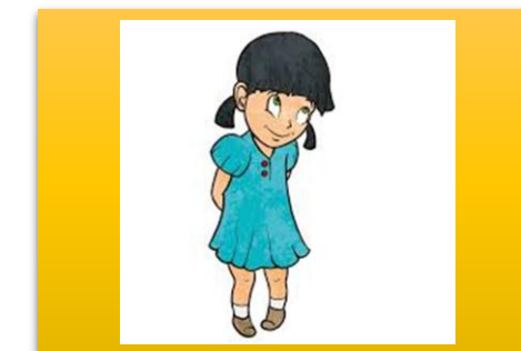
Hamda a shy girl یک دختر خجالتی She is a shy girl