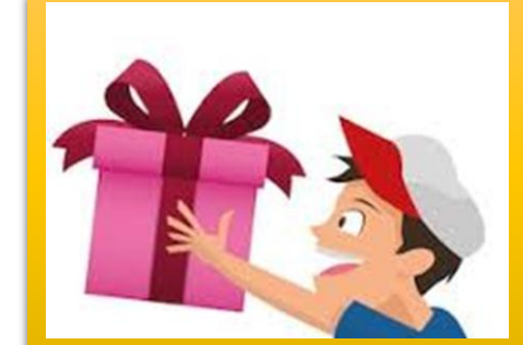
He is a generous boy او یک پسر بخشنده است