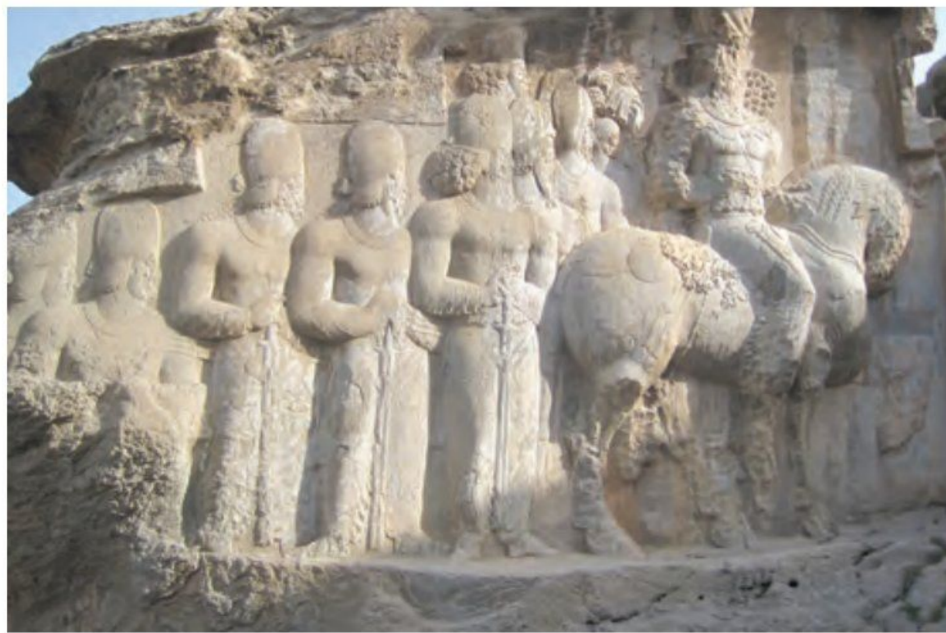
نقش برجسته شاپور یکم - نقش رجب، استان فارس

تثبیت قدرت (ساسانیان مصمم بودند به جای حکومت ملوک طوایفی اشکانی، حکومتی متمرکز و قدرتمند ایجاد کنند که دستورات و قوانین آن در سرتاسر ایران اطاعت شود. از این رو، اردشیر بابکان در آغاز کار با مشکلات متعدد داخلی روبه رو شد. بسیاری از حاکمان محلی که نمی خواستند استقلال نسبی خود را از دست بدهند، با حکومت جدید به مخالفت برخاستند.) 6 اردشیر بسیاری از مخالفان را با جنگ بر سر جای خود نشانده و برخی دیگر را با نامه نگاری و ارائه دلیل های گوناگون با خود همراه کرد.) 7