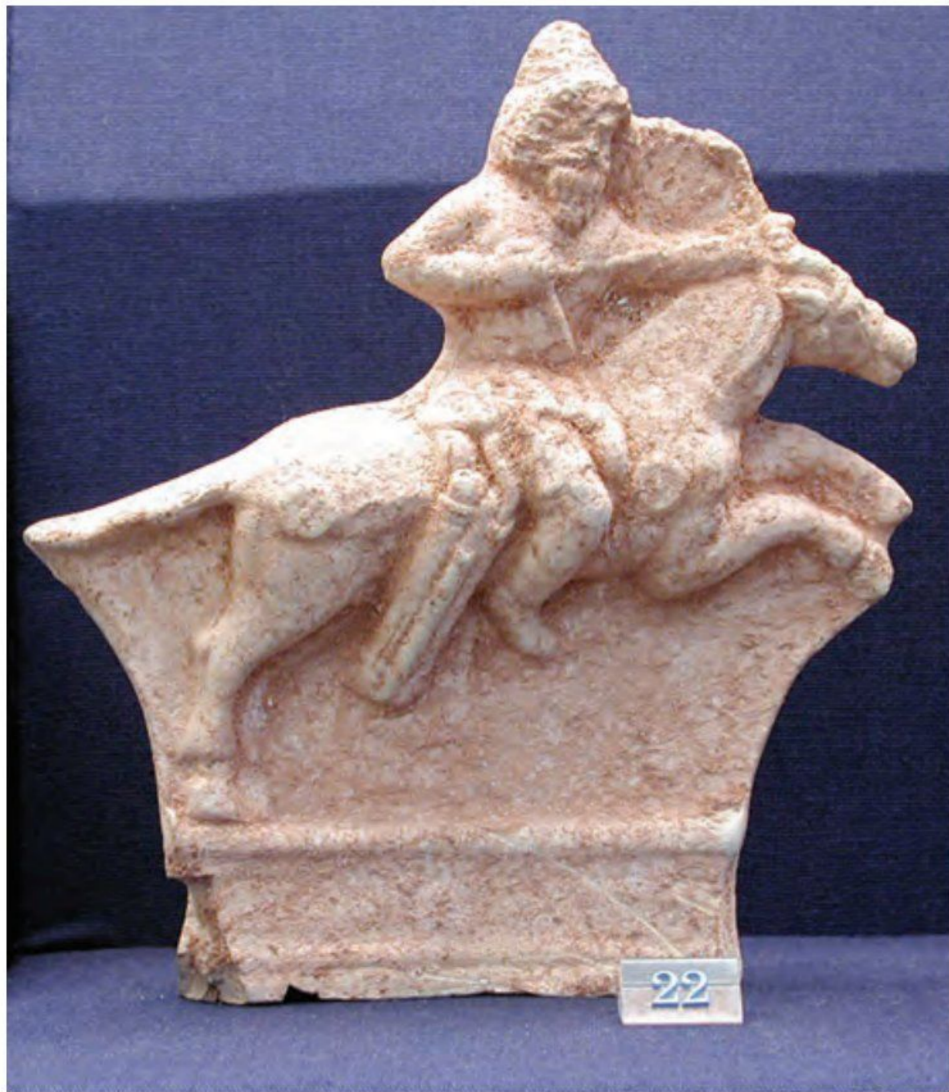
○ سنگ نگاره سواره نظام اشکانی