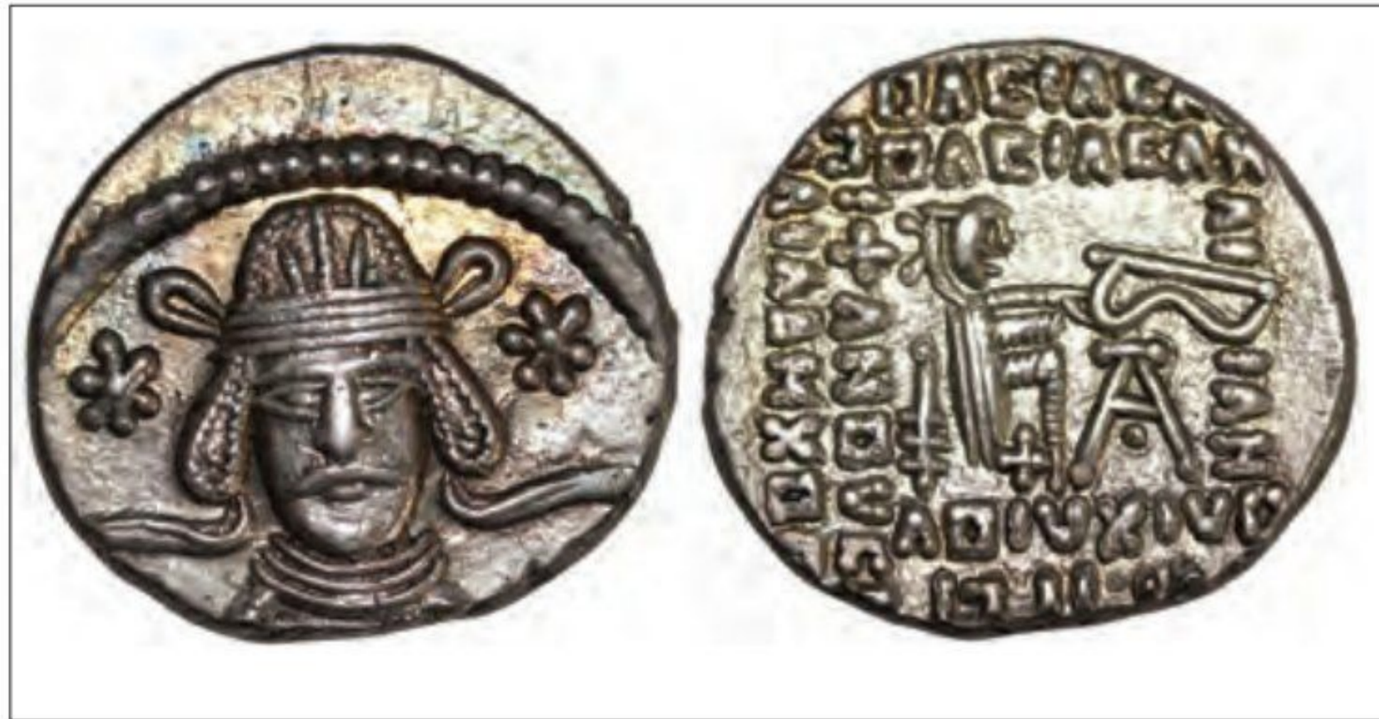
○ سکهٔ ونون دوم - پادشاه اشکانی

اشکانیان را به نهایت خود رساند و پایه‌های قدرت و سلطنت آنان استوار شد.