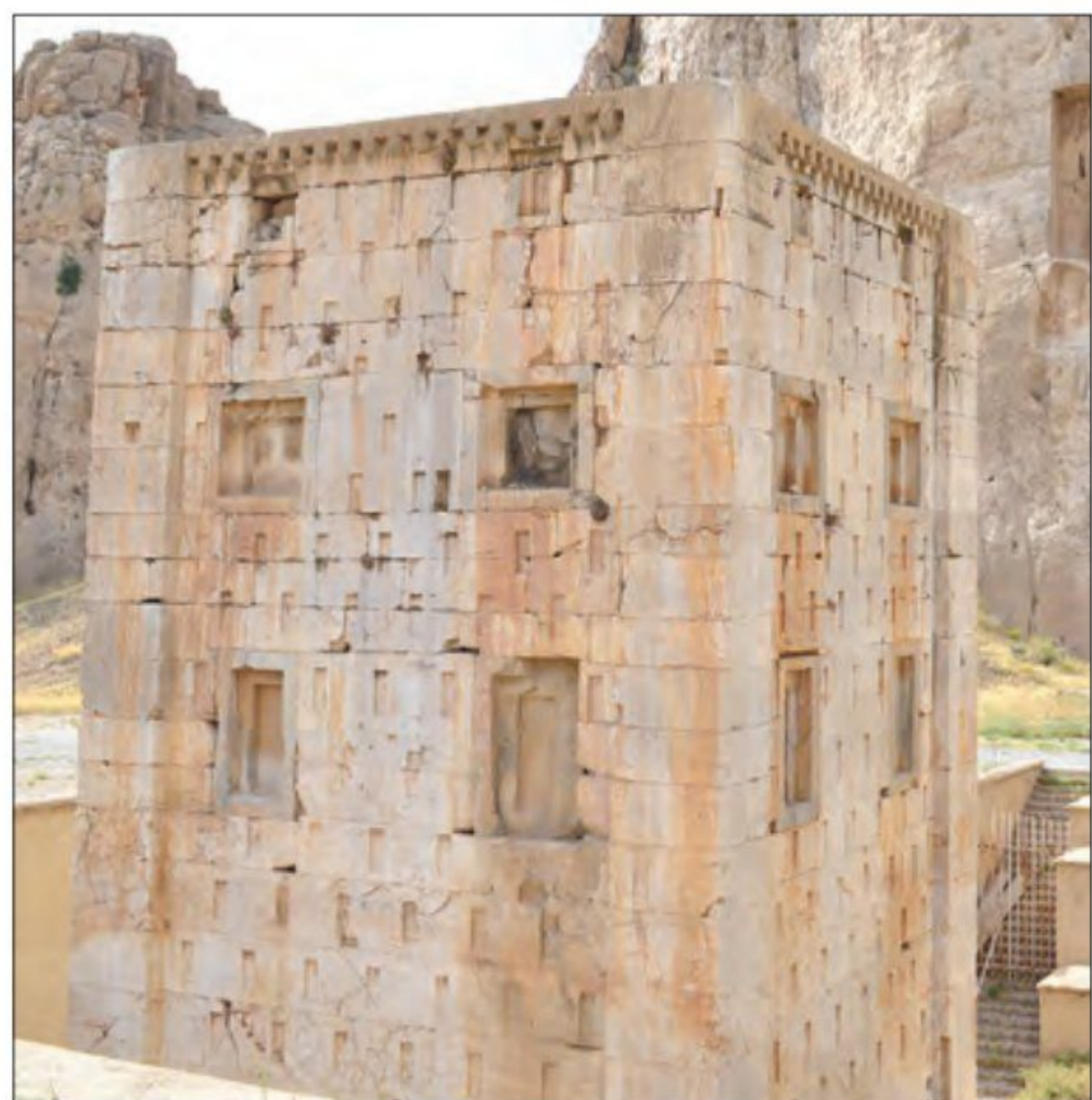
بنایی در نقش رستم که به «کعبه زرتشت» معروف شده و سنگ نوشته شاپور یکم بر دیوار آن قرار گرفته است.