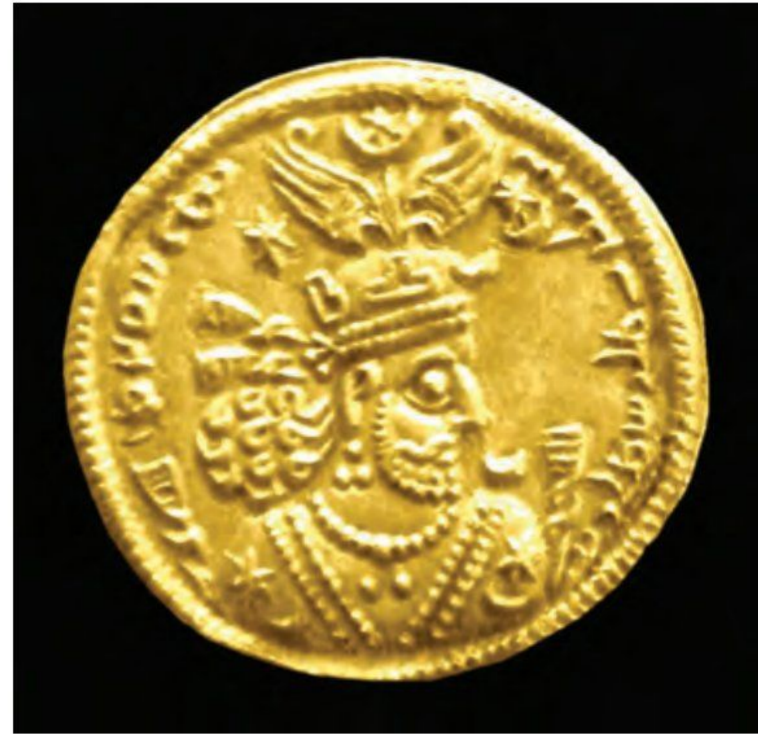
سکه خسرو انوشیروان

ساسانیان بارها ناچار به جنگ با رومیان شدند. دو مورد از این جنگ‌ها در زمان شاپور یکم اتفاق افتاد که در یکی از آنها گردیانوس، امپراتور روم، کشته شد و در دیگری والرینوس، امپراتور روم به اسارت در آمد. (در زمان خسرو پرویز نیز نبردهای بزرگی میان دو کشور رخ داد که در آغاز، ساسانیان پیروز شدند، اما در پایان، به سختی شکست خوردند. البته بعضی اوقات نیز دو طرف، مذاکره و سازش را بر ستیز ترجیح می‌دادند و با امضای پیمان صلح، آرامش بر روابط آنها حکم فرما می‌شد.) 4