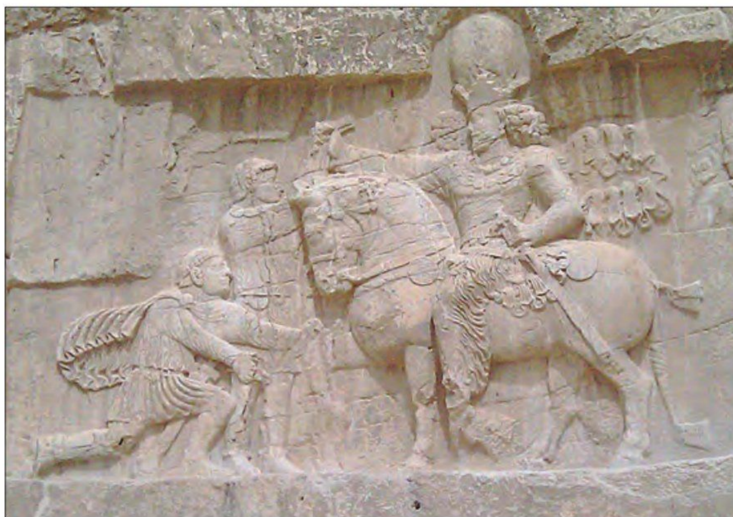
نقش برجسته شاپور یکم و والرین، امپراتور اسیر روم - نقش رستم