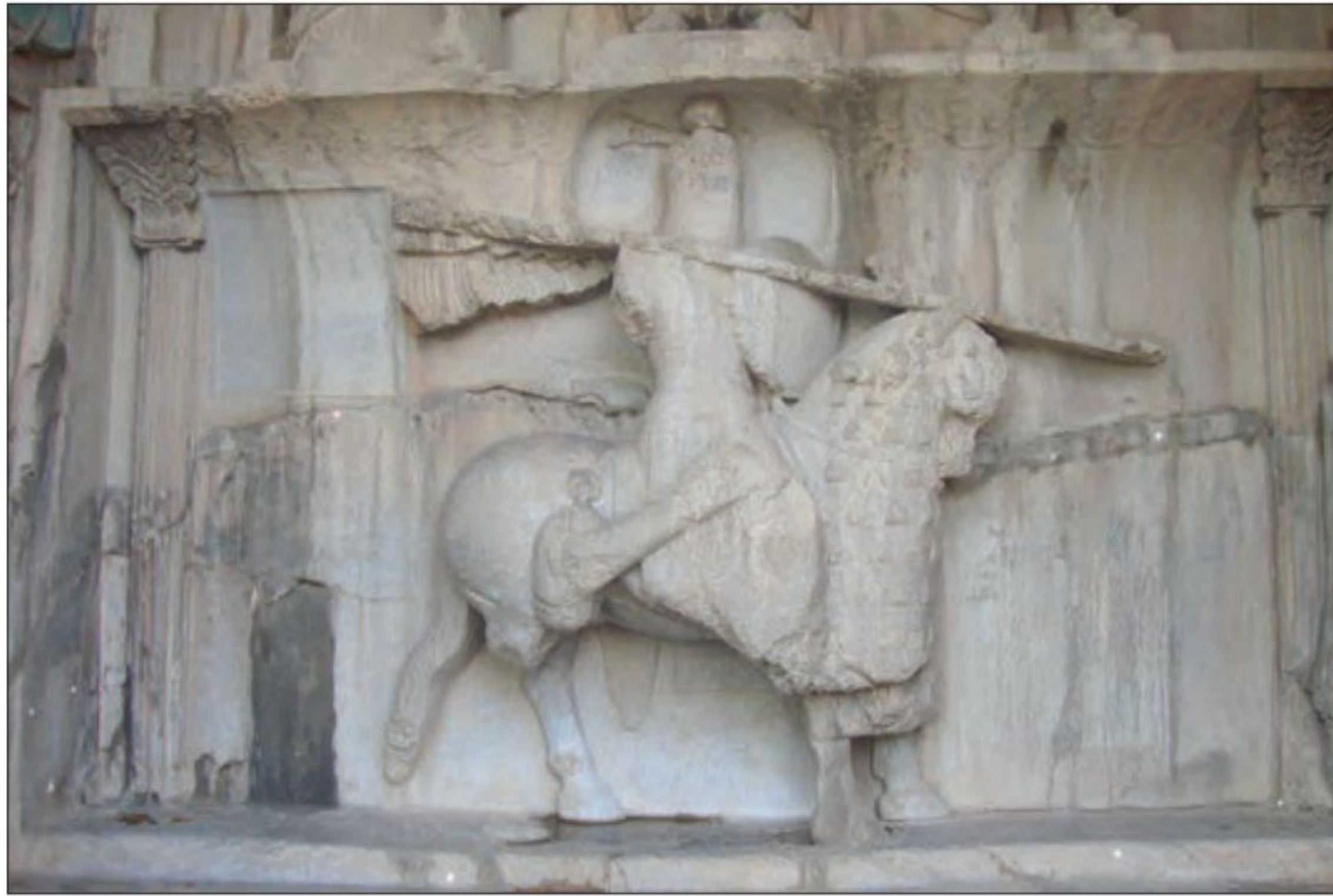
نقش برجسته خسرو پرویز - طاق بستان، کرمانشاه

و یکی از سرداران مشهور به نام بهرام چوبین، با پشتیبانی (خسرو پرویز، پسر هرمز، به بیزانس (امپراتوری روم شرقی) بزرگان، علیه پادشاه سر به شورش برداشت و او را از قدرت برکنار کرد و خود به جای او بر تخت پادشاهی نشست. 1) گریخت و با حمایت امپراتوری روم، به تاج و تخت رسید.