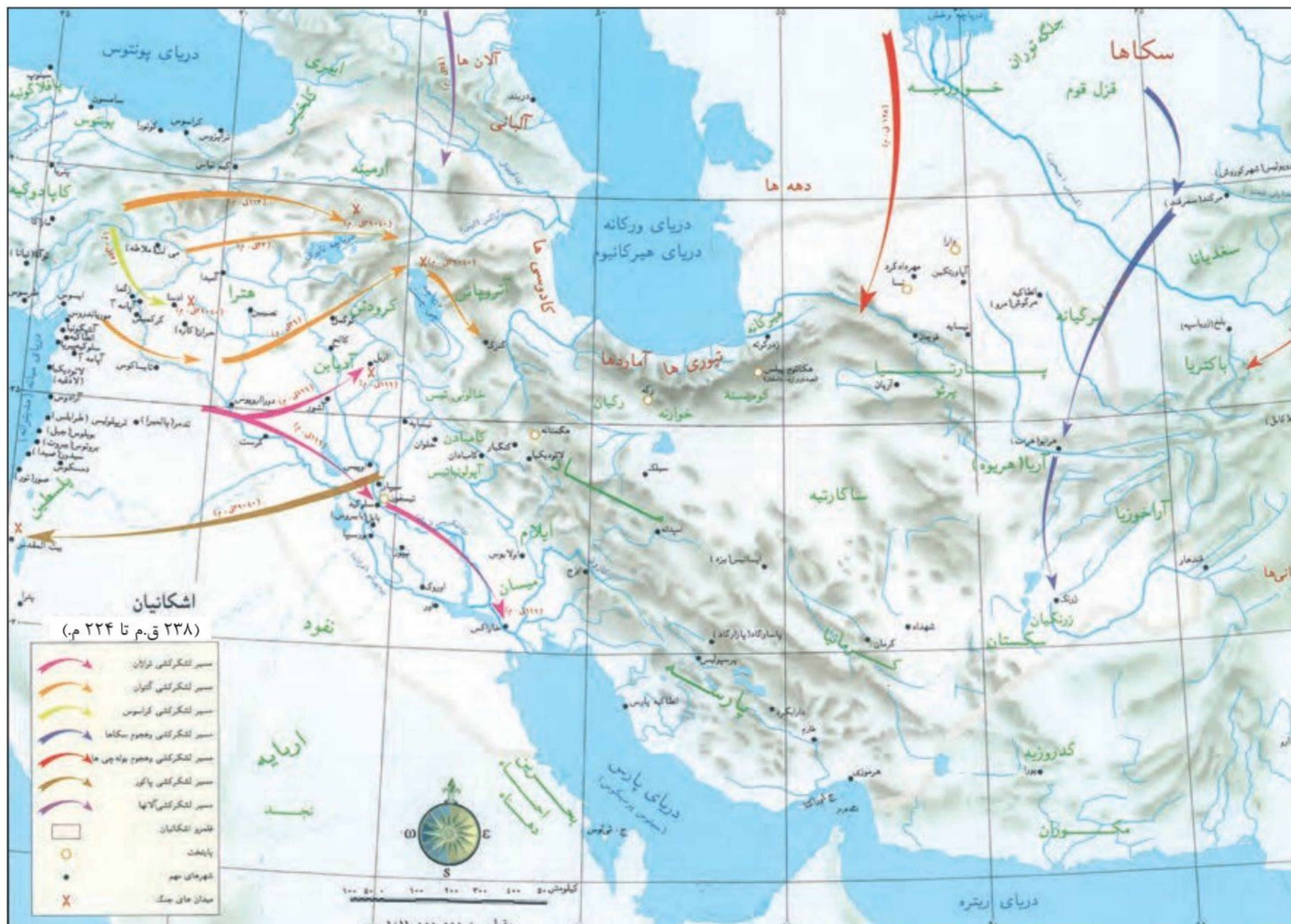
○ نقشه قلمرو اشکانیان

4. فتوحات ..... مهرداد دوم وسعت قلمرو اشکانیان را به نهایت خود رساند و پایه‌های قدرت و سلطنت آنان استوار شد