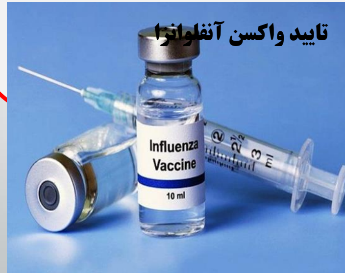
تایید واکسن آنفلوانزا