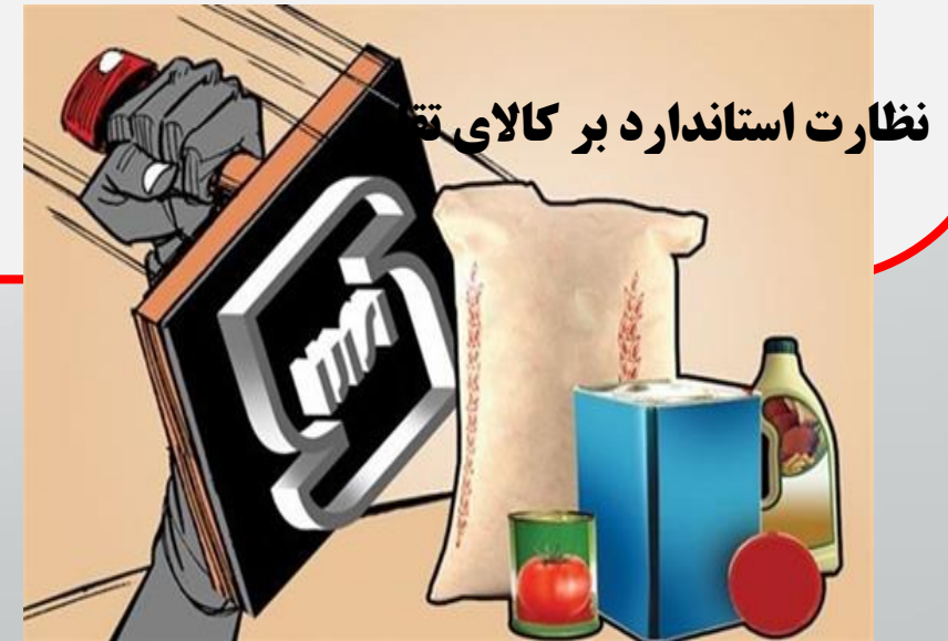
نظارت استاندارد بر کالای تقو