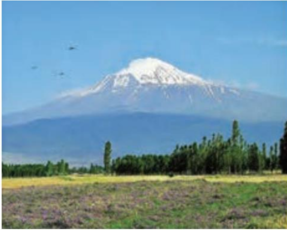
○ کوه آرارات، ترکیه

( با توجه به وسعت زیاد و تنوع ناهمواری‌ها، در این منطقه آب و هوای گوناگونی به وجود آمده است. ) نواحی مرتفع جنوب غربی آسیا از نظر آب و هوا چگونه اند؟