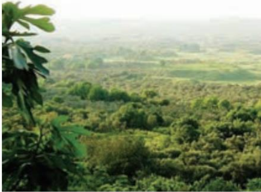
○ باغ‌های زیتون، لبنان

* آن بخش از سرزمین‌هایی که در سواحل دریاهای این منطقه قرار گرفته‌اند، آب و هوای متفاوتی دارند. سرزمین‌های واقع در سواحل گرم خلیج فارس، دریای عمان و اقیانوس هند و دریای سرخ، آب و هوای گرم دارند اما رطوبت هوا به دلیل نزدیکی به دریا زیاد بوده و حالت شرجی به وجود آورده است.