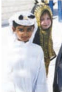
○ چهره کودکان عرب

منطقه جنوب غربی آسیا یکی از نخستین کانون‌های تمدنی جهان است. سال گذشته با بعضی تمدن‌های باستانی که در ایران و بین‌النهرین شکل گرفته و چند هزار سال قدمت دارند، آشنا شدید. جمعیت: در این منطقه، اقوام گوناگونی زندگی می‌کنند. به نمودار جمعیتی کشورهای جنوب غربی آسیا دقت کنید.