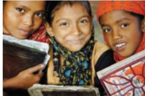
○ چهره کودکان پاکستانی