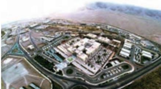
○ شهرک علمی و تحقیقاتی اصفهان

چرا دو کشور عراق و افغانستان نتوانسته‌اند از نظر اقتصادی پیشرفت کنند؟