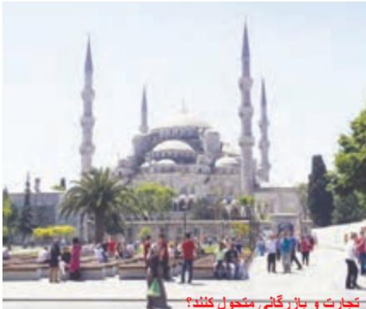
○ استانبول، ترکیه، مسجد ایاصوفیا و تجارت و بازرگانی متحول کنند؟

صادرات نفت، همه ساله درآمد زیادی را از طریق مراسم حج و سفر میلیون‌ها زائر به این کشور نصیب خود می‌کند.