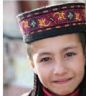
○ چهره کودک تاجیک