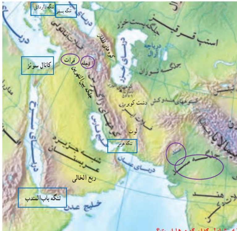
سرزمین های مرتفع خاورمیانه شامل کدام کوه ها است؟

در جنوب غربی آسیا، سرزمین های بسیار بلند و سرزمین های پست و همواری وجود دارند: ص غ