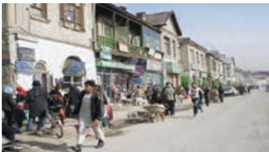
○ کابل، افغانستان

→ دو کشور جنوب غربی آسیا که به دلیل اشغال نظامی و جنگ و نبود امنیت نتوانسته‌اند پیشرفت کنند کدامند؟