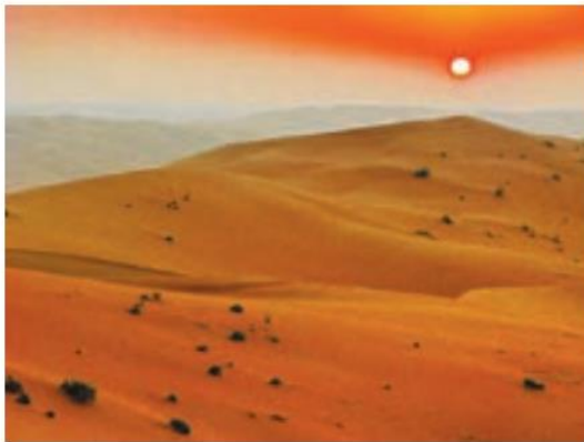
○ بیابان ریح الخالی، عربستان

یعنی تقریباً ۲/۵ برابر کشور انگلستان، وسعت دارد.)