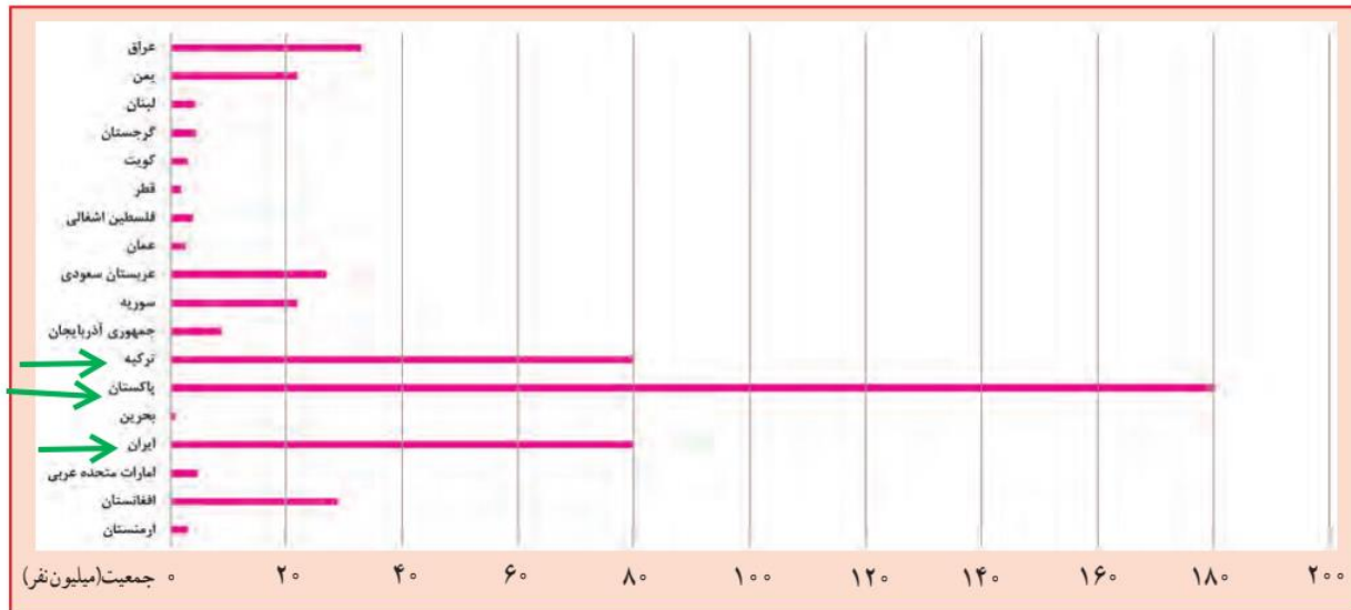
مقایسه جمعیت کشورهای آسیای جنوب غربی

پر متکلم‌ترین زبان‌های منطقه جنوب غربی آسیا کدامند؟