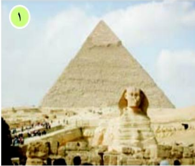
○ . اهرام، مصر، و مجسمه ابوالهول