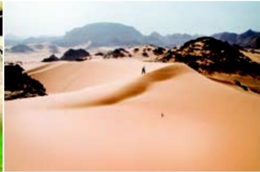
○ تصویری ماهواره‌ای صحرای بزرگ آفریقا ○ آفریقای خشک، صحرا (Sahara)ی بزرگ با تپه‌های ماسه‌ای عظیم