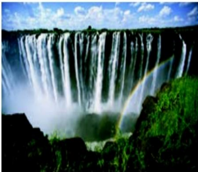
○ آبشار ویکتوریا در اثر فرو ریختن آبهای رود زامبیز در محل یک گسل (شکستگی)، پدید آمده است.