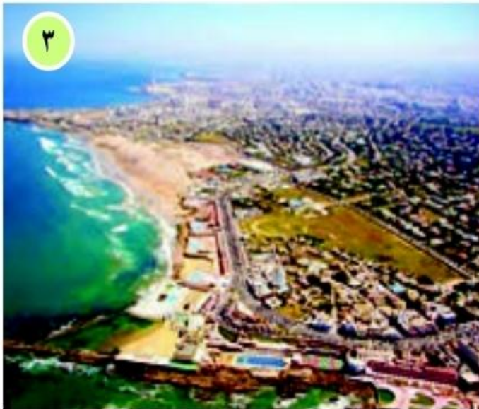
○ کازابلانکا، مراکش