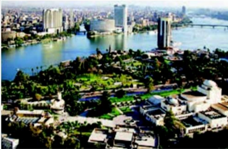
رود نیل از شهر قاهره پایتخت مصر عبور می کند.

رود نیل طویل ترین رود جهان است. (۶۶۹۵ کیلومتر)