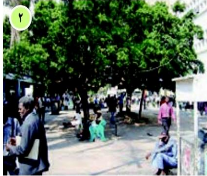
○ خیابانی در حراره، زیمبابوه