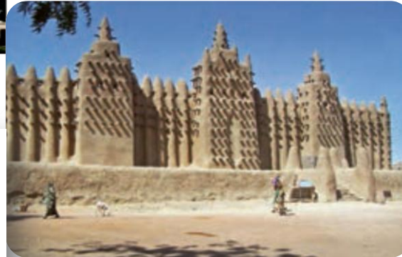
مسجد بزرگ مالی

مانند : مصر - لیبی - الجزایر چاد - نیجر - مالی - مراکش