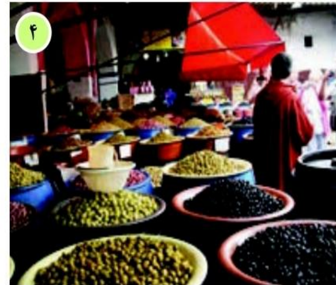
○ فروشگاه زیتون در کازابلانکا، مراکش