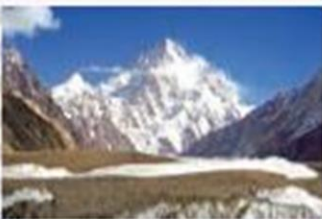
۸ قله‌ی «کی ۲» با ارتفاع بیش از ۸۰۰۰ متر در پاکستان قرار دارد.