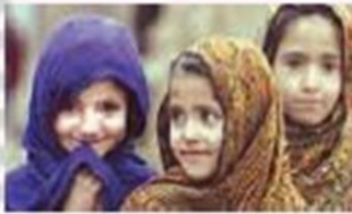
۸ بچه‌های پاکستان

پاکستان پرجمعیت‌ترین کشور همسایه ایران است.